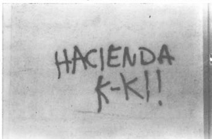
I un altre de prima única...

En el darrer número de GROC inaugurava aquesta mini-mostra de les pintades de Balaguer amb una mena d'exposició de motius. Deixeu-me avui comentar-vos un parell de coses sobre aquest sub-producte artístic tan característic del segle XX. Sorprenentment, aquest gènere literari o modalitat artística que són les pintades, s'ha resistit a desaparèixer amb els anys, malgrat que canviant els estils, les formes i els continguts expressius. Aquells que pensaven que amb l'arribada de les llibertats democràtiques, les pintades desapareixerien de les parets, s'equivocaven. Després de 12 anys de llibertat d'expressió, si més no formal, encara hi ha qui prefereix gastar-se els duros comprant un pot d'"spray", i aprofita la protectora tenebra de la nit per a deixar-nos aquests missatges murals als ciutadans de Balaguer. Els qui pensaven que l'anomenada llibertat d'expressió portaria automàticament la fi de les pintades, potser no varen acabar mai d'entendre la particular força expressiva que adquireixen les parets escrites pel damunt dels papers impresos. Perquè allò que porta a algú a deixar la seva petjada escrita en una tàpia, no és tan la impossibilitat de