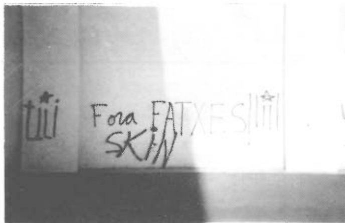
Cap polític de Balaguer no s'ha donat per al·ludit