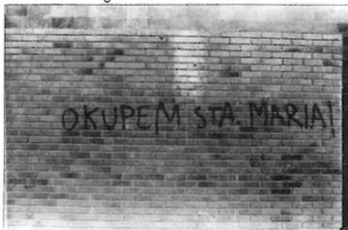
S'ha acabat l'època dels salvaments