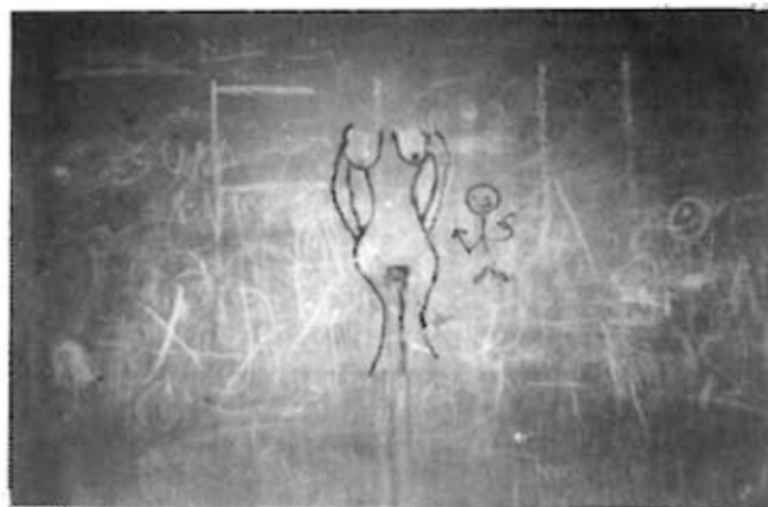
Imatge maternal subconscient