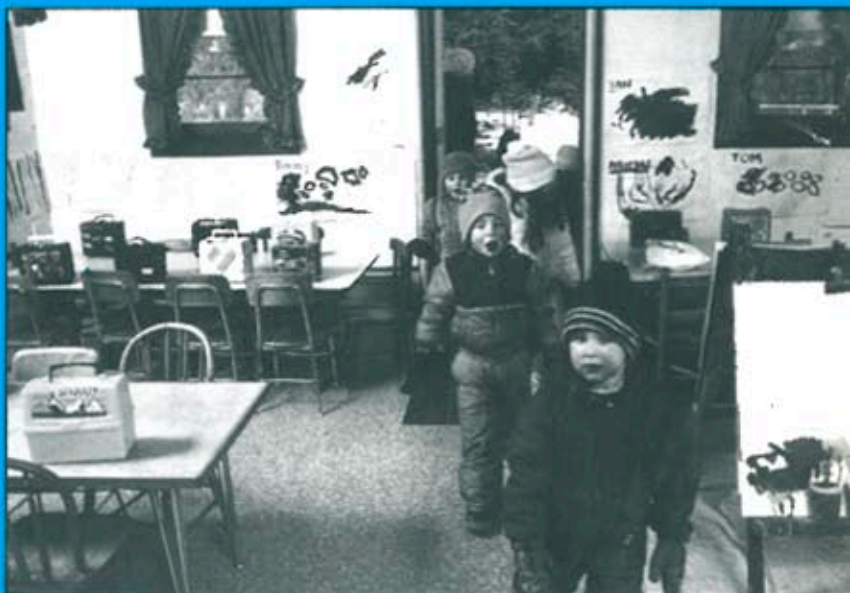
La nova reforma escolar ha canviat per complert el calendari dels estudiants.