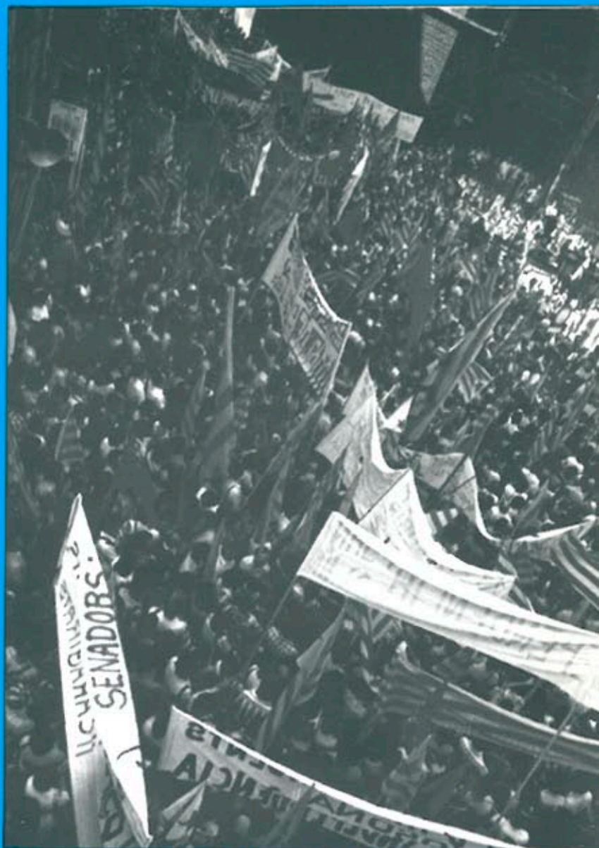
L'Onze de Setembre, Diada Nacional de Catalunya.