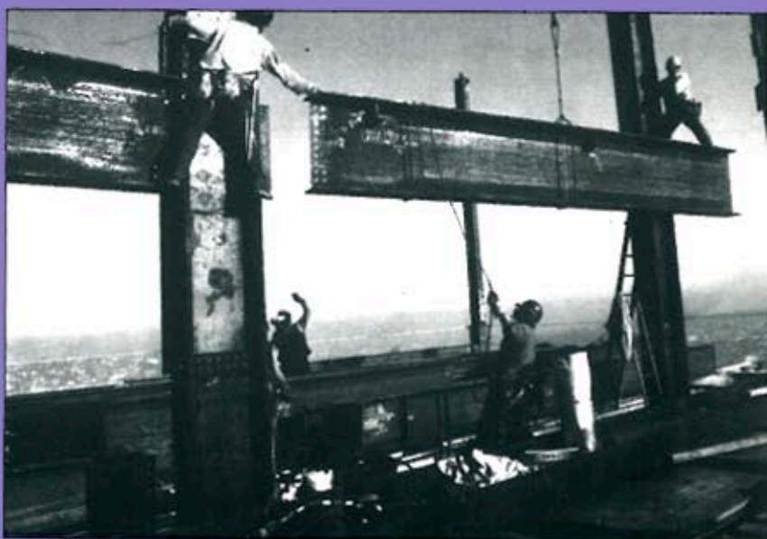
L'atur, una assignatura pendent per al 93