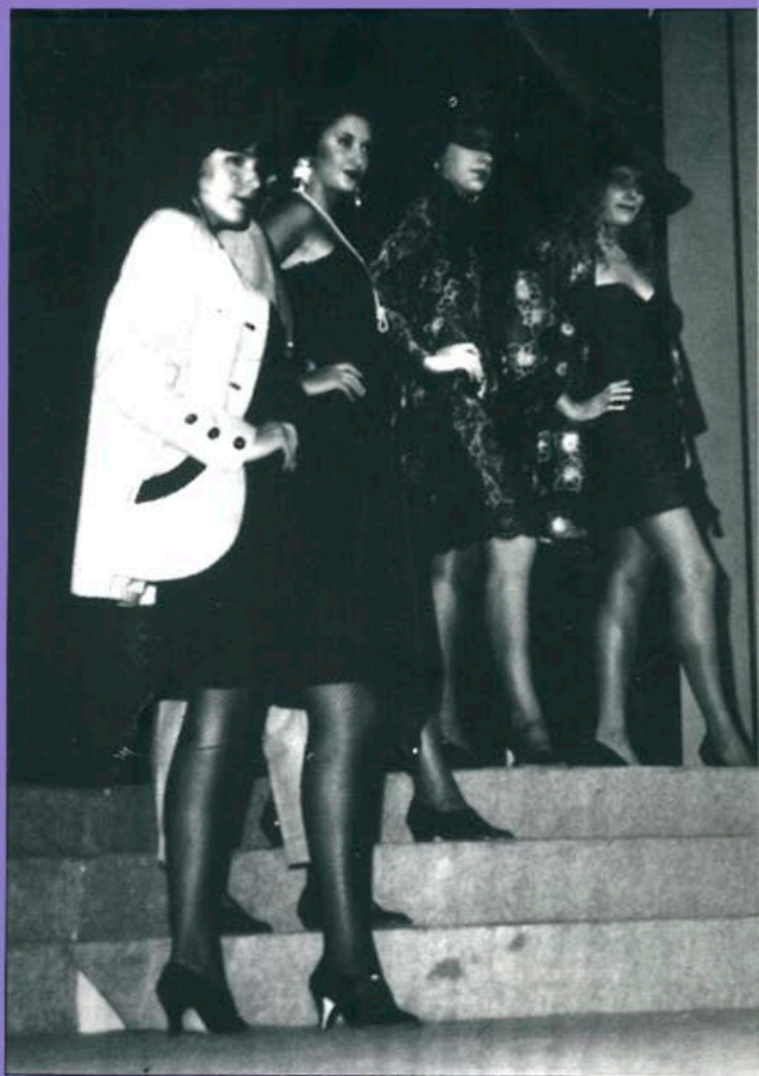
Èxit d'assistència i organització en el certamen de LA MODA a Balaguer el passat 27 de setembre.