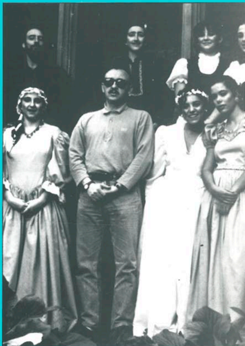
Varis components de la companyia de Teatre «Crisi Perpètua» de Balaguer