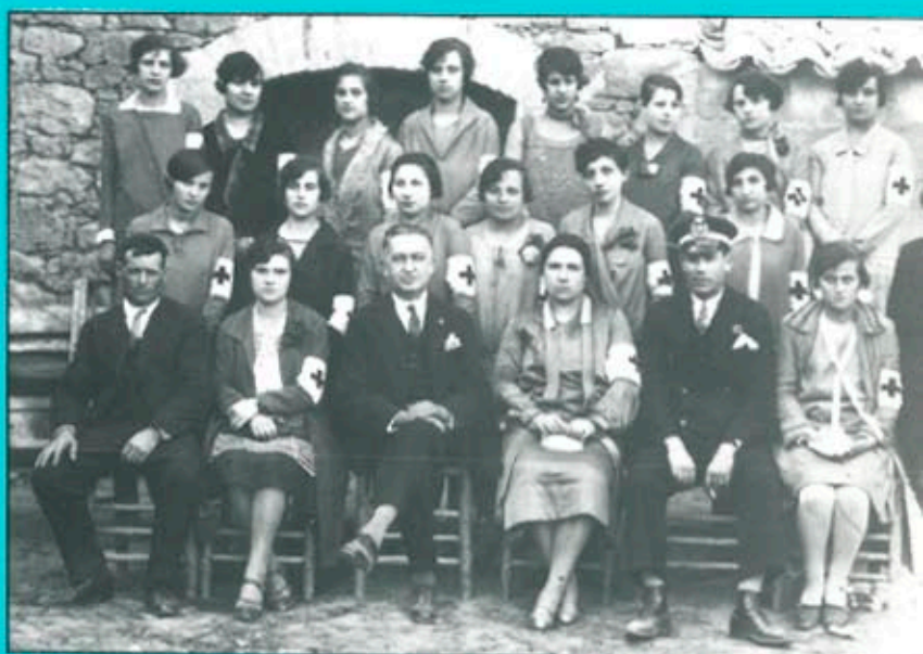
Membres de la primera assemblea de la Creu Roja a Balaguer, l'any 1928