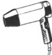
assegador de mà