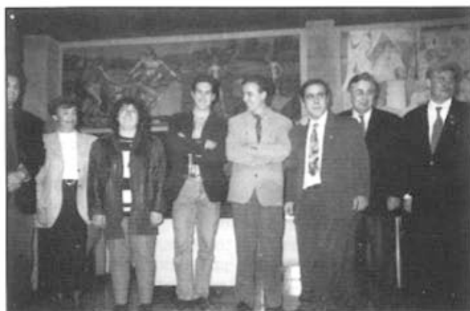
Els guanyadors d'aquest Primer Concurs de Bonsais a les terres de Lleida

El propassat diumenge dia 7 de novembre va tenir lloc a Balaguer el primer Concurs de Bonsais de les Terres de Lleida amb la participació de 53 afeccionats, que van presentar més d'un centenar de bonsais, en una gran varietat d'espècies. Bonsais de totes les terres de Lleida i d'algunes comarques de la província d'Osca van poder ser observats per un gran nombre de visitants i curiosos que no van voler perdre's aquesta oportunitat.