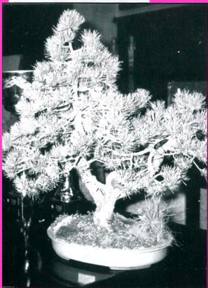
Un dels Bonsais guanyadors del 1er. Concurs de Bonsais de les Terres de Lleida