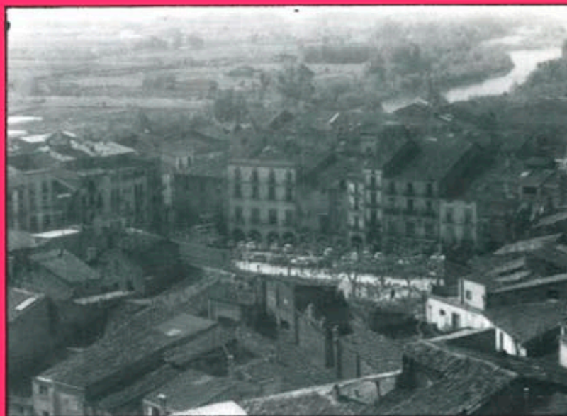
Ja han començat les obres a la Plaça Mercadal de Balaguer