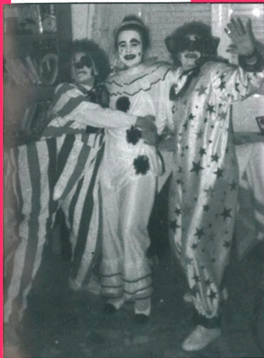
El proper dissabte 12 de febrer es celebrarà a Balaguer el tradicional Carnestoltes