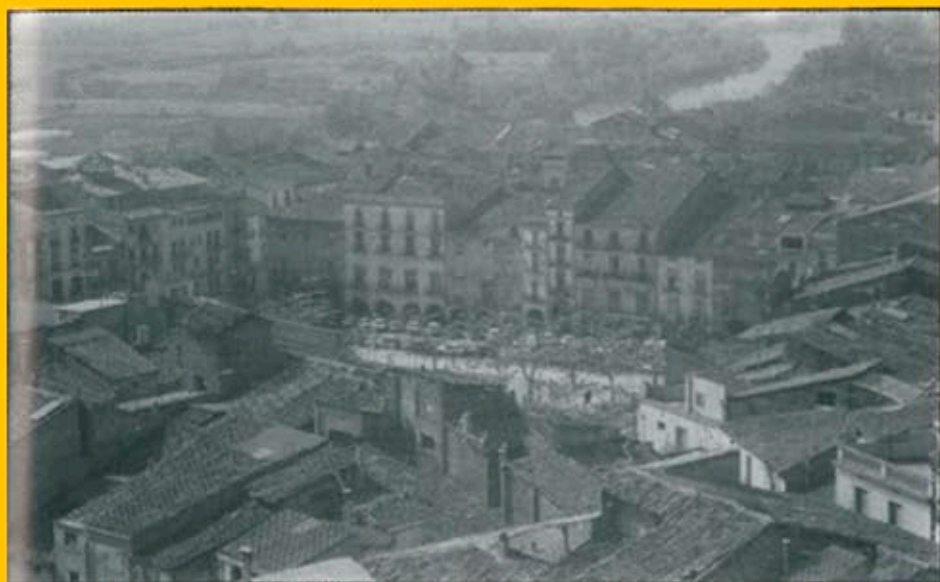
El tradicional mercat setmanal deixa de celebrar-se per una temporada a la P. Mercadal.