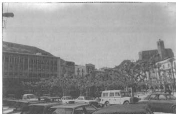
La Plaça Mercadal deixarà per una temporada de ser el centre del mercat setmanal

Una vegada estiguin efectuades les obres de la instal·lació dels serveis soterranis, es tornarà a celebrar el mercat a la Plaça Mercadal, i tenen previst sigui a finals d'aquest mes o principis de setembre.