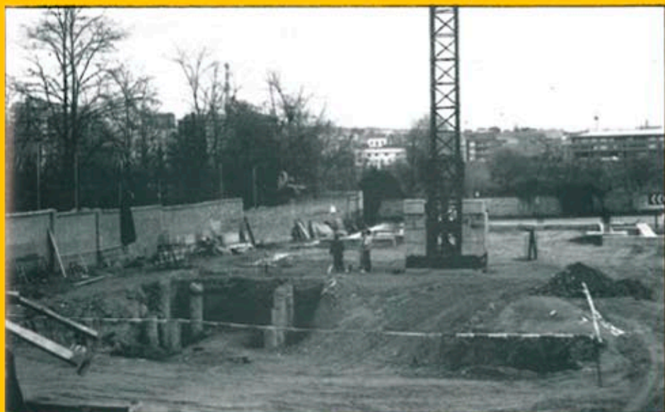
Ara fa un parell d'anys que es van començar les obres del Teatre Municipal.