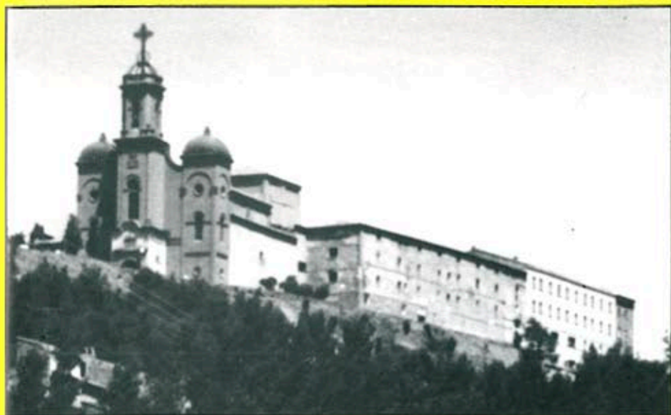
Proposta d'obres per actuar en el Santuari del Sant Crist de Balaguer