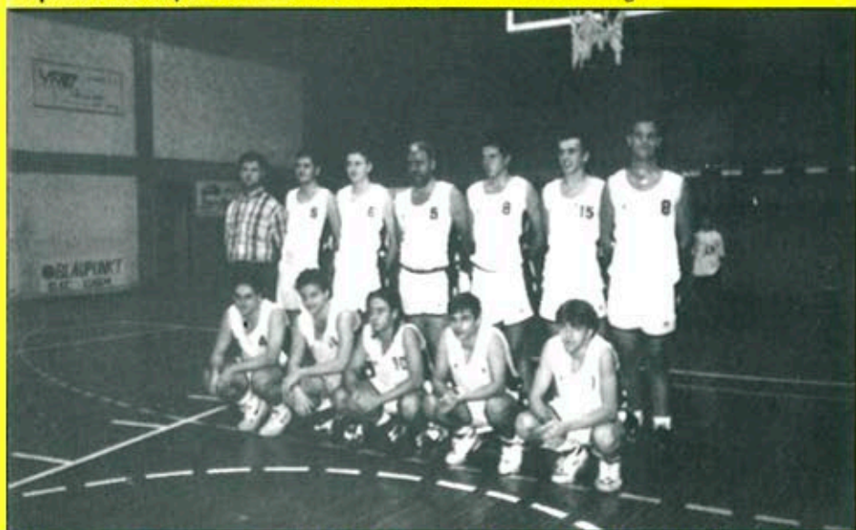
Els bons resultats aconseguits pel C.B. Balaguer l'han col·locat líder de la seva categoria