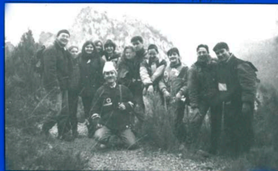
El passat mes de gener Creu Roja Joventut es va desplaçar a Mont-Bebi