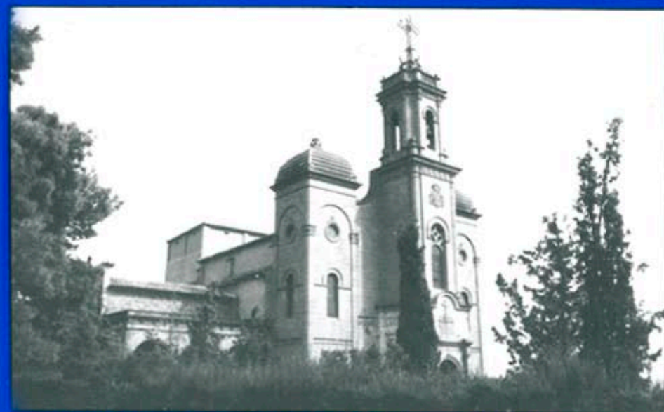
El Santuari del Sant Crist necessita d'una sèrie de reformes ja projectades