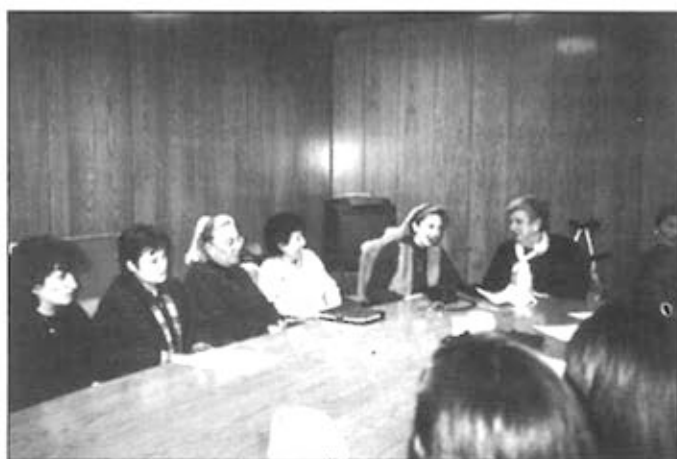
La Comissió organitzadora es va reunir el passat dimarts per tal d'ultimar els detalls de la diada

Essent el 8 de març una data assenyalada per a la dona, en la que es recorda aquelles dones que reivindicant millors condicions laborals varen morir cremades dins la fàbrica, nosaltres, dones de la Noguera, estem preparant una trobada que consistirà en un sopar col·loqui en el que debatrem els temes següents: