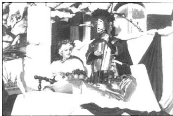
Creu Roja Joventut va participar en la darrera Festa del Carnestoltes amb aquesta carrossa

Per la gran festa de Carnestoltes, Creu Roja Joventut, també ha volgut col·laborar amb els seus voluntaris, organitzant per segon