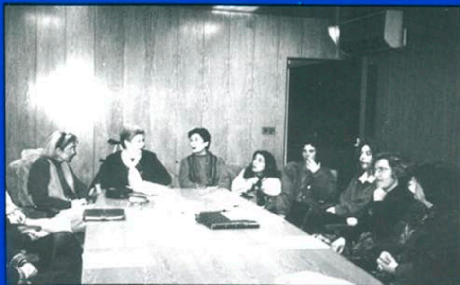
La Comissió organitzadora del sopar-col·loqui del proper 8 de març