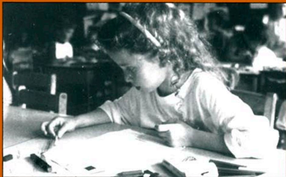
El període de pre-inscripció es preveu que s'obri durant la segona quinzena de març