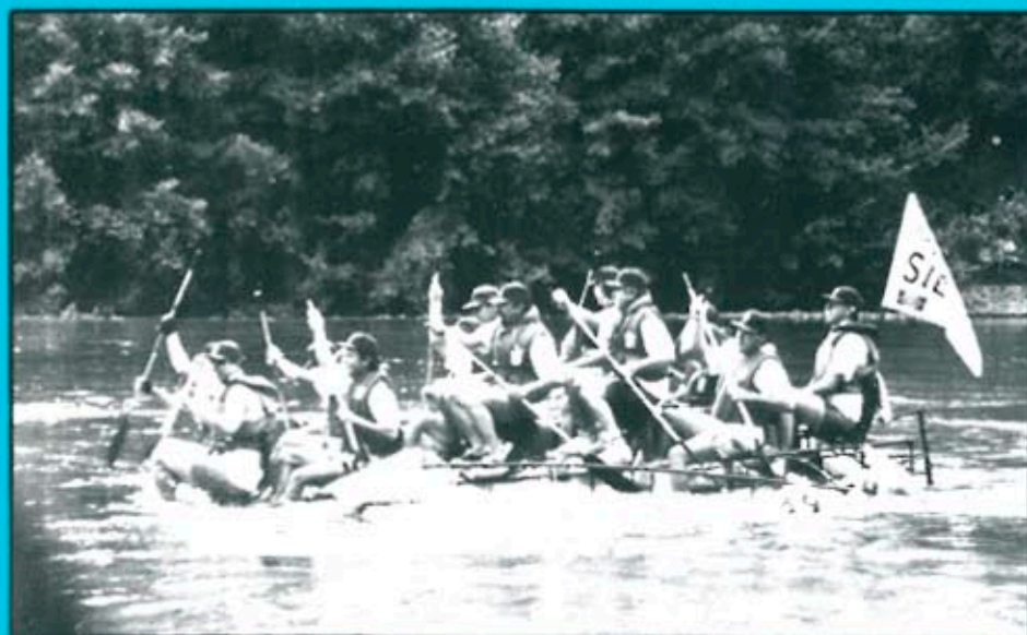
La Transsegre arriba a la seva dotzena edició el proper cap de setmana