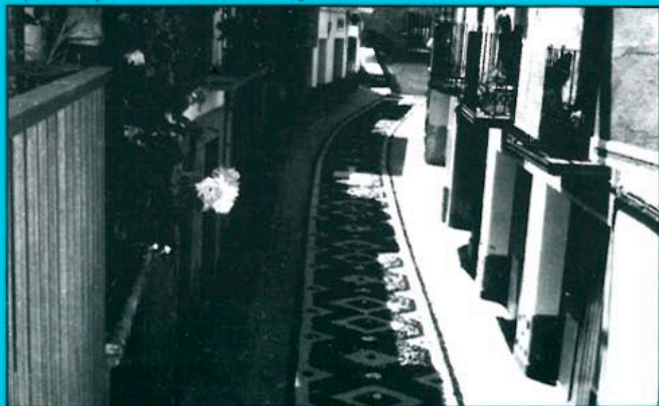
Camarasa va elaborar una catifa de flors de 52 metres pel Corpus Christi