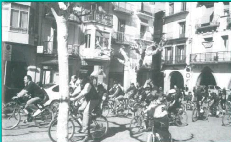
El passat dissabte 18 d'abril Balaguer va celebrar la seva Festa de la Bicicleta