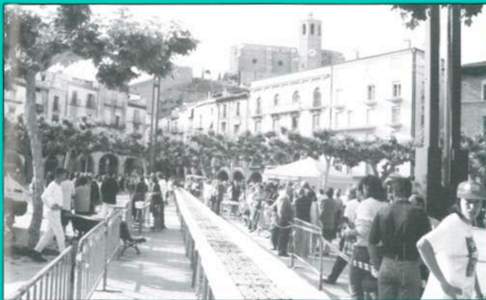
El proper divendres 1 de maig Balaguer celebrarà de nou la Festa de la Coca