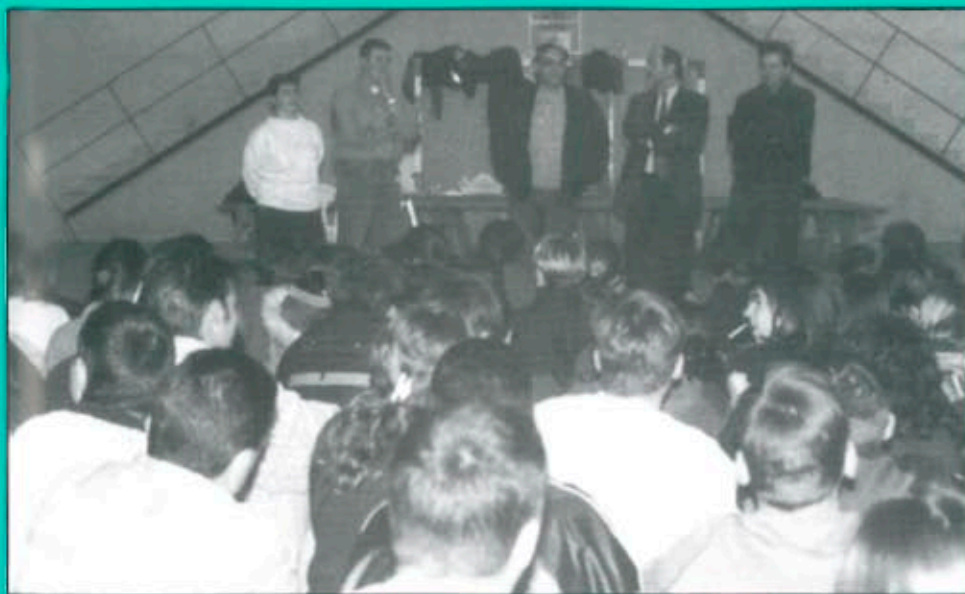
Balaguer va ser la seu de la III Trobada Provincial de voluntaris de Creu Roja Joventut