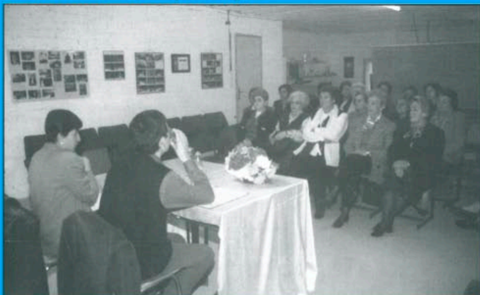
Curs d' "Autoestima" a Bellcaire d' Urgell