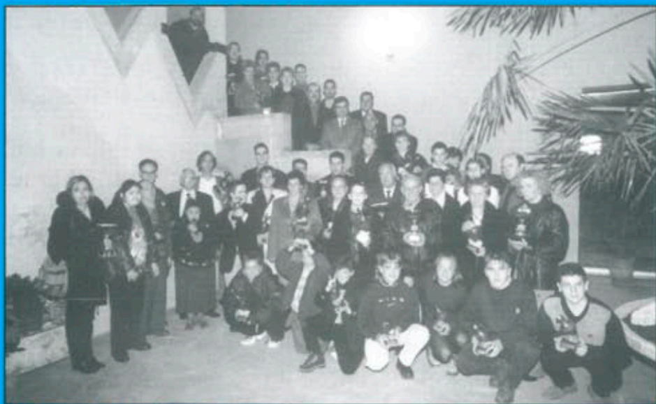
Celebració de la XI Festa de l'Esport a Balaguer