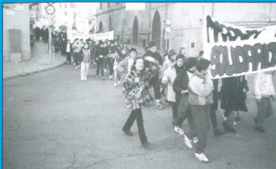
Nova campanya de Mà Oberta a Balaguer