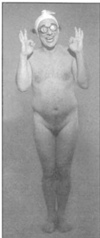
Jango Edwards, el millor pallasso per adults del món actuarà el proper 27 de desembre

La programació del Cicle d'hivern es completa amb quatre espectacles de teatre infantil, Grúmic de la companyia Tàbata Teatre el 20 de desembre, Teatre de Cordó-Enric Magoo amb El retorn al País de Mai-Més el 24 de gener, Títelles Babi amb el Planeta Siusplau el 28 de febrer i La Pera Llimonera amb l'espectacle Rucs el 21 de març. Aquests muntatges van destinats al públic infantil, preferentment de 4 a 12 anys. L'entrada d'aquests espectacles és gratuïta i la recomanació de la Regidoria de Cultura i Joventut de l'Ajuntament de Balaguer per a que no es colapsi de públic aquests