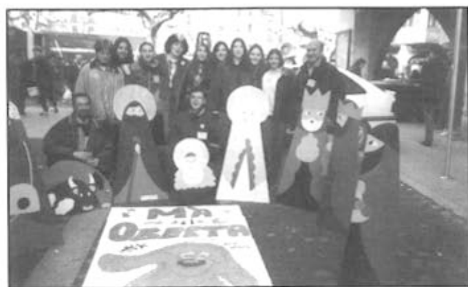
Una instantània de la Operació Moneda de l'any passat

Novament es farà també la tradicional "Operació moneda" per recollir el màxim de diners possibles. L'acte es farà el dissabte 19 de desembre al Pasatge Gaspar de Portolà, tot just a l'entrada de la Plaça Mercadal.