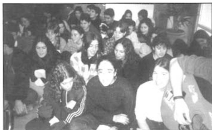
Els nois i noies disfrutant de la diada de la passada edició

Havent entrat ja a l'any nou, el 4 de gener al matí es farà la recollida d'ampolles de cava per tot Balaguer, havent fixat uns punts de recollida que seran: a la plaça Mercadal, a la plaça Pau Casals, a la plaça de la Sardana, al final del Passeig de l'Estació, a l'església del Sagrat Cor, a la plaça Sant Domènec, a l'Institut de Batxillerat, al Firal i al Grup Balmes, tenint com a recollida central el Parc de la Transsegre.