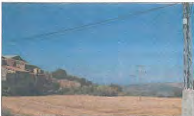
L'electrificació rural, uns dels temes principals

Entre les obres presentades, les més importants, econòmicament són l'electrificació de masies d'en Bosch, al terme de la Baronia de Rialb, amb un pressupost de 143 milions i una subvenció de 115 milions; la construcció d'un local d'activitats culturals a Ponts, amb un pressupost de 140 milions i una subvenció demanada de prop de 39 milions; la construcció d'un pave-