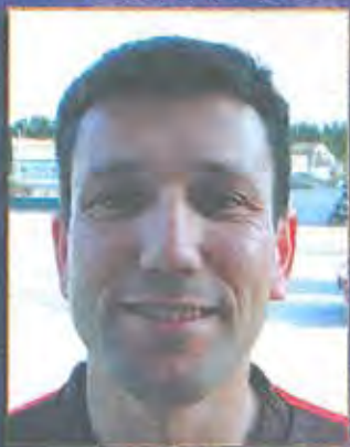
Goyo - Defensa