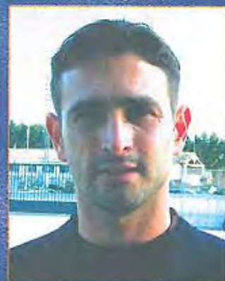
Viladegut - Davanter