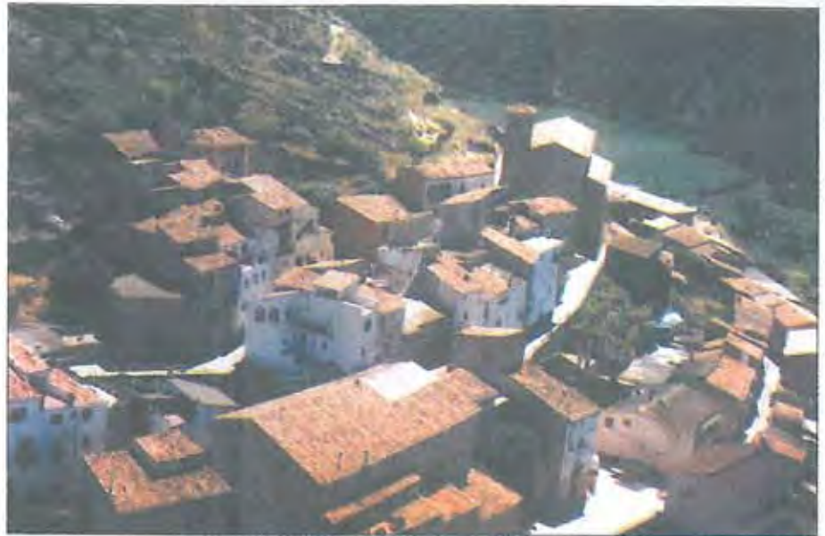
Els pobles de la Noguera rebran subvencions del PUOSC

lló polisportiu cobert a Albesa amb un pressupost de 105 milions i una subvenció de 26 milions; la planta potabilitzadora a Belcaire d'Urgell amb un pressupost de 86 milions i una subvenció de 52 milions; el cobriment de la pista esportiva de Penelles per 83 milions de pessetes, la construcció d'un edifici polivalent per Bombers, Agents forestals, etc., a Àger, per 80 milions de pessetes i la construcció dels magatzems de serveis municipals de Balaguer, amb un pressupost de 61 milions i una subvenció de 36 milions entre d'altres obres, que s'aniran desenvolupant durant aquest quadrienni.