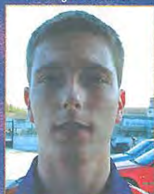
Ribalta - Davanter