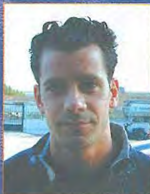
Parés - Davanter