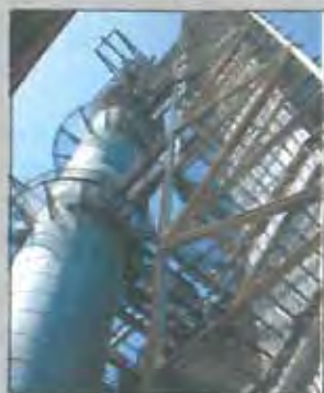
En portada: Instal·lacions d'Inpacsa