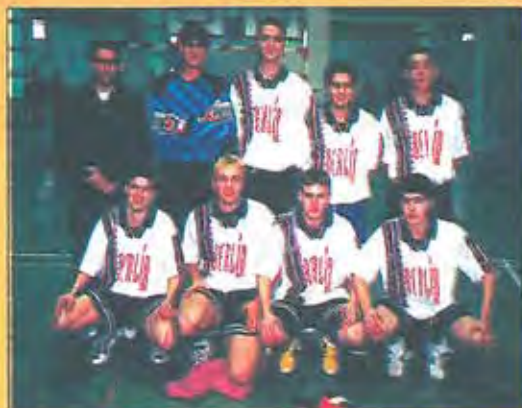
L'equip Berlín, FS es proclama campió del Grup A

Un cop finalitzat el campionat, la classificació definitiva de la competició en els dos grups queda de la següent manera: