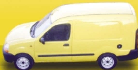
RENAULT KANGOO EXPRESS I GRAN VOLUM