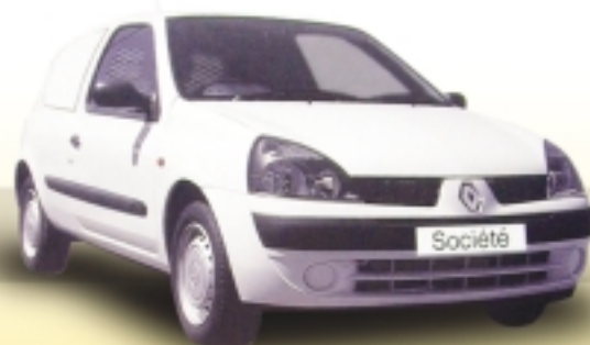
RENAULT CLIO SOCIÉTÉ

La gamma més completa del mercat, al servei del seu negoci