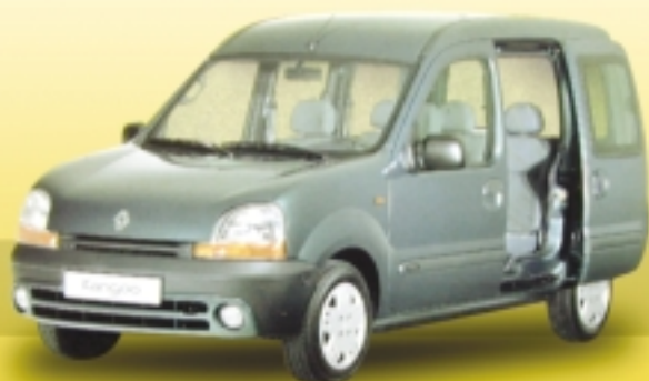
RENAULT KANGOO COMBI