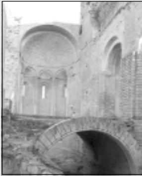
En portada: La Col·legiata d'Àger