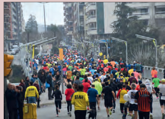
Mitja Marató Ciutat de Balaguer