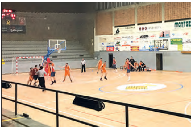
Instantània del partit contra el Fraga

El Sisvial Club Bàsquet Balaguer plantava cara aquest passat diumenge 23 de febrer, a un Fraga, que és el 4rt classificat a la classificació, però no va poder donar la sorpresa degut a la falta d'encert i a la gran pèrdua de pilotes. El partit va començar amb una gran intensitat defensiva per part dels dos