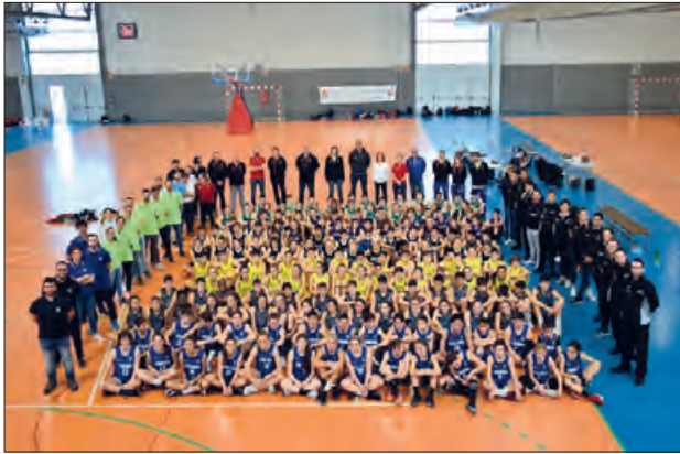
Trobada a Balaguer de seleccions preinfantils de bàsquet

Aquest passat diumenge 23 de febrer les seleccions preinfantils femenina i masculina territorials de les províncies de Barcelona, Girona, Lleida i Tarragona estaven cridades en una trobada torneig a la ciutat de Balaguer.