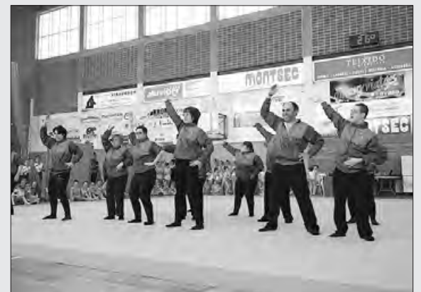
Actuació de l'Estel de l'any passat

Carreño disputarà aquest proper mes de març els torneigs de Gandia i Saragossa.