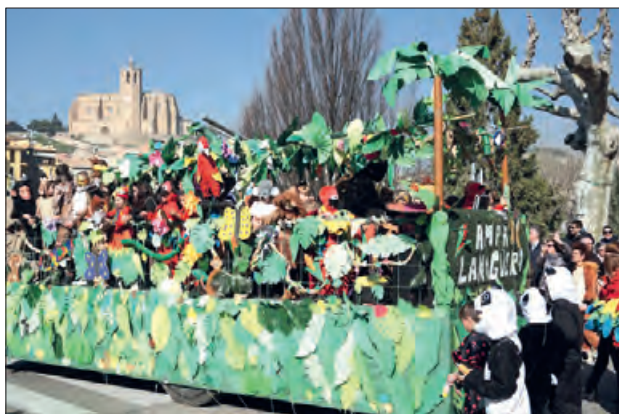
Rua de Carnestoltes de diumenge