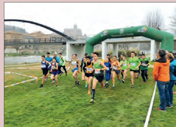
Instantània d'aquest any