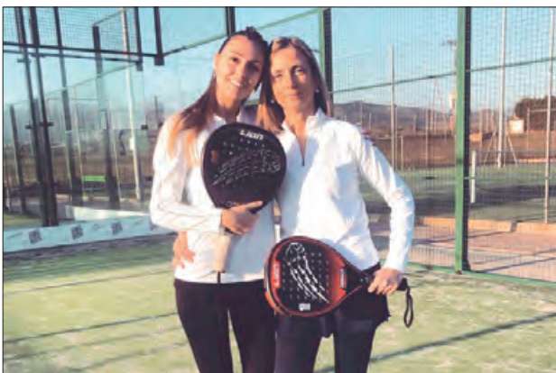
Parella femenina de pàdel guanyadora

El passat mes de gener es va donar per finalitzada la IV Edició de les lligues Fer Play de Tardor del Club Tennis Balaguer, amb un to-