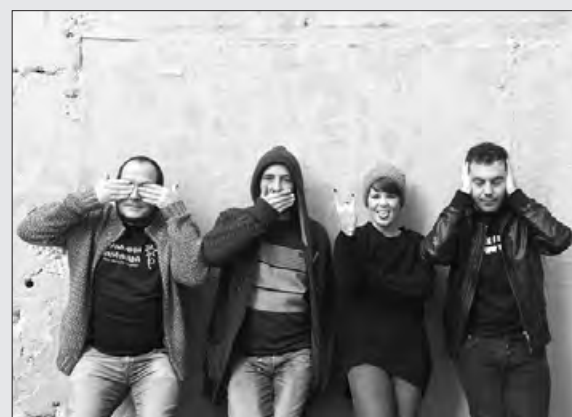
Integrants del grup Ovidi 4

Enguany, els concerts i les diverses propostes culturals organitzades pel projecte Barnasants teixeixen un entramat d'actuacions, edicions de material discogràfic i literari, produccions pròpies i altres activitats, que pretenen seguir impulsant i reivindicant la cançó d'autor.