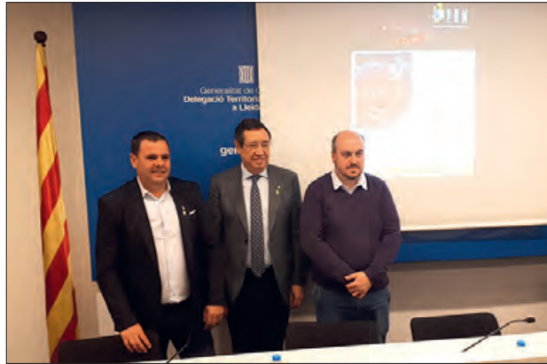
Presentació de la nova temporada

També inclou la projecció en 3D d'una pel·lícula realitzada pel planetari de Pamplona