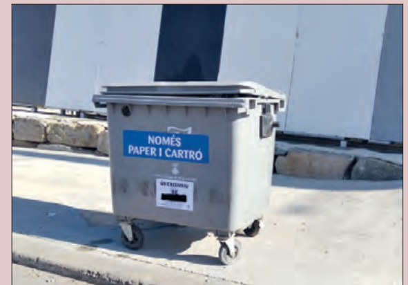
Nou servei de recollida de cartró i paper

Aquesta actuació s'inclou dins de les accions per augmentar el percentatge de residus reciclables recollits, i substitueix el sistema anterior de contenidors situats a l'exterior de les empreses per evitar que l'abocament erroni de deixalles per part de persones alienes a les empreses malmeti el contingut del contenidor de paper i cartró. Una millora a l'hora de reciclar correctament.