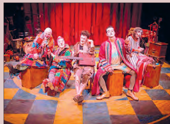
Espectacle Gran Reserva de Rhum&Cia

Com la passada edició, en el primer espectacle es va repartir un passaport que si tenia tots els segells dels diferents espectacles, s'entrava en el sorteig de varis regals i també el sorteig d'entrades per aquest espectacle final.