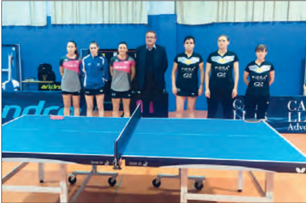
Balaguer Piera Ecoceràmica amb el Tramuntana Figueres