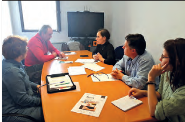
Sessió de treball a Balaguer

El coworking és una forma de treball que per-