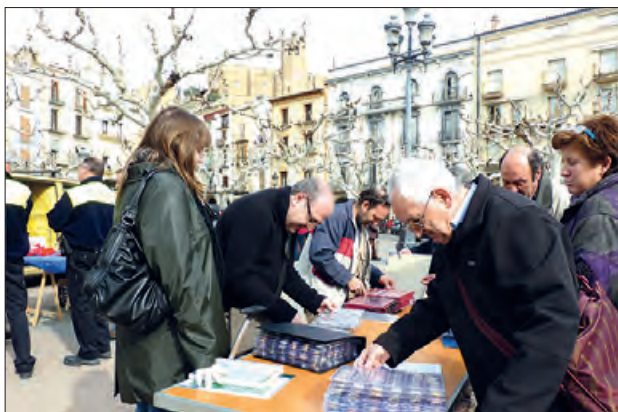
Torbada de Plaques de Cava i col·leccionisme

Un any més l'Associació Col·leccionista de la Noguera, preparen una nova edició de la trobada de plaques de cava i col·leccionisme a la ciutat de Balaguer.