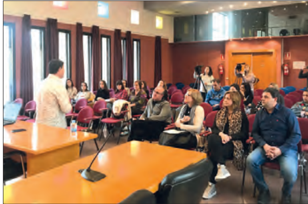
Un moment de la presentació

Dissenyar de manera coordinada amb el centre un pla d'actuació en el qual participen els joves, els professionals del centre, les administracions i entitats