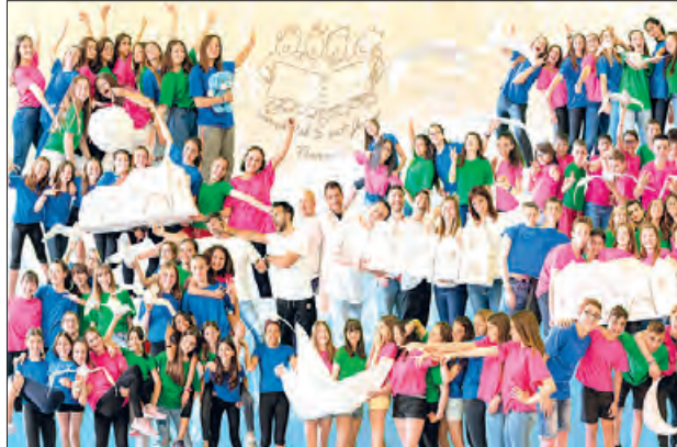
Coral Sant Josep