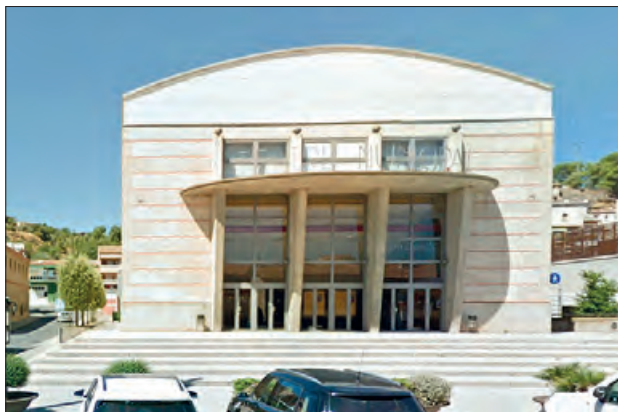
Espectacle al Teatre Municipal