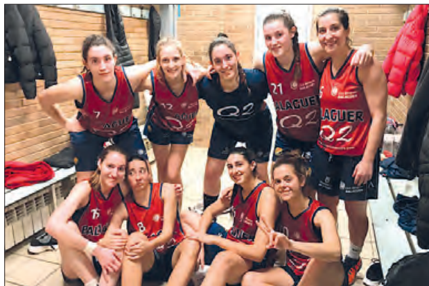
Cudós Consultors CB Balaguer

A la represa el Cudós Consultors va seguir amb la tònica de l'inici, i va ei-