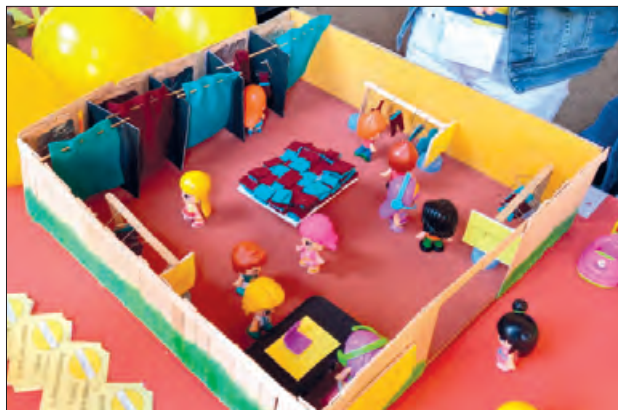
Un dels projectes presentats aquest curs

FER està coordinat pel Consorci GAL Noguera Segrià Nord i finançat per fons FEADER i pel Departament d'Agricultura, Ramaderia, Pesca i Alimentació de la Generalitat de Catalunya. Durant l'any 2019, per difondre el projecte se'n van fer presentacions a 11 Centres de Recursos Pedagògics, visites a escoles i un seguit de contactes per tal d'impulsar-lo a les escoles interessa-