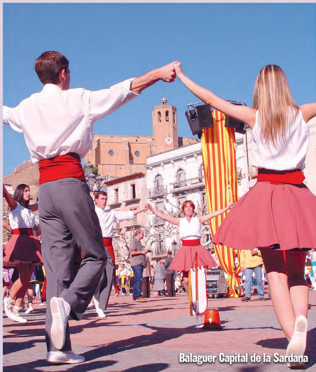
Balaguer Capital de la Sardana