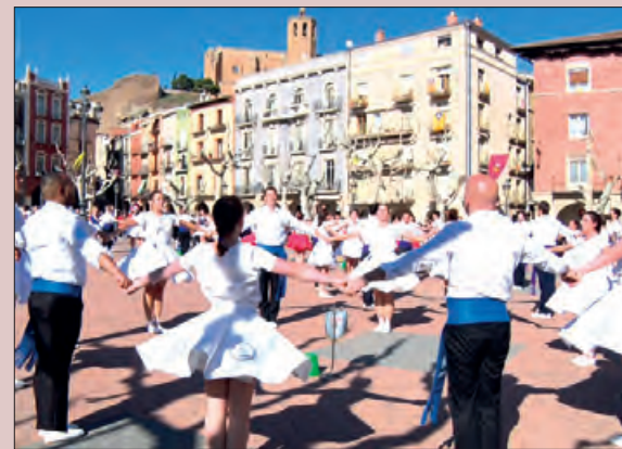
Balaguer Capital de la Sardana

La voluntat de la Paeria és que esdeveniments com aquest siguin entesos per la gent de Balaguer com a espais de col·laboració ciutadana, i així aconseguir dur a terme actes el més inclusius i participatius possibles.