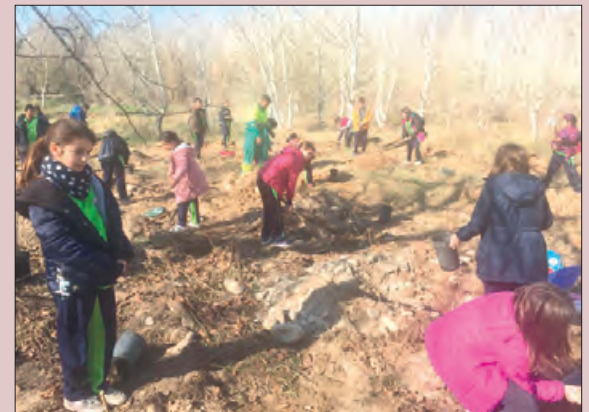
Plantada de l'arbre a les Franqueses

zona desforestada del bosc de ribera de les Franqueses conegut popularment com la "bultra" amb l'objectiu de donar a conèixer el patrimoni natural i la vegetació autòctona de la zona i de promoure entre els escolars actituds d'estima i cura del medi ambient i del patrimoni cultural.