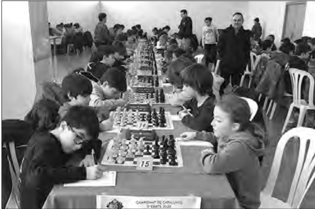
Campionat jugat a Balaguer

El passat dissabte 15 de febrer, van finalitzar les Fases prèvies del Campionat de Catalunya d'Escacs, definint els campions provincials en les categories entre Sub-08 i sub-18.