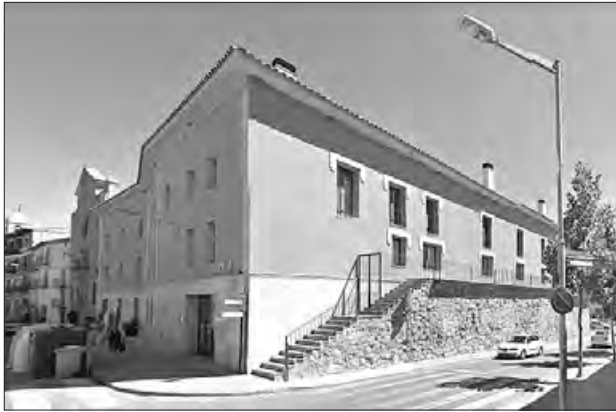
Taller a la Biblioteca Margarida de Montserrat

El proper dimarts dia 3 de març, la Biblioteca margarida de Montserrat ofereix un taller de lectura en veu alta per adults a càrrec de Jordi Vidal.