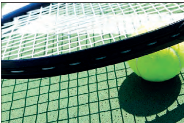
Tennis femení a Balaguer

Després de molts anys sense competició de tennis femení a les pistes de Balaguer, s'obre una taula feme-