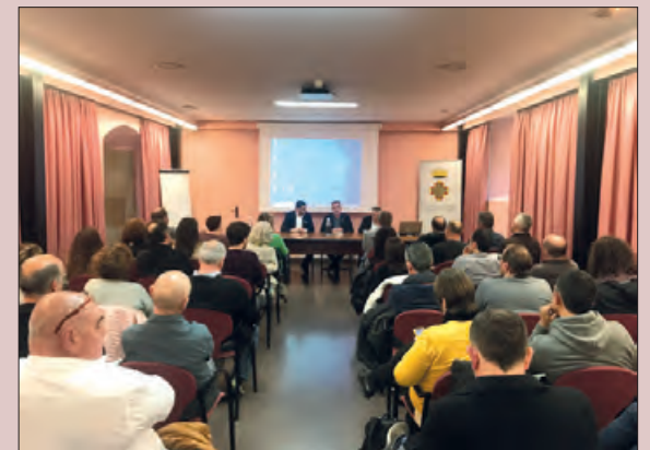
Reunió al Consell Comarcal

La reunió forma part del seguit de trobades que la Diputació de Lleida està mantenint amb els dirigents municipals en les seus dels diferents Consells.