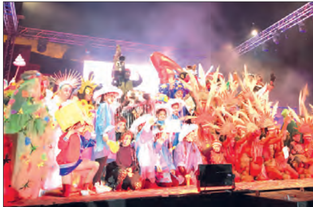
Foto dels premis del concurs de comparses de dissabte