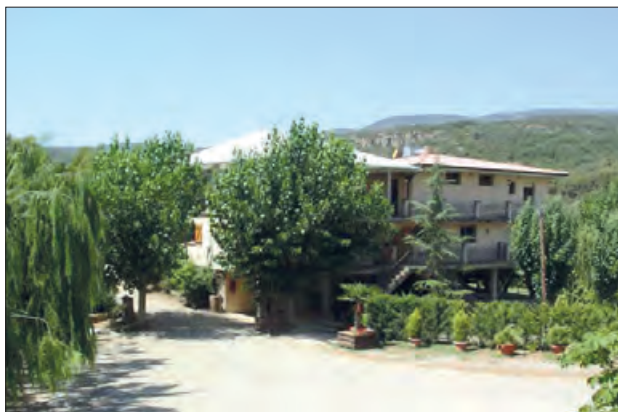
Cal Petit de Vilanova de Meià