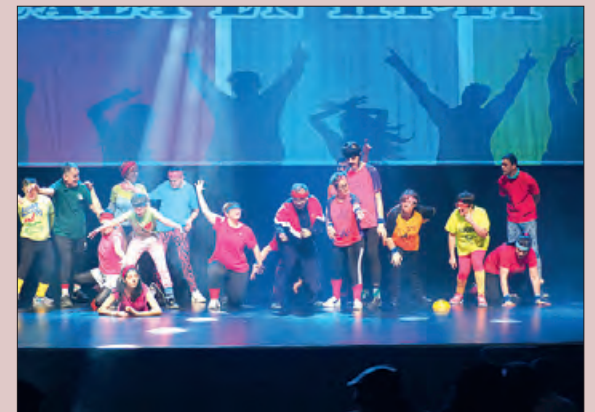
Actuació del Taller l'Estel

A l'actuació, hi van participar un total de 195 persones d'11 centres de les Terres de Lleida: Talma de Juneda, Acudam de Mollerussa, L'Olivera de Vallbona de les Monges, Ssant Joan de Déu d'Almacelles, Amisol de Solsona, Alba de Tàrrrega, Empresseguera, Casa Nostra, Entrevies i llersis de Lleida, i l'Estel de Balaguer.