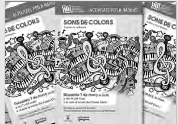
Cartell de l'espectacle

Les places són limitades prèvia inscripció a la Biblioteca.