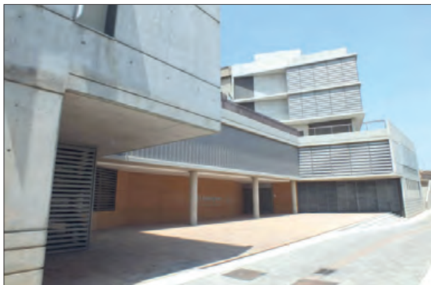
Centre d'Innovació d'Empreses a Balaguer