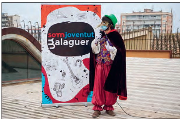
Imatge de l'entrega de premis

Tot i ser un any complicat degut a la pandèmia actual, la ciutat de Balaguer encarava el Carnestoltes del Congre 2021 de forma virtual, amb dos concursos. Un de disfresses i un de comparses, on s'animava a la població i a les escoles a participar de forma virtual enregistrant uns vídeos i penjar-los a les xarxes socials.