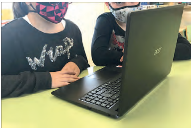
Nous ordenadors portàtils a l'Escola de Tèrmens

L'Ajuntament de Tèrmens ha realitzat una dotació de 8 portàtils, donant suport a les necessitats del centre i vetllant pels interessos de tots els infants, després d'una iniciativa proposada per l'AMPA de l'escola Alfred Potrony.