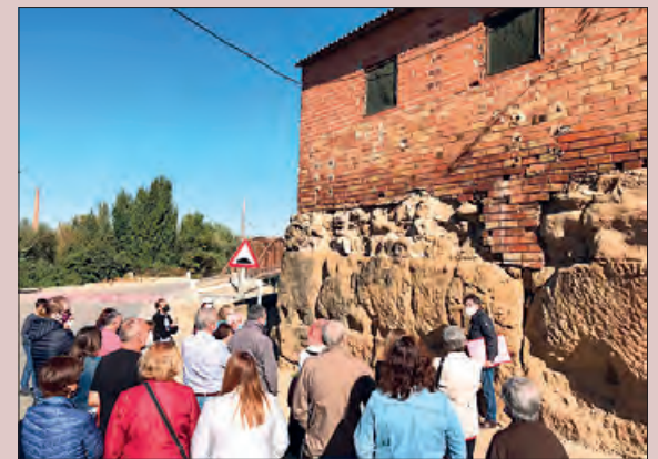
Tram de la muralla

L'accés que connecta amb Menàrguens és un espai que acull diversos elements patrimonials com el safareig, la muralla i el pont de ferro de l'antiga Sucrera del Segre. L'Ajuntament vol dignificar i endreçar aquesta zona i per això ja ha realitzat altres accions en aquest sentit com la col·locació de jardineres i la instal·lació de bancs.