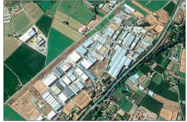
Es situarà al Polígon Campllong

El seu objectiu estratègic és impulsar el procés de transició cap al model de bioeconomia en el territori a partir del bosc com