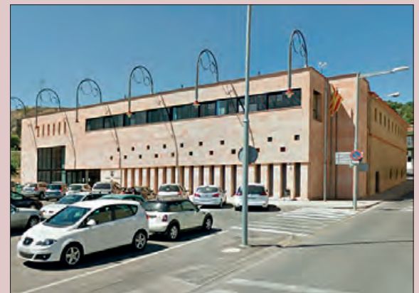
Seu del Consell Comarcal de la Noguera

L'enquesta, que ja està disponible al web del Consell Comarcal de la Noguera, també es farà arribar a les empreses per correu electrònic, se'n farà difusió a través de les xarxes socials i en altres mitjans de comunicació de la comarca.