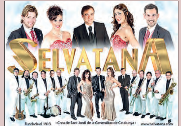
L'Orquestra Selvatana al Teatre

Aquest diumenge, dia 14 de març, a les 18,00 h tindrà lloc al Teatre Municipal de Balaguer un concert de Música Catalana a càrrec de la prestigiosa Orquestra Internacional Selvatana després que la regidoria de Festes de la Paeria de Balaguer decidís ajornar la seva actuació, que estava programada dins el marc de les Festes del Sant Crist, i no anul·lar-la per tal d'ajudar aquest sector que veritablement la pandèmia els ha afectat molt fort.