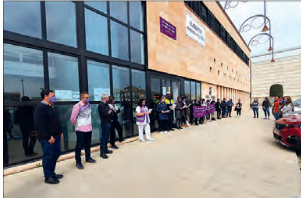
Acte davant la seu del Consell Comarcal

La lectura d'enguany ha estat un acte conjunt entre diferents administracions de la comarca que, des de les seves perspectives d'actuació, i de manera conjunta, estan implicades en el treball diari per abolir les desigualtats que afecten les dones encara avui en dia.