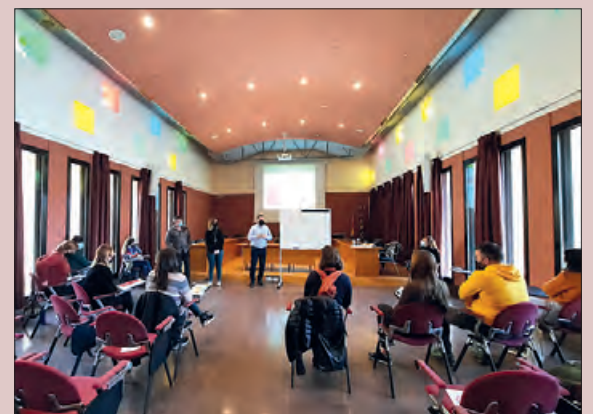
Una de les sessions de formació

El Pla d'Acció Comunitària Inclusiva és una nova eina que la Generalitat de Catalunya posa a disposició dels ens locals en matèria d'inclusió social i acció comunitària i que neix fruit d'un procés de treball amb la finalitat d'unificar els Plans de Desenvolupament Comunitari (PDC) i els Plans d'Inclusió Social (PLIS). Aquest pla es concep com una eina al servei del model proactiu i comunitari cap al qual vol girar el Sistema de Serveis Socials català i ofereix l'oportunitat d'alinear l'atenció primària dels serveis socials bàsics amb el treball preventiu i comunitari.