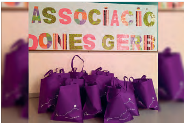
Bosses amb el sopar i l'obsequi

Des de l'Associació de dones de Gerb, s'ha organitzat un sopar per emportar, ja que enguany a causa del Covid-19, no es pot ce-