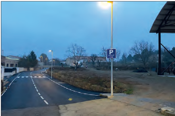
Nou enllumenat a Montgai

Montgai ha estrenat a finals de febrer, la finalització de la segona fase de les obres de millora de l'enllumenat a varis carrers de la població.