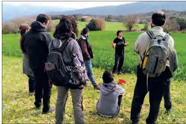
Classe amb un ramader local

Bruna i la Pirinenca i també el ramat d'ovelles de raça xisqueta, una varietat autòctona de Catalunya i Aragó i catalogada en perill d'extinció des de 1995.