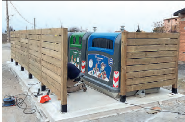
Instal·lació dels contenidors tancats

Al mateix temps, s'han instal·lat càmeres de seguretat a la majoria d'illes, per tal de promoure una millor gestió dels residus, especialment dels voluminosos. Es vol evitar que objectes com mobles, fustes, electrodomèstics, etc., siguin llençats fora dels contenidors, un episodi que es dona de forma reiterada. L'ajuntament recorda que aquest tipus