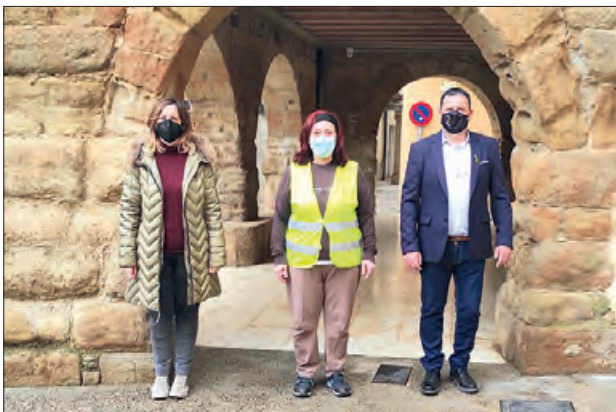
La persona contractada treballarà a Menàrguens

El Consell Comarcal de la Noguera s'ha acollit a la darrera convocatòria de la subvenció Treball i Formació convocada pel Servei d'Ocupació de Catalunya i cofinançada pel Fons Social Europeu. En aquesta edició la subvenció està orienta-