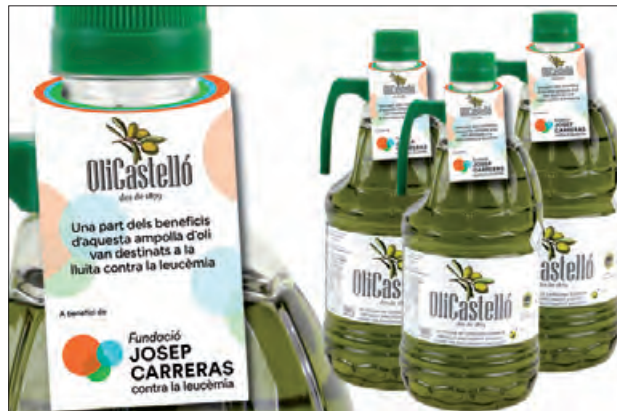
Campanya solidària a benefici de la Fundació J. Carreras

S'espera que la campanya tingui una bona acceptació i es pugui així ajudar a continuar amb la investigació.