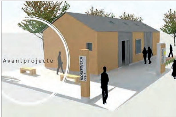
Imatge de la planta pilot

El Polígon Campllong de Balaguer acollirà una bio-refineria a escala de planta pilot a partir de fusta i els seus subproductes (serradures, escorces etc.) per a