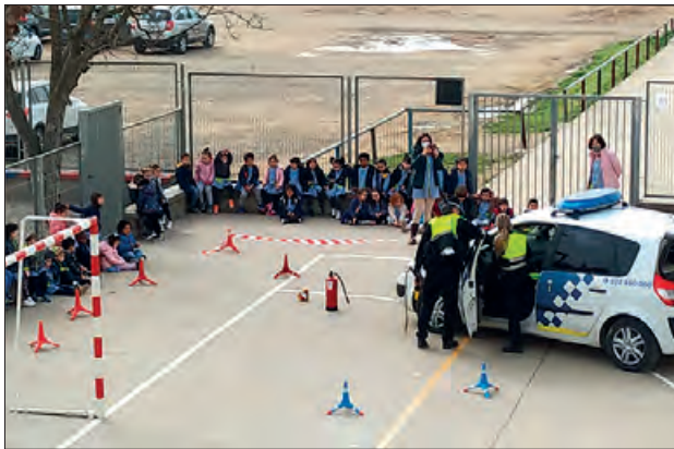
Visita de la Guàrdia Urbana a l'Escola Gaspar de Portolà

El passat 4 de març, la Policia -Guàrdia Urbana de Balaguer, es va desplaçar a l'Escola Gaspar de Portolà de Balaguer. Dos efectius de la Guàrdia Urbana (Inspector cap i agent), es van desplaçar