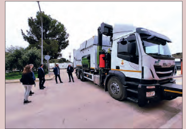
Reunió del grup local de Som Energia La Noguera

Aquesta adquisició és una de les actuacions que el Consell Comarcal de la Noguera implementarà durant el 2021 per millorar les xifres en la recollida selectiva de residus de la comarca, que tot i evolucionar de manera positiva encara són lluny dels percentatges que requereix la Unió Europea.