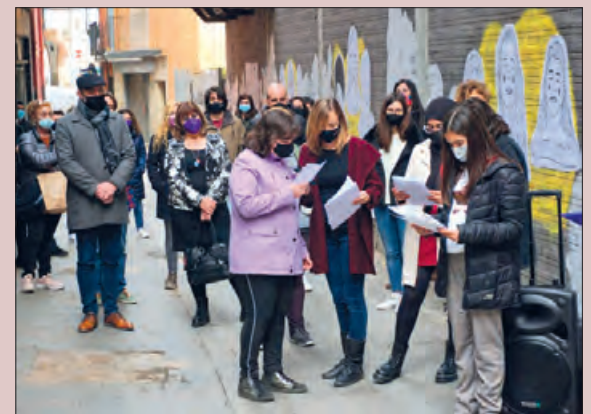
Inauguració del mural al carrer Sant Jaume

Finalment, una xerrada en línia sobre el llibre "Mujeres invisibles para la medicina" de la política i metgessa catalana, Carme Valls Llobet, a les 11.30 h i es podrà seguir pel web www.adapteplamedicina.balaguer.cat .