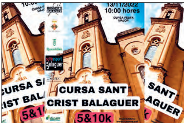
Cartell de la Cursa del Sant Crist 2022

Tens un pis, local, pàrquing, finca... per VENDRE o LLOGAR ?