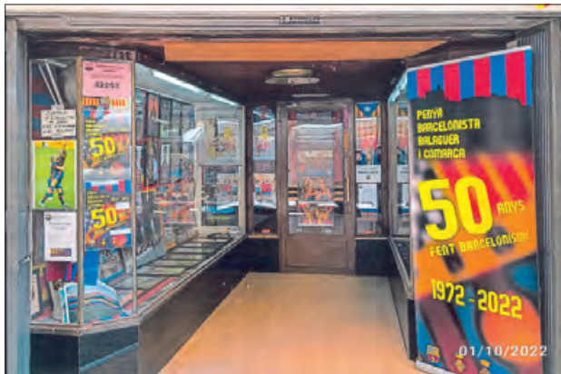
L'exposició actual al local de la Penya a Balaguer