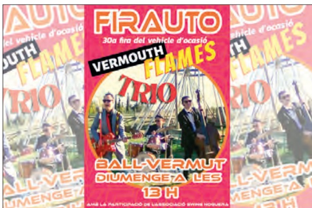
Cartell del ball-vermut