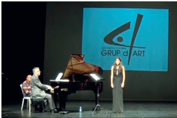
Una imatge d'arxiu d'un dels concerts

El proper dissabte 15 d'octubre es celebrarà al Teatre Municipal a les 8 del vespre, el concert dels guanyadors del 10è concurs Internacional de cant líric “Germans Pla, Ciutat de