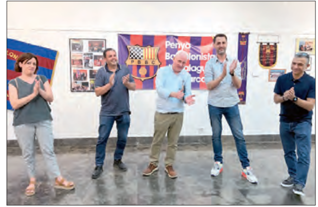
Inauguració de l'exposició el passat mes de maig a la sala d'exposicions de la Paeria de Balaguer

A les 8 del vespre, la junta de la Penya amb el president Joan Laporta i diferents convidats a l'acte,