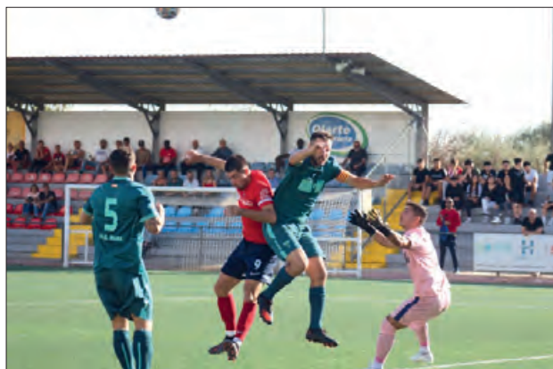
Al Municipal contra el Rubí