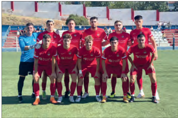
Alineació al camp del Llefià

Al segon partit de lliga on el Balaguer debutava a casa contra el Rubí, el partit va acabar amb un empat polèmic al seu retorn a pri-