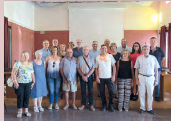
Trobada dels responsables de les Aules de cada poble

Durant el mes d'octubre tindrà lloc la primera sessió de cadascuna de les 8 aules de formació que s'han organitzat a la Noguera.