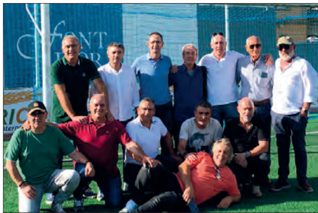
Foto de la trobada