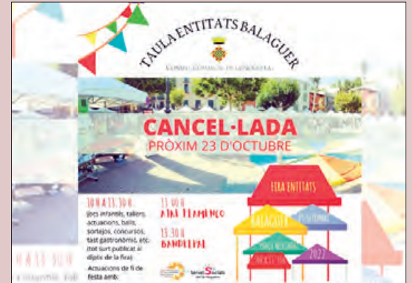
Canvi de data de la Fira Entitats

El passat 25 de setembre estava prevista a la plaça Mercadal de Balaguer celebrar la Firaentitats'22, organitzada per l'Àrea de Serveis Socials del Consell Comarcal de la Noguera a través del Pla d'Acció Comunitària Inclusiva, i amb la col·laboració de la Paeria de Balaguer, però degut a la mala climatologia anunciada es va decidir posposar la Fira pel proper 23 d'octubre.