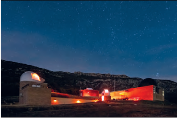
Visita nocturna al Parc Astronòmic

El Parc Astronòmic del Montsec acull, del 28 d'octubre a l'1 de novembre, la 8a edició del Festival d'Astronomia del Montsec, a Àger.