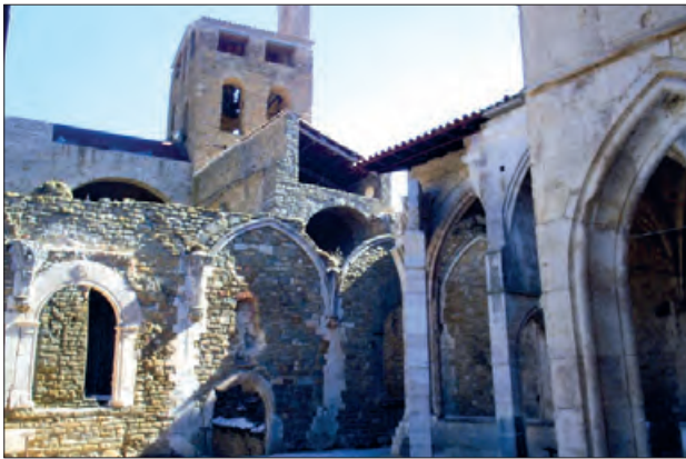
Visita a la Col·legiata de Sant Pere

La Col·legiata de Sant Pere d'Àger i el nucli antic de la vila han ofert pels dies 7 i 8 d'octubre una sèrie