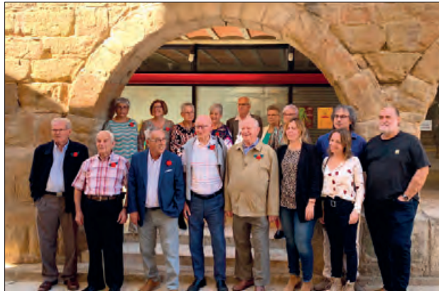
Foto dels homenatjats