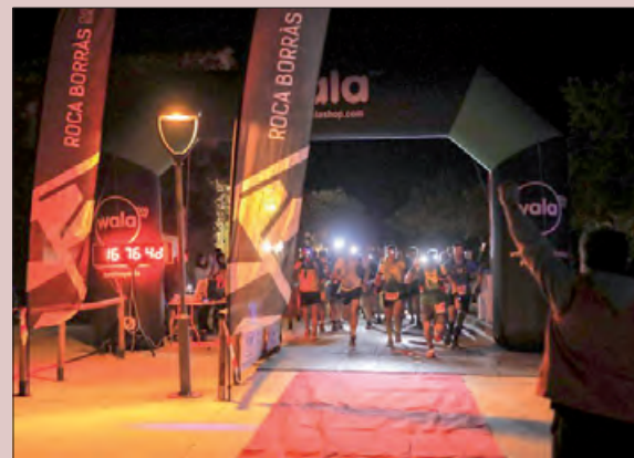
Sortida de la Ultra Trail a les 7 del matí

Les diferents proves van arrencar dissabte al matí des del Càmping Vall d'Àger, amb un temps màxim de 20 hores per a l'Ultra Trail, i de 12 hores per a la Marató i la Mitja Marató.