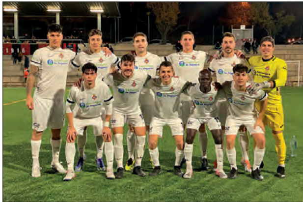
Formació inicial contra El Sant Cugat

A la segona part hi va haver un canvi radical en el