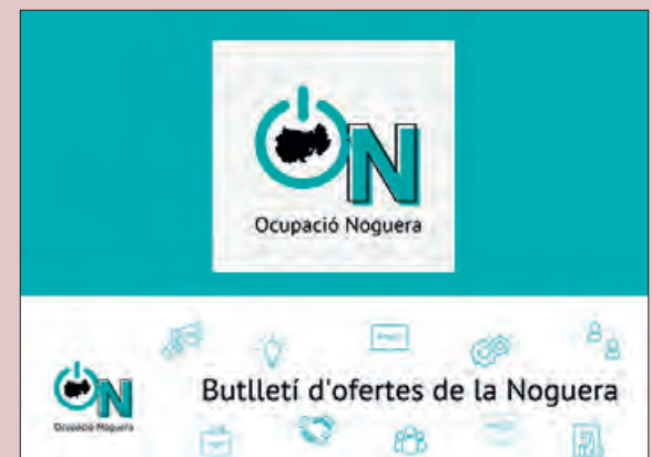
Imatge del web

Els interessats s'hauran d'adreçar al web del Consell Comarcal i clicar a la franja "Avisos" per fer la consulta.