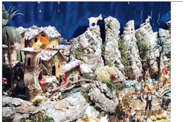
Pessebre guanyador de l'any passat

Fins al 22 de desembre es pot participar en el 3r Concurs de pessebres organitzat per l'Àrea de Joventut de la Paeria de Balaguer. L'objectiu del concurs és fomentar les tradicions nadalènques. Els interessats en participar al concurs han de fer un vídeo, d'un minut i mig com a màxim, on s'ha de veure tot el pessebre i s'ha de publicar a Instagram amb el hashtag #pessebrebalaguer i etiquetar @Balaguerjove. Pel que fa als premis del concurs, el primer premi