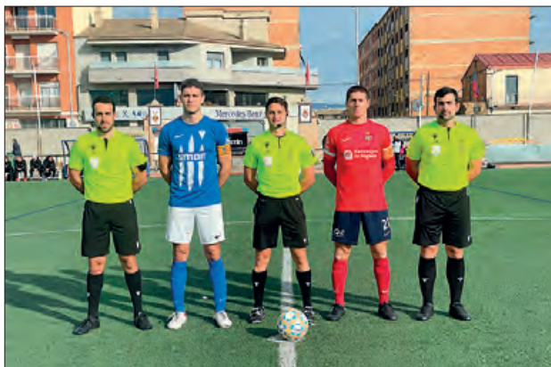
Imatge contra l'Igualada