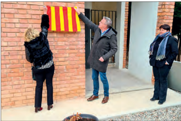
Inauguració de la nova sala de vetlla a Vilanova de la Sal

Així, les actuacions que s'han dut a terme són la reforma de la coberta, que tenia problemes puntuals; la reforma de la zona dels banys de la planta baixa, per tal d'habilitar un únic bany accessible, i la instal·lació de barana en l'escala.