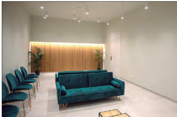
Sala polivalent de vetlles

La instal·lació disposa de fil musical i una sèrie de comoditats com: wifi, servei de càtering i begudes, entre altres i està ubicat en un nervi vital de la ciutat, al carrer Noguera Pallaresa 46. L'objectiu d'estar al centre de la ciutat, és facilitar l'accés als visitants per arribar-hi a peu, en transport públic com privat, i amb facilitat per aparcar.