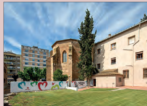
Centre Sant Domènec de Càritas

Des del centre es vetlla la participació i la col·laboració amb les institucions, entitats en les diferents activitats compartides, per poder donar ajuda al màxim de gent que ho necessita, sobretot infants i joves amb el seu acompanyament tant d'estudi com de joc i oci, perquè puguin gaudir d'una infantesa feliç i amb igualtat d'oportunitats.