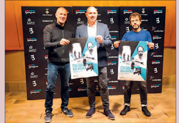
Acte de presentació

La Paeria de Balaguer ha presentat les propostes culturals per als propers mesos a la ciutat, durant la temporada d'hivern.