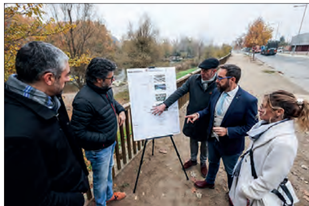
Un moment de la presentació

tuació de l'Estratègia Catalana de la Bicicleta 2025 és la promoció de l'ús de la bicicleta com a element turístic, d'oci i esportiu, de forma segura. El traçat de la Ruta dels Llacs transcorre per les comarques del Segrià, la Noguera i el Pallars Jussà, paral·lelament i com-