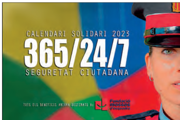
Calendari dels Mossos d'Esquadra pel 2023

El cos dels Mossos d'Esquadra impulsa un any més un calendari solidari per l'any 2023. Enguany aquest calendari vol ser un reconeixement a la tasca diària de tots els mossos i mosses d'esquadra que treballen a Seguretat Ciutadana arreu del territori. Com a novetat aquest any els beneficis obtinguts aniran destinats íntegrament a la Fundació Mossos d'Esquadra la qual porta a terme accions encaminades a coadjuvar (donar-se mútua ajuda, col·laborar) a la protecció social dels membres de la Policia- Mossos d'Esquadra, els seus familiars directes (orfes, òrfenes i persones jubilades entre d'altres) i a realitzar projectes per promoure la cul-