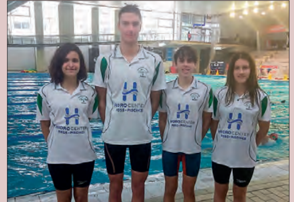
Nedadors del CEN Balaguer

Quatre nedadors del Club Natació Balaguer, han participat al Campionat de Catalunya Infantil i Júnior, fase 2, que es va disputar del 8 a l'11 de desembre a les instal·lacions del CN Sabadell.