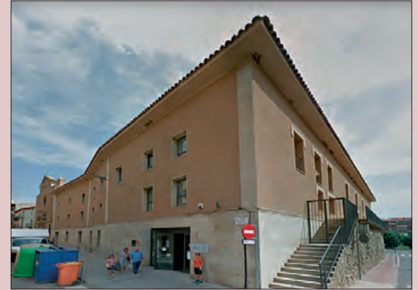
Biblioteca Margarida de Monferrat

A partir d'aquest dilluns 19 de desembre la Biblioteca Margarida de Monferrat ofereix una àmplia selecció de Jocs de taula per endur-se en préstec a casa.