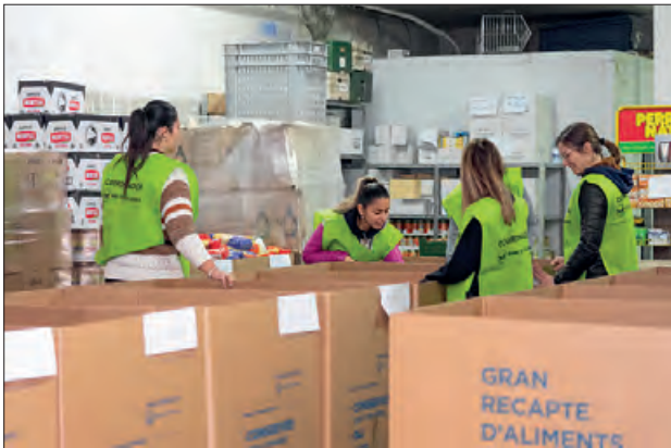
Material recollit durant les dos jornades

Després d'haver fet una crida a la ciutadania en general i de contactar amb diferents entitats dels tres municipis, en total en aquesta campanya s'hi han sumat més de 90 persones voluntàries. En total s'han recollit 12.000 Kg d'aliments, que es van anar dipositant al local d'Àgape, Aliments Solidaris de la Noguera, des d'on es distribueixen els aliments a aquelles famílies vulnerables derivades des dels Serveis Socials, que valoren molt positivament la recollida d'enguany.