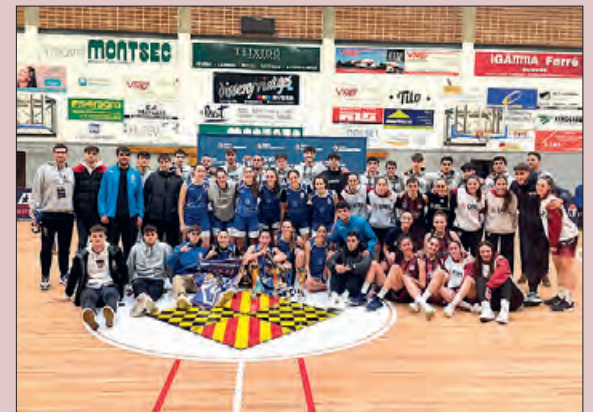
Finalistes de la Copa Universitària

Una nova experiència a nivell esportiu i un gran repte per Balaguer, acollint esdeveniments d'aquest tipus.