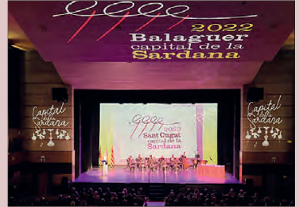
Un moment del concert

El Teatre Municipal de Balaguer va acollir el disabte 17 de desembre els actes de lliurament dels Premis Capital de la Sardana 2022, la Presentació de la Guia Sardanista del 2023 i el concert "Viatge pels clàssics d'arreu del món", a càrrec de la Cobla Mediterrània.