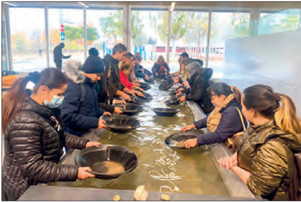
Els alumnes de català a la seva sortida

Els alumnes dels cursos de nivell Inicial i Bàsic 2, que el Consorci per a la Normalització Lingüística ha estat duent a terme a Balaguer aquest darrer trimestre, han fet una sortida per conèixer la histò-