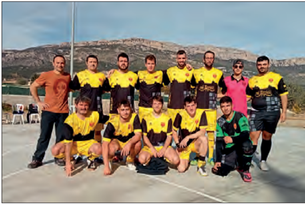
Foto d'arxiu del torneig de futbol sala l'any passat

Aquest dissabte 17 de desembre, es va celebrar el 7è Torneig Solidari de Futbol Sala, en el qual es feia una recollida solidària de joguines amb l'objectiu de garantir que les famílies més necessitades tinguin regals per als seus infants aquestes festes.