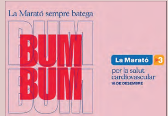
Imatge de la Campanya de la Marató d'aquest any

La ciutat de Balaguer ha organitzat un any més diferents activitats per a col·laborar amb la Marató de Televisió de Catalunya, que enguany està dedicada a les malalties cardiovasculars.