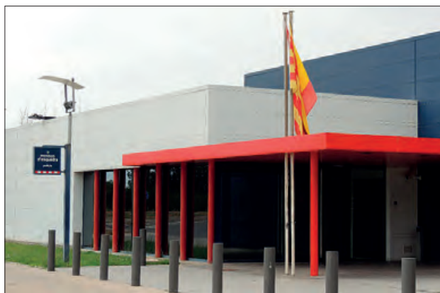
Comissaria dels Mossos d'Esquadra de Balaguer

Des del cos dels Mossos d'Esquadra, ens donen una sèrie de consells per aquestes vacances de Nadal, per si viatgem i per protegir encara més la nostra privacitat.