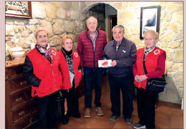
Entrega d'un dels carnets de fidelització

Aquesta col·laboració permet que Creu Roja pugui donar continuïtat als projectes per les persones d'extrema vulnerabilitat.