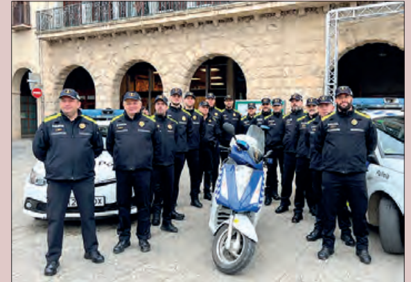
Celebració de la Patrona de la Guàrdia Urbana

El passat 8 de desembre, la Guàrdia Urbana de Balaguer va celebrar el dia de la seva patrona. Una trobada de tot el Cos al vestíbul de la Casa de la Paeria, amb les autoritats locals. Seguidament es va celebrar la missa solemne a l'església del Miracle. A continuació