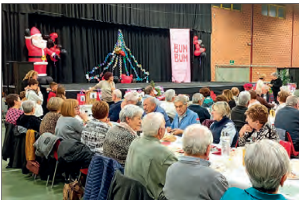
Diada per la Marató de Bellcaire