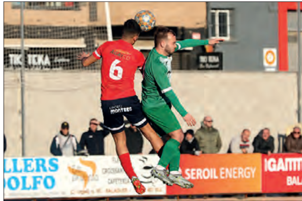
Una imatge contra Unificació Llefià

Els vermells però, van disposar de varies ocasions per, almenys, igualar el marcador, però els pals i el meta visitant ho van evitar.