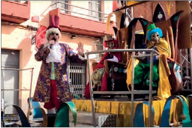
Rua de Carnestoles 2022