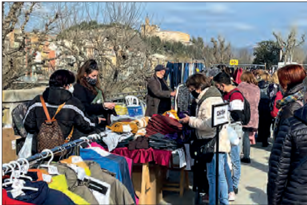
Mercat de les rebaixes d'hivern

de febrer, de 9 a 14 h, a la part baixa del Passeig de l'Estació. Aquest mercat es passa a fer en dissabte per aprofitar la visita a la ciutat