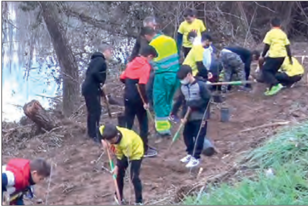
Alumnes de 4rt en la plantada d'arbres

Del 6 al 10 de febrer s'ha dut a terme la campanya Reforestem els espais naturals de Balaguer, al monestir de les Franqueses.