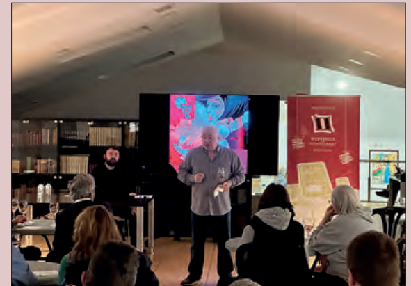
Un moment de la vetllada

Per vuitè any consecutiu, la Biblioteca Margarida de Montferrat s'adhereix al Projecte Biblioteques amb DO. La DO Costers del Segre és protagonista durant el mes de febrer, amb diferents activitats i un tast de vins. El dia 1, la xerrada "El