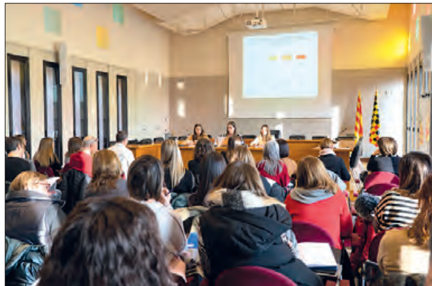
Un moment de la trobada

El dia 2 de febrer, va tenir lloc la 4a Jornada de treball del Protocol per a la intervenció en xarxa de les situacions de risc i/o maltractaments a la infància i adolescència. Organitzada per l'àrea de Serveis Socials del Consell, amb l'objectiu principal de revisar els acords consensuats entre tots els agents implicats, que treballen conjuntament en benefici dels infants i adolescents de la Noguera.