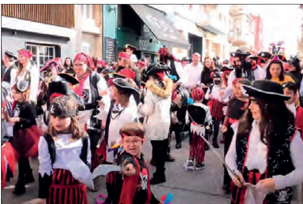
Rua de Carnestoles 2022

A la tarda, a partir de 2/4 de 6 començarà la Rua Jove! amb la que es concentraran totes les comparses, disfresses i animació al carrer Noguera Pallaresa. Rua i cercavila fins a la plaça del Mercadal, encapçalada per la Reina i el Rei Carnestoltes i amb el ritme del grup de percussió Bandelpal. Enguany es recupera el "Concurs de ball de comparses". Un concurs en el que els grups participants hauran de demostrar el seu talent dalt de l'escenari, això sí, ben