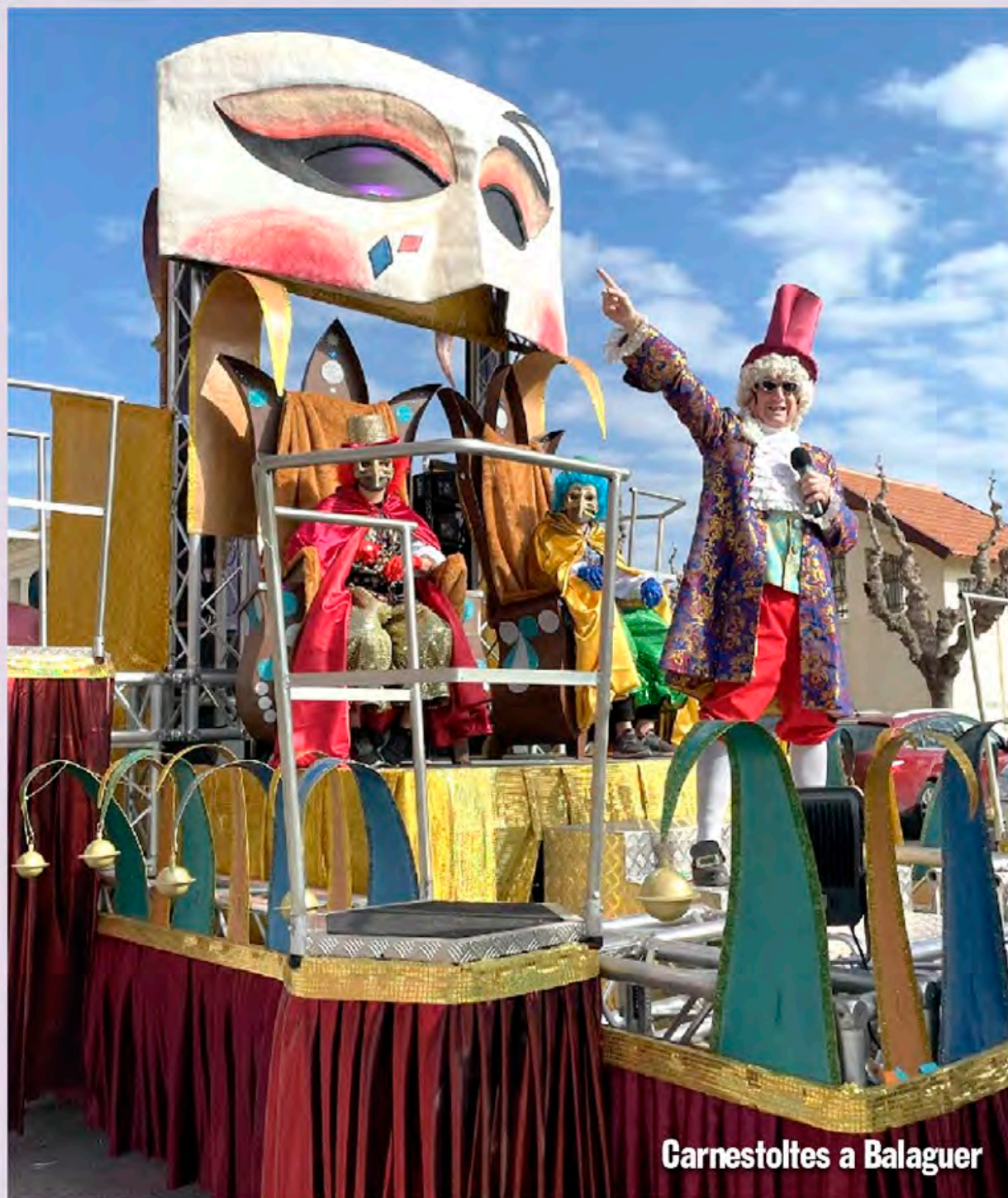
Garnestoltes a Balaguer