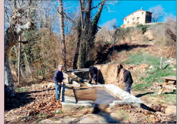
L'antic safareig d'Àger

L'Ajuntament d'Àger ha rebut una ajuda del programa LEADER per fer un espai d'acollida de visitants, una oficina de turisme i sales complementàries a la casa del Montsec.