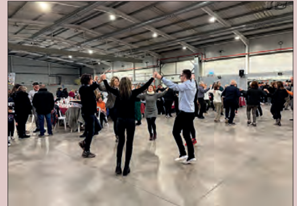
Un moment de la vetllada

Balaguer acollí el 28 de gener diferents actes en motiu de la Nit de la Sardana.