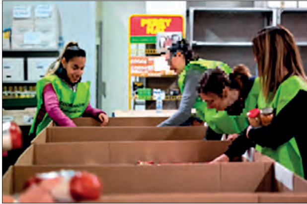
Participants a un dels programes de formació

Aquest darrer mes han finalitzat els programes de Treball i Formació de la línia Joves tutelats i extutelats