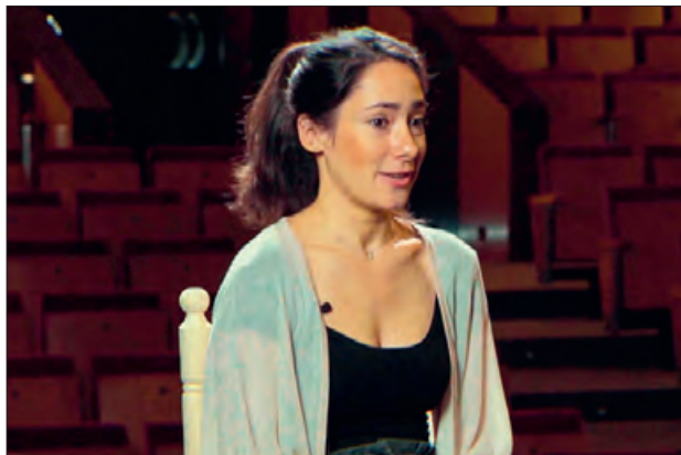
Una de les balaguerines que hi participa

La sèrie de vídeos es podrà veure al canal de YouTube de la Paeria.