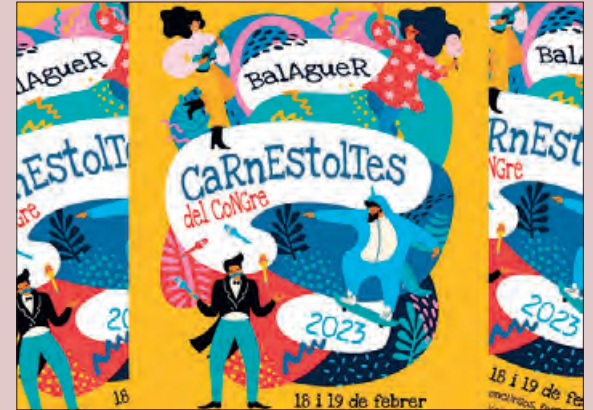
Imatge del Carnestoltes d'enguany

Pel que fa al ball de comparses del dissabte, hi poden participar, les comparses que s'inscriguin amb un mínim de 6 persones de 14 o més anys, tot i que hi poden participar menors. Les persones de la comparsa, hauran d'anar vestits al·legòricament d'acord amb el nom que s'inscrigui. En el moment de la inscripció s'ha d'informar de la cançó que s'utilitzarà per la coreografia. Les comparses tindran un temps (2 minuts i 30 segons) per fer la seva coreografia a l'escenari.