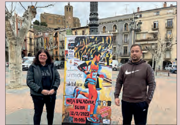
Presentació de la cursa

Els atletes comptaran amb l'al·licient del premi econòmic pels que trenquin els rècords de la prova. Així doncs es premiarà amb 150€ a l'atleta que superi el rècord masculí de la Mitja Marató de 1H04'40", i es premiarà amb 150€ a l'atleta femení que superi el rècord femení de la Mitja Marató de 1H23'42".