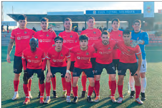
Formació del CF Balaguer contra l'Horta

Els pròxims encontres dels balaguerins són a Rubí el dia 12 de febrer i a la Guineuta, al barri de Guinardó de Barcelona el proper 26 de febrer. No serà fins al mes de març, i per disputar un derbi davant el CFJ Mollerussa, actual líder, que els vermells tornin a disputar un partit al Municipal de Balaguer.