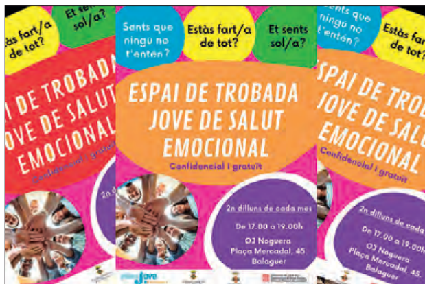
Cartell de les trobades

vi i el cava a la publicitat: de les bombolles a Martin Scorsese" a càrrec de Pablo Sancho. El 8, un recital de poesia fusionat amb rumba "Rumbesia a la natura". El proper dia 15 a 2/4 de 8 del vespre, tindrà lloc l'espectacle "I va venir el vi" amb Jordina Biosca.