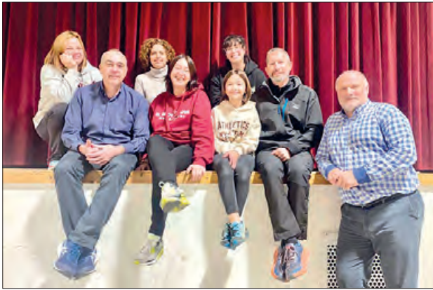
Actors i actrius de la Sucrera de Menàrguens

La companyia de teatre La Sucrera de Menàrguens presenta la seva obra, "Adossats", una adaptació de l'obra escrita per Ramon Madaula, al Teatre Municipal de Balaguer, el proper 19 de febrer a les 18