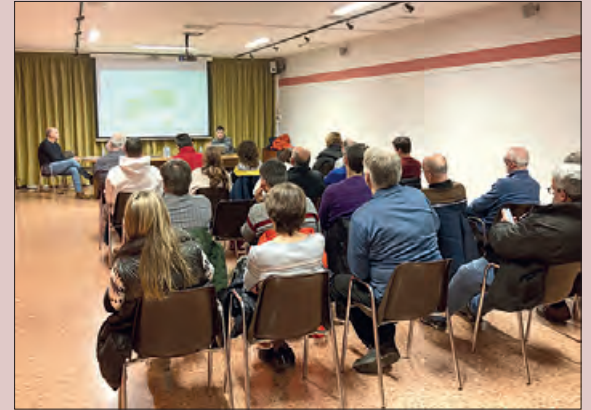
Un moment de la sessió

El passat mes de gener va tenir lloc l'acte fundacional de la comunitat energètica local de Vallfogona de Balaguer, una associació impulsada pels veïns i veïnes dels 3 nuclis de població del municipi (Vallfogona, la Ràpita, i l'Hostal Nou i la Codosa) juntament amb algunes de les PIME més representatives del municipi, i que compta amb el suport de l'Ajuntament.