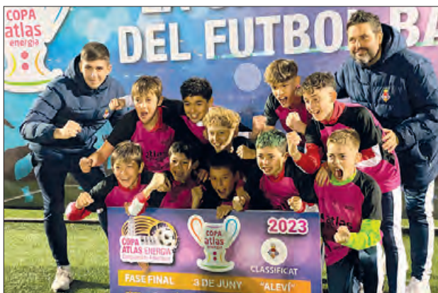
Equip Aleví Classificat per la fase final de la Copa Atlas