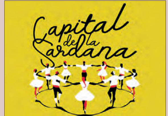
Balaguer finalitza l'any de la capitalitat de la Sardana

Els propers dies 25 i 26 de febrer la ciutat de Balaguer celebrarà la Cloenda de la Capitalitat de la Sardana 2022. Durant tot l'any s'han programat actes i activitats que aquest darrer cap de setmana de febrer donaran per finalitzada la capitalitat.