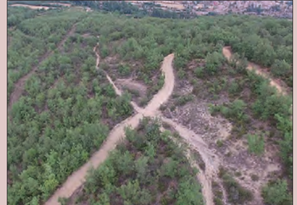
Zona d'actuació de la Via Romana aquest estiu

L'Ajuntament d'Àger ha rebut una ajuda de 5.491 euros per a fer obres de conservació i manteniment al jaciment arqueològic conegut com a Via Romana d'Àger. El deteriorament i la forestació estan envaint el traçat de La Via Romana d'Àger, també coneguda com "l'antic camí de Balaguer". És un jaciment arqueològic declarat Bé Cultural d'Interès Local (BCIL), de gran interès històric i natural present a les guies turístiques de la Vall d'Àger dins de la seva oferta senderista per a turistes amants de la natura. Per aquesta reforma de la Via Romana d'Àger es preveu: el control de la vegetació invasora, causada pel desús del camí