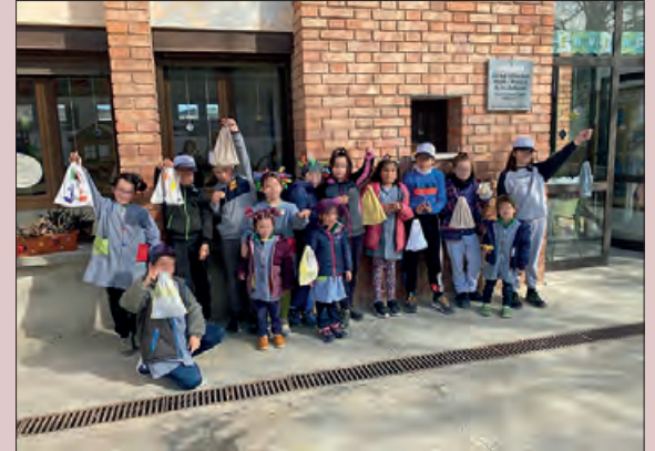
Els alumnes de l'escola de les Avellanes ja en fan ús

A partir d'aquest mes de febrer, nou escoles de la comarca participaran a la campanya impulsada per l'àrea de Residus de la Noguera per fomentar l'ús de tovallons de roba als menjadors escolars.