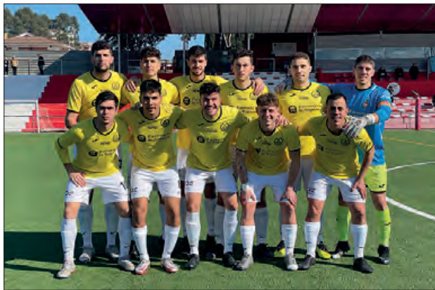
Equip inicial del CF Balaguer contra l'UE Rubí

La segona part va estar una mica més relaxada pel que fa a la generació situacions de perill, però els rubinencs van mantenir bastant la pilota. Per part balaguerina, van tenir varies ocasions