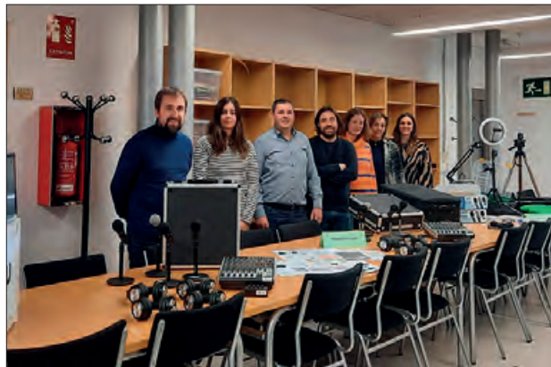
Conveni entre Consell i Serveis Educatius

El Consell Comarcal i el Servei Educatiu de la Noguera van subscriure un conveni econòmic gràcies al qual s'han adquirit una sèrie de recursos pedagògics per fer préstec als centres educatius de tots els nivells de la comarca i potenciar la formació del professorat. Amb el préstec d'aquests materials es pretén augmentar la qualitat del suport educatiu i els recursos que arriben als centres educatius de la comarca.