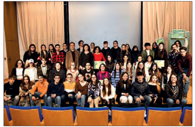
Foto de grup en el lliurament de premis