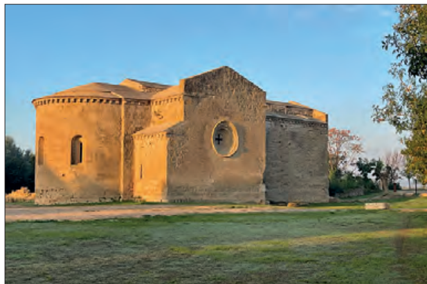
Santa Maria de les Franqueses