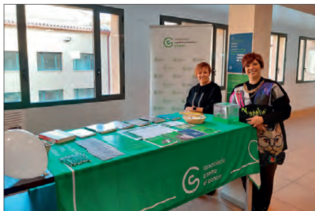
Exposició a la Biblioteca Municipal

Per aquest motiu, des de les diferents juntes locals de la Noguera van il·luminar en verd diferents monuments municipals a Balaguer, Ponts i pobles veïns, Bellcaire, Algerri, la Ràpita, Menàrguens, Gerb, Montgai i Butsènit.