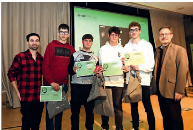
Grup Els Fuets de l'Institut Almatà

El concurs, organitzat per l'AMIC (Associació de Mitjans d'Informació i Comunicació) té l'objectiu d'impulsar l'ús del català a Internet, promovent noves plataformes digitals entre els joves i s'espera continuar arribant a més centres en les pròximes edicions.