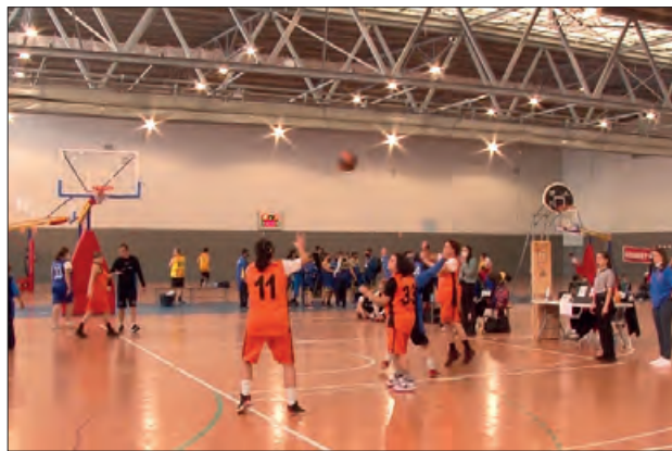
Campionat de Catalunya de Bàsquet ACELL a Balaguer

El club l'Estel de Balaguer serà l'amfitrió de la trobada.