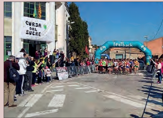
Última edició de la cursa del sucre

Aquesta cursa és una prova puntuable per a la Lliga Ponent.