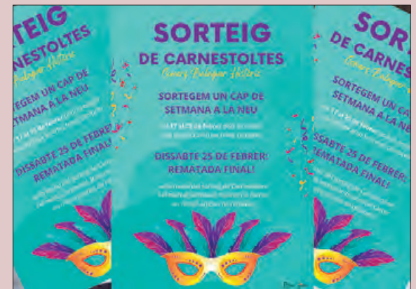
Cartell de sorteig

Els comerciants del Centre Històric de Balaguer s'han unit de nou per fer un sorteig per les compres fetes del 17 al 25 de febrer, per acabar de rematar els stocks d'hivern.