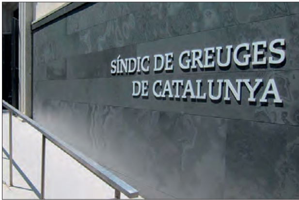
Visita del Síndic a Balaguer al Casal Lapallavacara

El proper dilluns dia 13 de març, l'equip del Síndic (el defensor de les persones), atindrà les visites al Casal La Pallavacara (carrer Francesc Borràs, 19) de Balaguer de 9 a 14 h, per atendre les persones que vulguin fer-li consultes o exposar-li les seves quei-