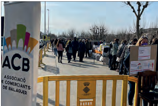
Mercat de les rebaixes d'hivern

febrer, a la part baixa del Passeig de l'Estació de 9 a 14 h. Aquest mercat es passa a fer en dissabte per aprofitar la visita a la ciutat