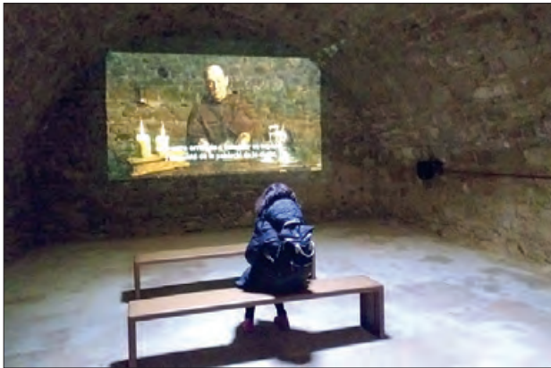
Nova sala restaurada

ció que té com a objectiu preservar l'espai històric i alhora donar a conèixer el relat a través del qual s'explica la història de la ciutat