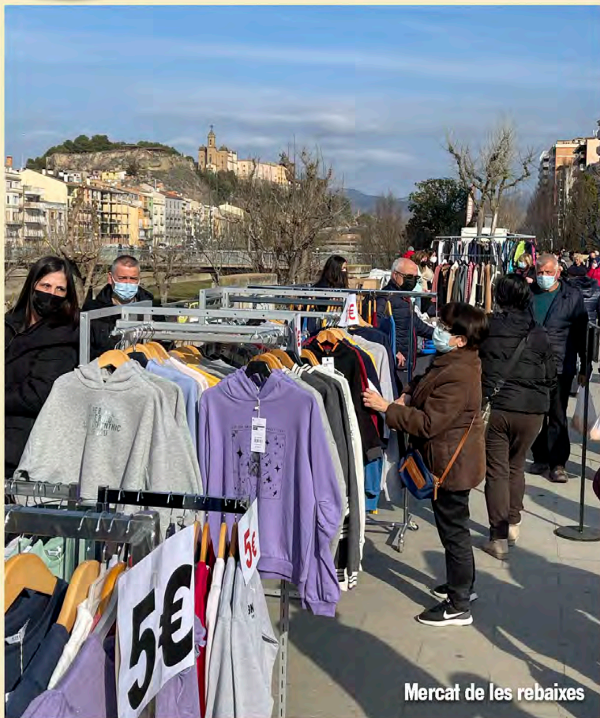
Mercat de les rebaixes