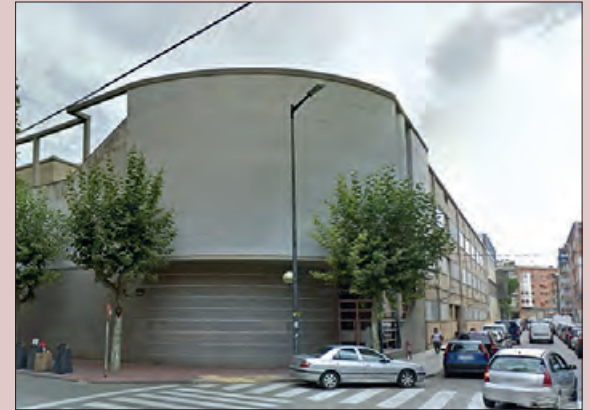
Escola Vedruna Balaguer

L'Escola Vedruna Balaguer ha participat al Global Camp de la Fundació Vedruna Catalunya Educació, el passat dissabte 4 de març al Recinte Firal El Sucre, de Vic. Amb el lema 'Comprendre, empatitzar i actuar per transformar el món' s'hi van exposar fins a 70 projectes educatius que alumnes de les escoles Vedruna de tot el país han impulsat en l'àmbit dels Objectius de Desenvolupament Sostenible i de l'Agenda 2030.