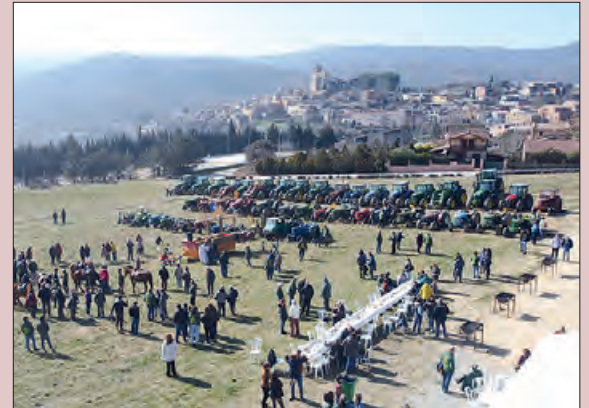
Festa dels Tres Tombs a Àger

Àger va celebrar el passat dissabte 4 de març, la VI Festa dels Tres Tombs, una festa popular que posa en valor la pagesia i la vida rural i que antigament servia per beneir el bestiar que feinejava al camp perquè les collites i els ramats fossin abundants.