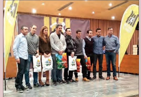
Foto d'arxiu Gala Mitges de Ponent 2017

El club local Runner's Balaguer C.E. serà l'encarregat d'organitzar a Balaguer la propera gala de mitges de Ponent, un projecte que va néixer fa uns anys agrupant les 4 mitges de ponent; La Mitja de Balaguer, la Mitja de Tàrraga, la Mitja de Mollerussa i la Mitja de Balaguer.