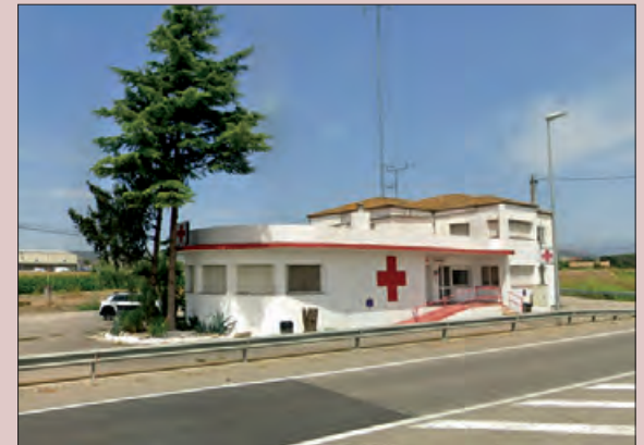
Seu de Creu Roja La Noguera

Creu Roja La Noguera ha organitzat per aquest dissabte 11 de març a les 11h, una jornada de portes obertes amb l'objectiu de poder reconèixer el gran suport dels seus socis i sòcies, així com informar sobre les tasques d'ajuda a les