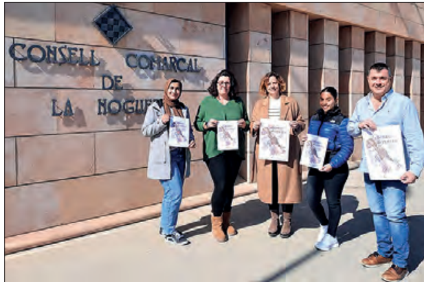
Presentació actes del Dia de la Dona