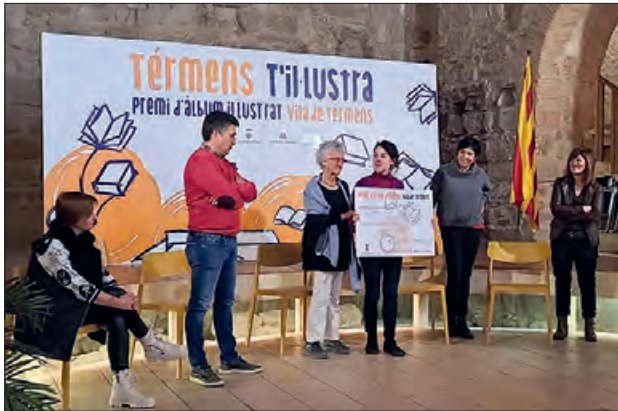
Entrega de premis

L'Ajuntament de Tèrmens va fer l'entrega del 4t Premi d'Àlbum Il·lustrat Vila de Tèrmens el passat 26 de febrer. L'obra guanyadora va