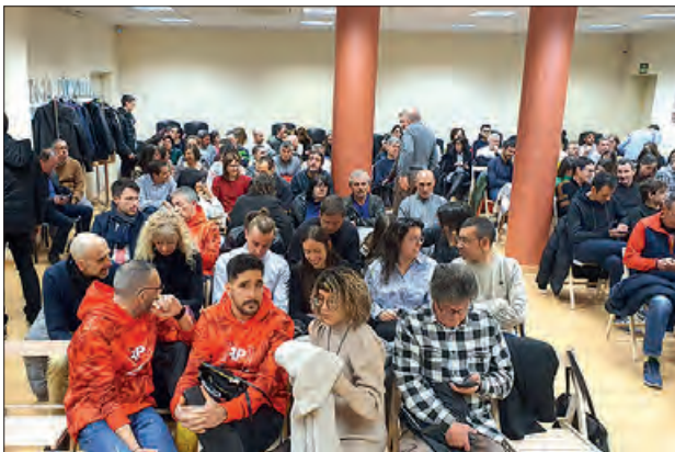
Públic assistent a la Gala d'entrega de premis