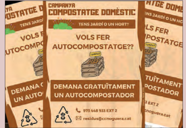
Imatge de la nova campanya

A partir d'aquest mes de març l'Àrea de Residus del Consell Comarcal de la Noguera impulsa una nova campanya per fomentar el reaprofitament dels residus dins l'àmbit domèstic, concretament la fracció orgànica i la vegetal generades a les llars que tenen jardins o horts convertint-les en compost orgànic.