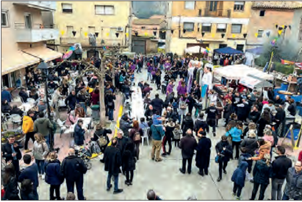
Una edició passada de FiraGerb

El proper diumenge 26 de març se celebrarà la VIII edició de FiraGerb. L'organització de la fira ja ha començat a rebre inscripcions dels paradistes que volen formar part d'aquesta fira de proximi-