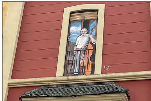
Imatge de la pintura

Aquest tercer balcó il·lustrat, dedicat al músic i compositor d'Àger amb un estret vincle amb la ciutat de Balaguer, el qual va arribar a compondre més d'un centenar de sardanes. Per aquest motiu, es presenta aquesta pintura mural en el context dels actes de la Capital de la Sardana, per tal de retre homenatge a la seva tasca i trajectòria. Igualment a