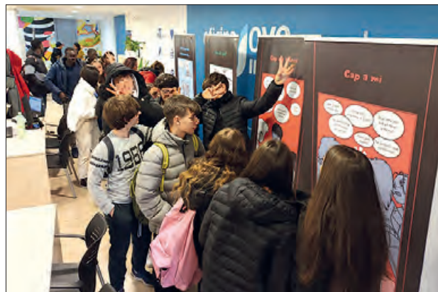
Exposició “Sota Pressió”

Alumnes de 4t d'ESO de quatre centres de la comarca, amb un “escape room”, treballaran de forma participativa el món de les addiccions i com poden superar aquestes conductes de risc.