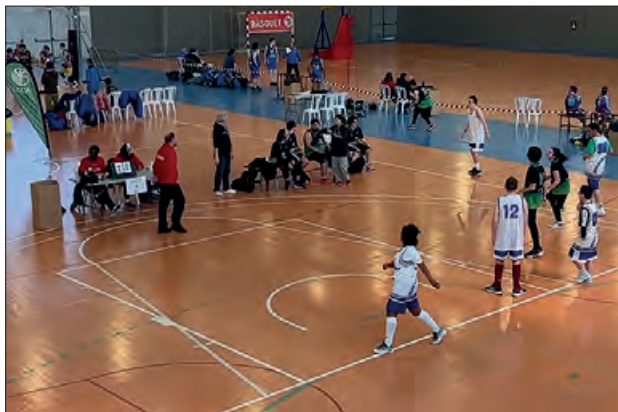
Un moment del campionat

pavelló Inpacsa i 1r d'Octubre de Balaguer. Aquest campionat està organitzat per la Federació Catalana d'Esports per a persones