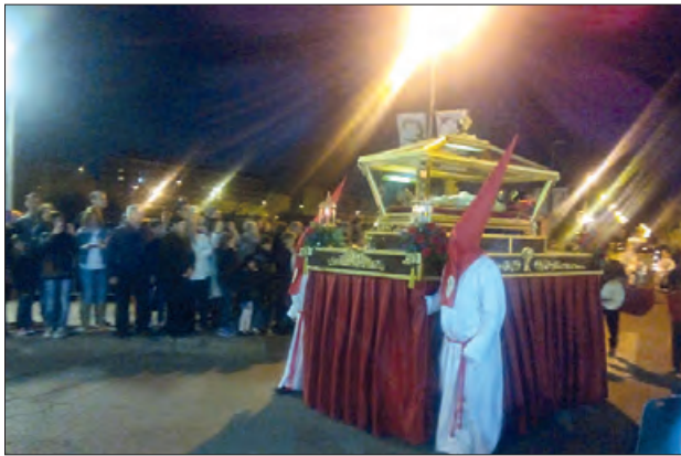
El "Santo Entierro"

La Confraria dels Dolors i els Armats del Sant Sepulcre de Balaguer, ha organitzat pel proper 11 de març el pregó de Setmana Santa després de la pausa provocada pel COVID, amb aquest acte s'iniciaran els actes més importants de la Setmana Santa.