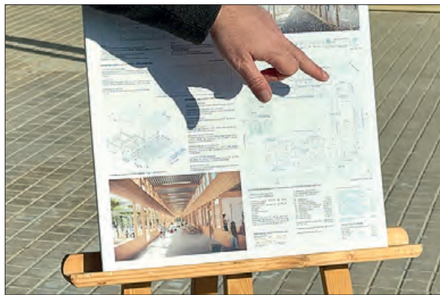
Nou projecte per l'Escola Mont-roig

La redacció del projecte bàsic, el projecte executiu i la posterior direcció d'obra per l'ampliació de l'escola Mont-roig ha comptat amb un pressupost de 175 mil euros. A partir d'ara es farà la redacció del projecte definitiu que podria estar enllestit en uns 5 mesos. Després del procés d'exposició pública i adjudicació, les obres podrien començar a finals d'any i tindrien un període d'execució d'entre 8 i 9 mesos.