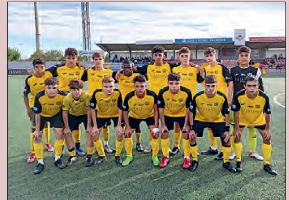
Juvenil B del CF Balaguer

L'equip del Juvenil B del CF Balaguer, que juga en la segona categoria (grup 8) està fent una gran temporada. Aquest equip que ara mateix està en quarta posició de la classificació s'està esforçant molt en jugar bé i treballant de valent per poder