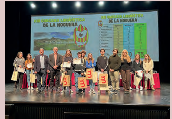
Entrega de premis

El Teatre Municipal de Balaguer va ser escenari el 7 de març de la final de la XIII Gimcana Lingüística de la Noguera, amb la participació dels alumnes de 2n d'ESO de l'Institut d'Almatà, l'Institut Ciutat de Balaguer i l'Escola Pia, que ha estat