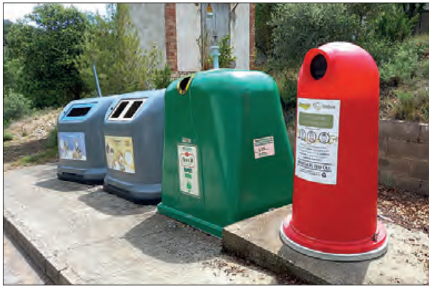
Contenidors a Àger

L'Ajuntament d'Àger, en col·laboració amb l'associació Vidia, va instal·lar a finals del mes de maig, dos contenidors d'oli utilitzat, amb l'objectiu de promoure la recollida i el reciclatge d'oli de cuina