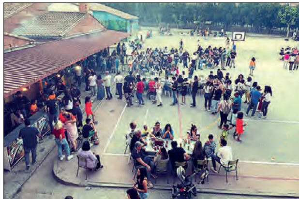
Un moment de la festa

Diferents tallers organitzats pel centre esplanai Gaspar de Portolà, i també pels membres de la comunitat escolar de caire creatiu i educatiu. A més, el grup de zumba format per mares i infants de l'escola va mostrar els seus balls,