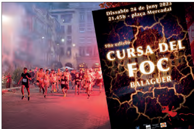
Cursa del Foc o Nit del Comerç del CH

Una cursa de 5 km, oberta a tothom i sense límit d'edat, amb un recorregut totalment urbà, que es podrà fer corrent, fent jogging