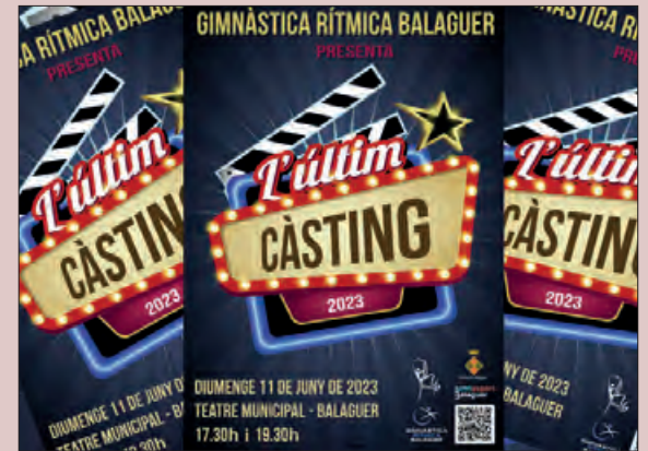
Cartell de l'espectacle

L'Escola Municipal de Gimnàstica Rítmica de Balaguer acomiada el curs amb un espectacle al Teatre Municipal de Balaguer el proper diumenge 11 de juny.