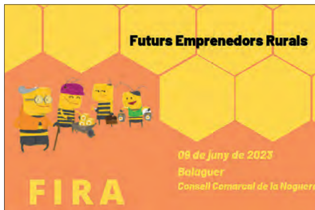
Imatge gràfica de la Fira a Balaguer

format per experts de diferents àmbits relacionats amb l'empresa i l'educació valorarà els diferents projectes presentats i atorgarà a cada projecte una menció remarcant el punt fort de cada grup empresarial, per tal de posar en valor totes les iniciatives pre-