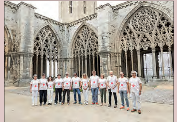
Foto dels alcaldes de la ruta

El passat 1 de juny es va presentar la nova ruta turística de les terres de Lleida, que porta per nom 'Fars de Ponent'. Aquesta ruta pretén ser un agermanament de les talaies més emblemàtiques de la zona, com poden ser campanars, torres o miradors.