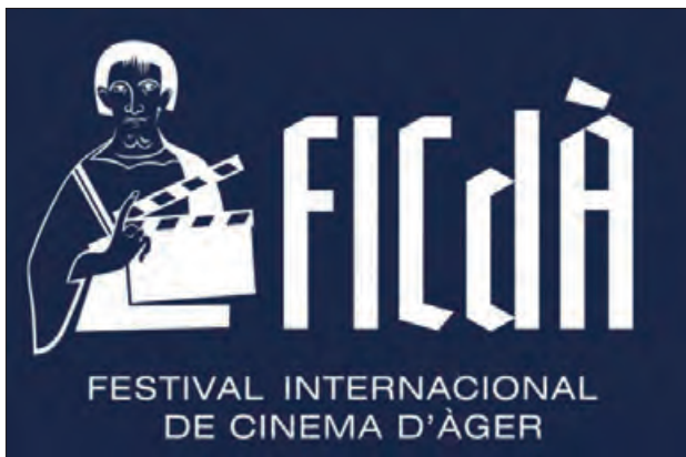
Festival de cinema a Àger

L'organització del Festival Internacional de Cinema d'Àger (FICdÀ) ha decidit avançar el certamen una setmana, després que el president espanyol, Pedro Sánchez, anunciés la convocatòria d'eleccions generals per al 23 de juliol de 2023. El FICdÀ, un cer-