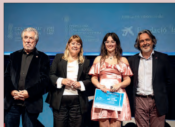
Guanyadora del primer premi Ficcions 2023