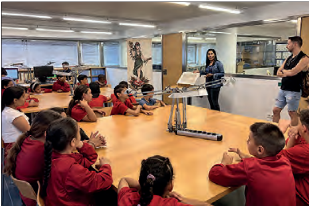
Visita dels escolars a l'Arxiu

juny, alumnes de diverses escoles de la ciutat van passar per aquest equipament per conèixer les instal·lacions d'aquest equipament