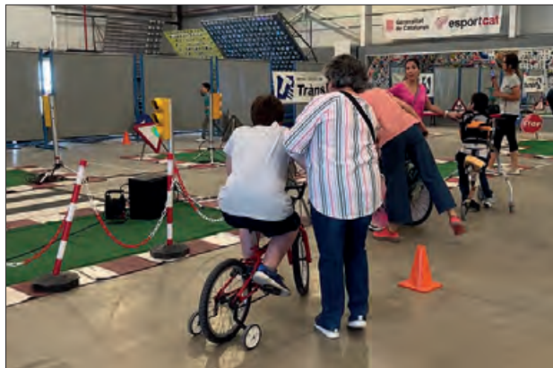
Circuit del Servei de Trànsit al Molí de l'Esquerrà

Els principals objectius de la campanya són ajudar a l'alumnat a adquirir uns comportaments viaris correctes, treballar les normes i situacions que es poden viure en circulació, ensenyant-ho de la manera més àgil i didàctica.