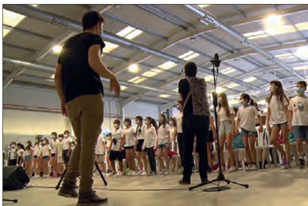
Activitat "Musiquem" d'una passada edició

Per segon any consecutiu, l'Escola Municipal de Música ha coordinat aquesta activitat, amb uns 240 alumnes de 5è de primària de tots els centres educatius de la ciutat i l'Estel.