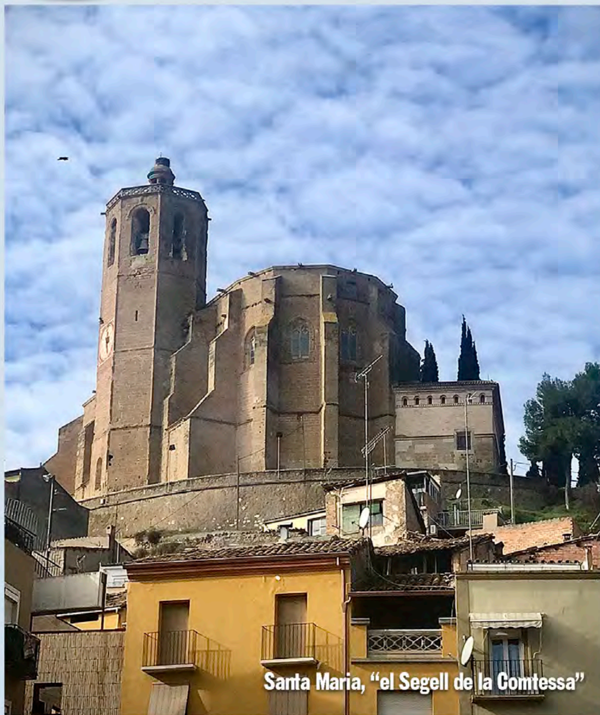
Santa Maria, "el Segell de la Comtessa"