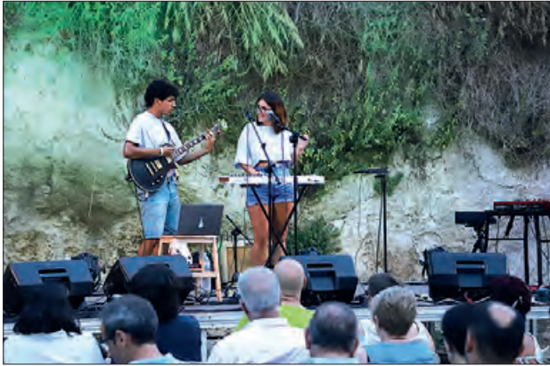
Un dels concerts de l'any passat del cicle

L'Ajuntament de Térmens ha presentat al Centre Cultural de Sant Joan, la segona edició del Festival EntreRius, un cicle de quatre concerts que transcorreran, aquesta any, els