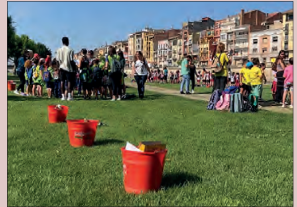
Les activitats es van fer al marge del riu Segre

El passat dilluns 5 de juny, es va celebrar al parc de la Transsegre, el Dia Mundial del Medi Ambient a la Noguera, amb la participació d'uns 200 alumnes de cycle inicial dels centres educatius de Balaguer