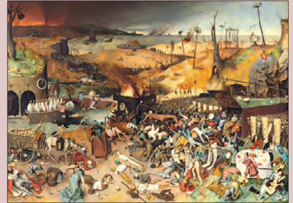
Imatge del Cartell de la Càtedra Medieval d'enguany

Els dies 10, 11 i 12 de juliol a la sala d'actes del Consell Comarcal de la Noguera, tindrà lloc la 26a edició de la Càtedra d'Estudis Medievals Comtat d'Urgell.