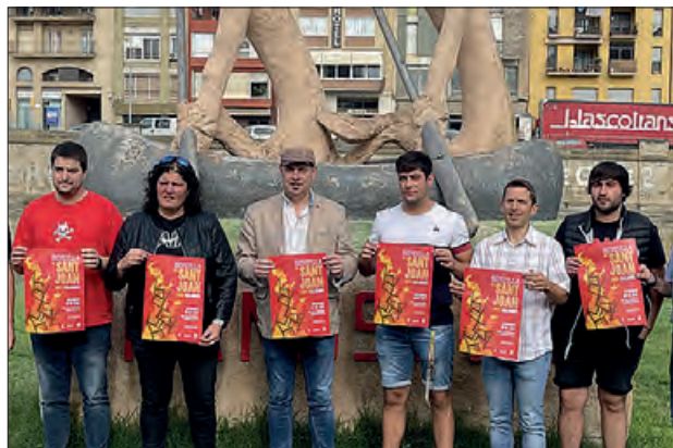
Presentació de la Festa

Durant l'espectacle s'oferirà als assistents