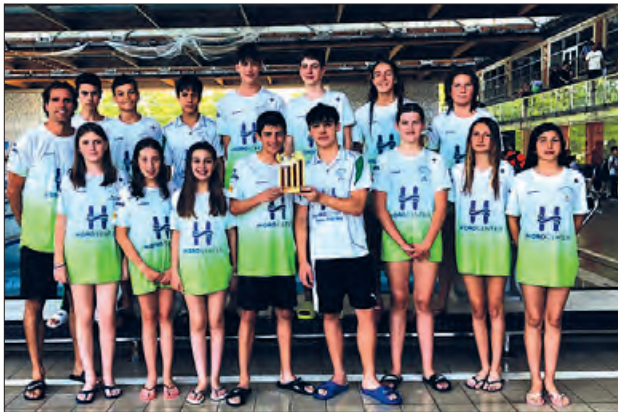
Participants del CEN Balaguer