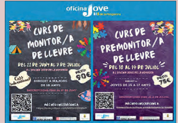
Curs organitzat per l'Oficina Jove de la Noguera

L'Oficina Jove del Consell Comarcal de la Noguera ha organitzat de cara a aquest estiu un curs de monitor/a de lleure i un altre de premonitor/a de lleure. Tots dos cursos, en format presencial i impartits per la Fundació Verge Blanca, es duran a terme a l'Oficina Jove durant els mesos de juny i juliol. El curs de monitor/a de lleure va dirigit preferentment a joves d'entre 18 i 30 anys de la comarca de la Noguera que vulguin treballar en espais, colònies, casals de vacances, camps de treball, escoles, ludoteques o moviments educatius diversos. Les persones majors de 30 anys o no residents a la Noguera