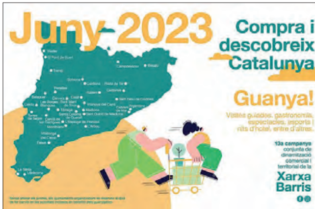
Imatge promocional de la campanya

Torna a Balaguer la campanya 'Compra i descobreix Catalunya'. Les dues associacions de comerciants de Balaguer i la Paeria han presentat fa uns dies la que serà la 13a edició, i la 7a que se celebra a la ciutat, d'aquest projecte que busca la promoció del