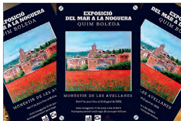
Cartell de l'exposició

Quim Boleda és barceloní, nascut l'any 1949. De formació autodidacta,