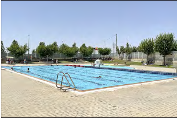
Piscines del Secà