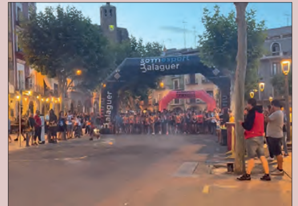
Una edició anterior de la Cursa del Foc

Una activitat vinculada a la Nit del Comerç del Centre Històric, des d'on s'han organitzat diversos actes paral·lels per a gaudir d'una jornada lúdica i d'esport. Per aquest motiu, l'Associació de Comerciants del Centre Històric obsequiarà amb 4 lots de productes, que es podran trobar al llarg del recorregut i que podran recollir els participants que s'atreveixin a dur-lo fins a la meta. Els atletes només podran dur un obsequi a l'arribada de meta.