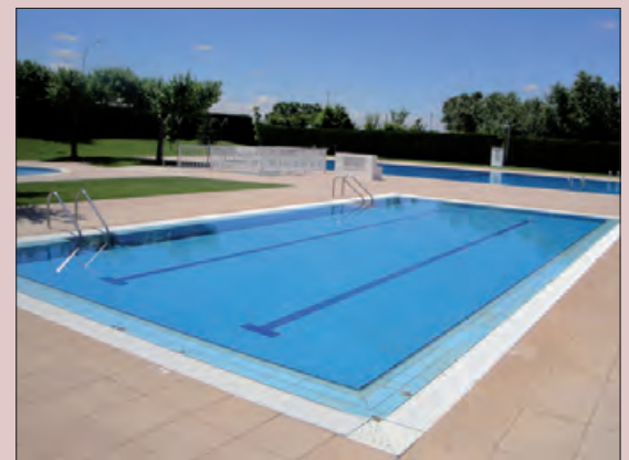
Piscines de Térmens

Disposa de 2.500m 2 d'instal·lacions, amb tres vasos, zona de gespa, arbres, para-sols i hamacs. Obertes del 17 de juny al 3 de setembre. Horari d'11.30 a 20.30 h. Servei de bar amb terrassa, socorrista. Els dimarts i dijous de juliol i agost fan aquagym a les 19.30 h i tots els dies de juliol, entre les 14 i 15 h fan cursets de natació (a l'agost segons inscrits). El 9 de juliol es fa una festa aquàtica coincidint amb el "Mulla't per l'esclerosi". L'abonament val 33€ (+3 anys), pels jubilats 21€. Per temporada "no residents" val 50,50 €. L'abonament de 15 entrades surt per 22€ pels residents i 150€ pels no residents. Les famílies nombroses i monoparentals, descompte del 30% en l'abonament de cada membre. Les entrades d'un dia valen 3,25 €, pels residents, 2,20€ pels jubilats, 12€ pels no residents i 4€ pels jubilats no residents.