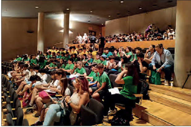
Imatge de la trobada

El passat 13 de juny, l'alumnat de cicle superior de la ZER El Montsec va participar en la trobada de cançó improvisada de Ponent “Corrandescola”.