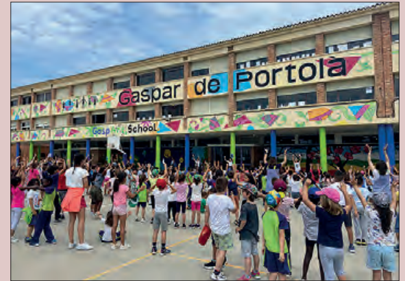
English Day de l'Escola Gaspar de Portolà

Els i les alumnes de 6è van assumir un paper protagonista, creant 28 tallers, dissenyats específicament per involucrar alumnes de diferents nivells. Els infants van gaudir de jocs, activitats, cançons, balls i altres dinàmiques en anglès.