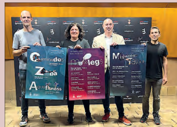
Acte de presentació o cartell

La Paeria fa incís un any més en la prevenció de la calor, tenint en compte les recomanacions habituals, com beure aigua sovint i menjar fruita, evitar fer exercici a les hores de més calor, tenir especial cura de les persones grans i dels infants, i descansar en espais a l'ombra de cara als mesos d'estiu.