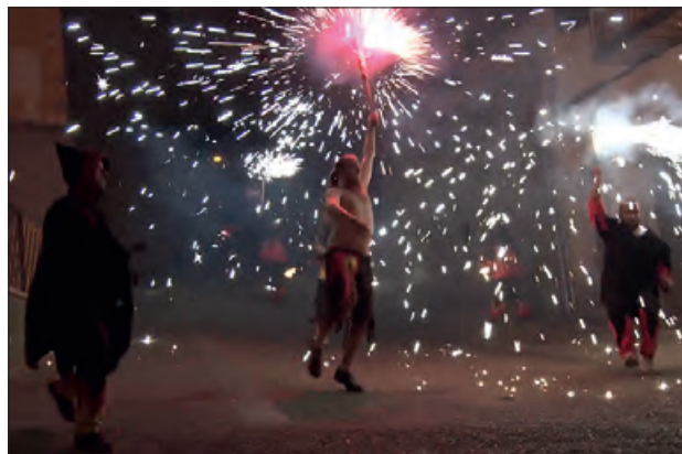
Sant Joan de l'any passat

Durant l'espectacle s'oferirà als assistents