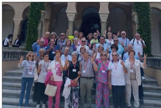
Sortida a les instal·lacions de Vichy Catalan

licious Restaurant del mateix Balneari, també van fer una visita a la fàbrica de Font d'Or a Sant Hilari Sacalm.