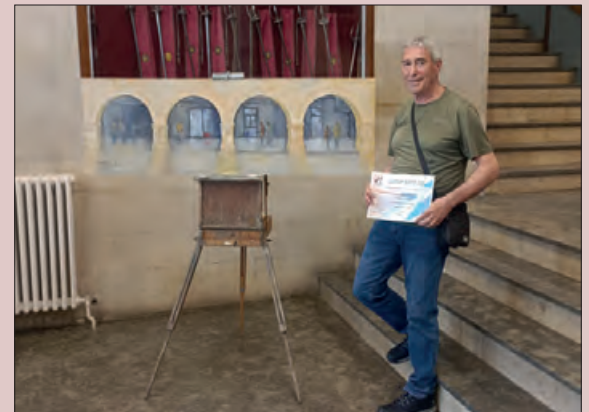
Primer premi del 2n Concurs de Pintura Ràpida

Van ser quinze els participants, i es poden veure les obres exposades a l'aparador de Cal Busquets (Pl. Mercadal, 27).