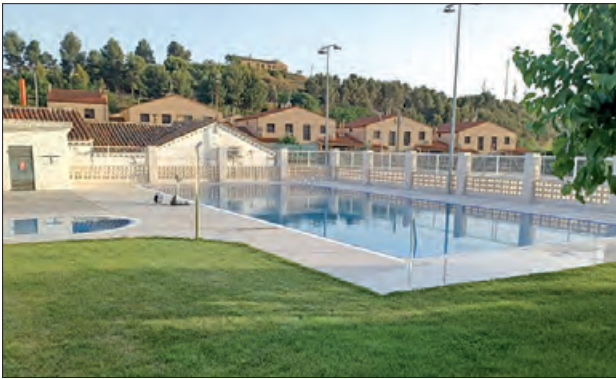
Piscines de Cubells