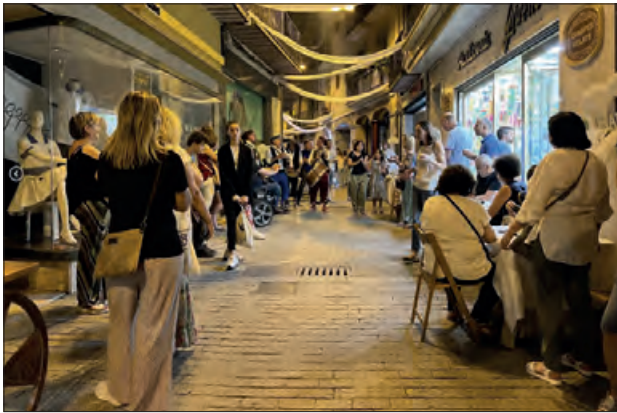
Festa del Comerç del Centre Històric

La festa de la Nit del Comerç del Centre Històric, que organitza l'Associació de Comerciants del Centre Històric, es celebrarà el proper 24 de juny, conjuntament amb la Cursa del Foc.