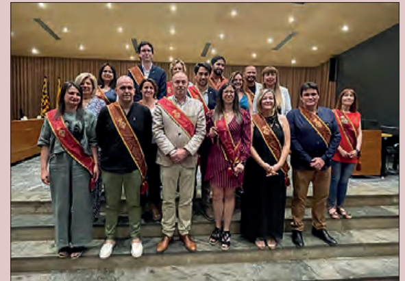
Constitució del nou equip de govern a Balaguer

La Paeria de Balaguer va celebrar el passat dissabte 17 de juny el Ple de Constitució, amb el nou equip de govern.