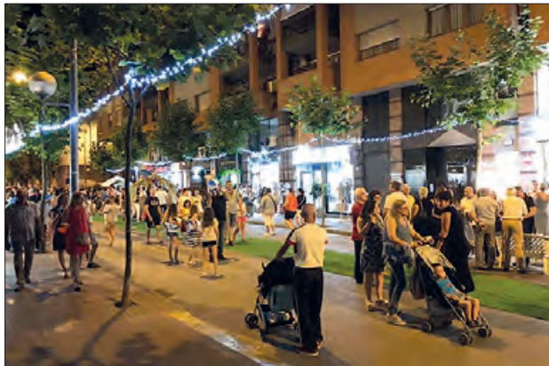
Festa del Comerç a Balaguer

El proper dissabte 1 de juny, l'Associació de Comerciants ACB organitzarà la Nit del Comerç, amb activitats des de les 18 h fins a la una de la matinada. La festa del comerç, és un activitat per promoció el comerç i la restauració local, una activitat on