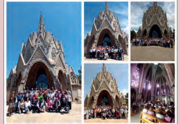
Participants a la sortida

En les darreres setmanes, les diferents Aules de Formació de la Noguera han gaudit de la sortida cultural que cada any es programa com a activitat del curs.