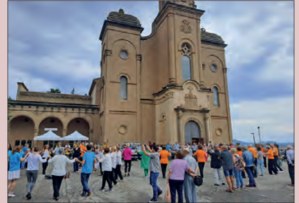
Celebració a Balaguer

El Santuari del Sant Crist ha estat l'escenari aquest diumenge 18 de juny de la Matinal Sardanista, coincidint amb el Dia Universal de la Sardana.