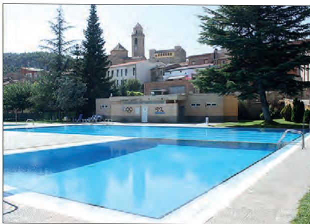
Piscines municipals d'Os de Balaguer

L'obertura de les piscines, és del 23 de juny al 10 de setembre amb horari de les 11.30 h a 20.30 h tots els dies, tancant de 14 a 15 h per necessitats dels servei.