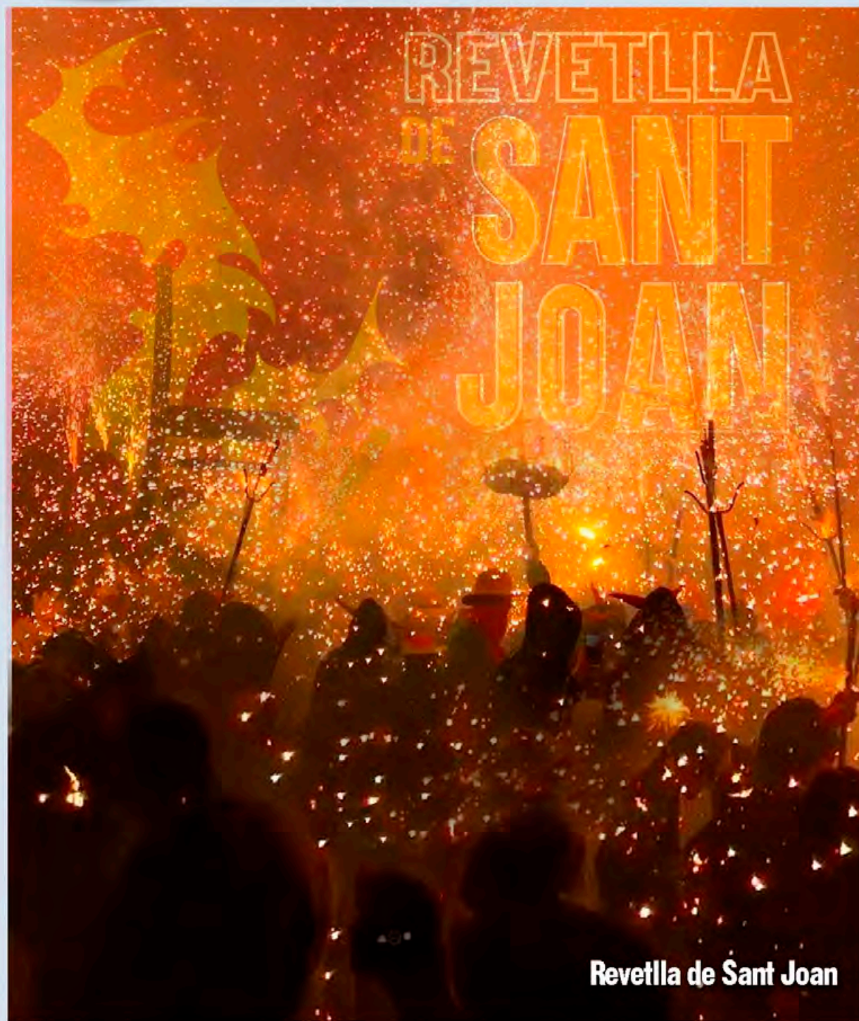
Revetlla de Sant Joan