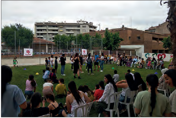
Celebració de la festa de fi de curs

El centre Sant Domènec de Càritas va celebrar la seva festa de fi de curs el passat dijous 8 de juny, una festa que té la finalitat de reconèixer la tasca de tots/es els/les voluntaris/es, que amb la seva ajuda fan