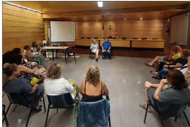
Un moment de la presentació