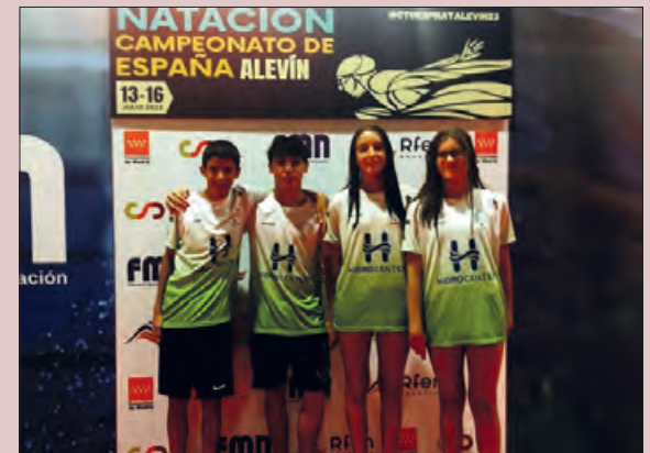
Els nedadors del CEN Balaguer