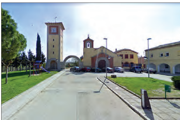
La Plaça Santa Margarida és on es faran tots els actes