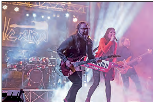
Doble Cara Group

Diumenge el mati començarà el repic de campanes, una missa en honor al sant Salvador i un vermut popular amb el duo Zarabanda. Al vespre es farà ball, sopar popular i castell de focs, acabant altre cop amb l'orquestra Exel.