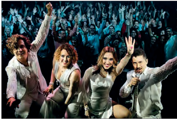
Tribut a Abba amb Abba Voices

Dissabte tarda començant amb una trobada gegantera, una holi party i una festa de l'escuma. A la nit música amb el tribut a Abba amb Abba Voices i un dj que posarà música dels 80. Diumenge un vermut popular i una ballada de gegants. Per la tarda els més menut gaudiran de l'espectacle Adéu Peter Pan. Els actes s'acabaran amb ball llarg amb Excelsior i a la mitja part entrepans per tothom i castell de focs.