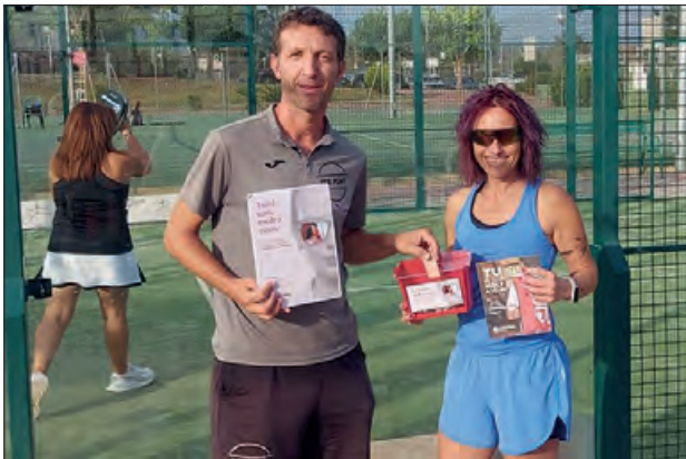
Lliurament dels beneficis recaptats

organitzat per l'empresa FerPlaySports, ha estat un gest solidari que promou l'esperit esportiu i l'ajuda als més necessitats, re-