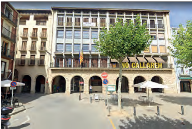
Paeria de Balaguer

Els llocs de treball que s'ofereixen són diversos: auxiliars administratius, caps de brigada d'obres, agents cívics per gestió de residus, acompanyants per a la gent gran, paletes i jardiners.