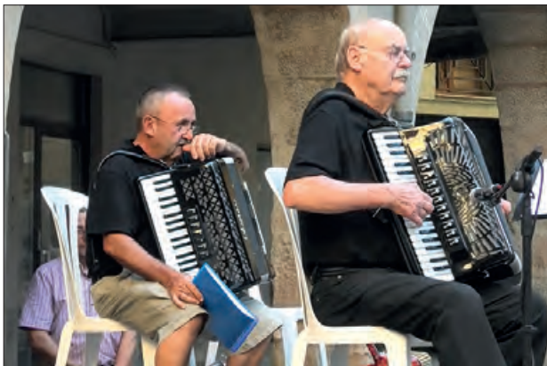
Imatge de la trobada d'acordions l'any passat

L'Associació dels Amics de l'Acordió de Balaguer, organitza la XII Trobada d'Acordions 'Ciutat de Balaguer' pel proper 22 de juliol a la plaça del Pou a les 18.30 h. Aquesta trobada on es podrà escoltar la música dels acordions en directe amb músics vinguts de Catalunya i altres indrets de l'Estat.