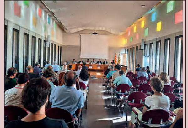
Inauguració de la Càtedra d'enguany

El 10 de juliol es va inaugurar la 26a edició de la Càtedra d'Estudis Medievals Comtat d'Urgell, a la seu del Consell Comarcal de la Noguera, que es va desenvolupar durant els dies 10, 11 i 12 de juliol.