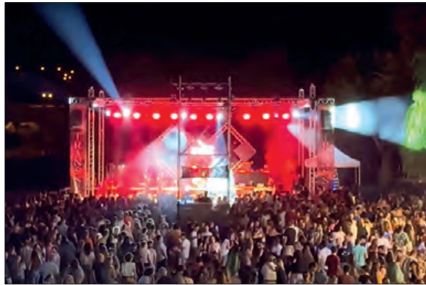
Festa nocturna al Parc de la Transsegre

L'organització de la Transsegre, comunicava uns mesos enrera que enguany no es podria gaudir de les tradicionals baixades amb barques des de Camarasa a Sant Llorenç dissabte tarda i de Gerb a Balaguer el diumenge al mati a causa de la sequera que pateix el territori, i sense poder fer baixar el Segre amb un abundant cabdal que es necessita per fer aquesta festa de l'aigua, enguany es suprimia aquesta part de la festa.