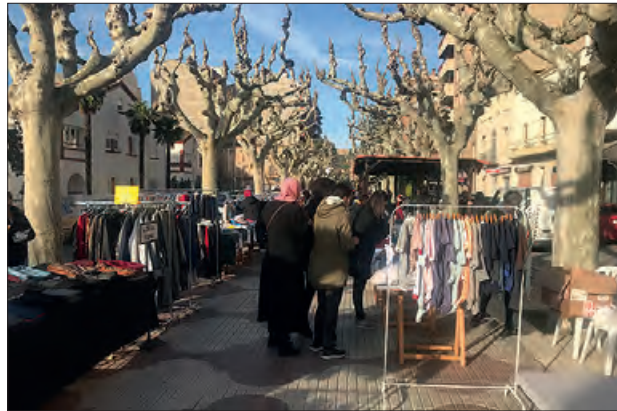
Una edició anterior

El mercat d'estiu es farà al Mercat al Passeig de l'Estació. S'havia provat en alguna edició anterior al primer tram de l'Avinguda Països Catalans, fins arribar a la plaça del Morter. Donat que el Passeig ofereix més ombra i les altes temperatures de l'agost, el mercat, que estarà obert des de les 10h del matí fins