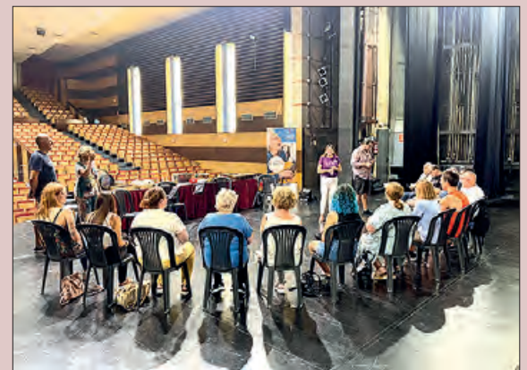
Un moment de l'activitat

Una proposta musical i inclusiva dins els actes culturals a la nostra ciutat.