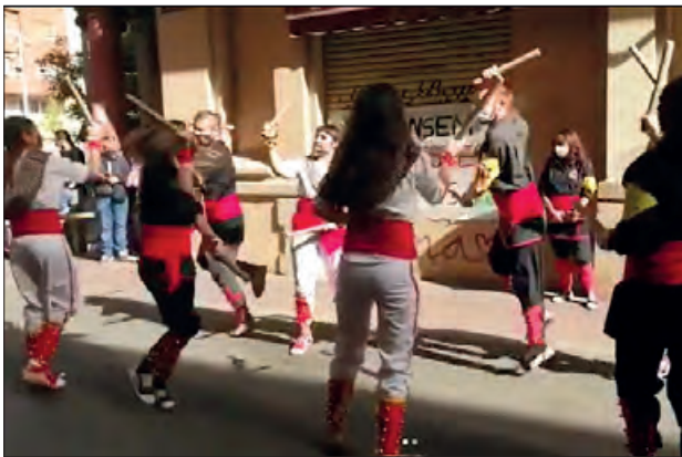
Una actuació de la Colla Bastonera de Balaguer

El pròxim dissabte 22 de juliol es celebrarà la VIII Diada Bastonera a Balaguer, amb un recorregut per diferents indrets de la ciutat. Serà a partir de les 19 h que es podrà gaudir a