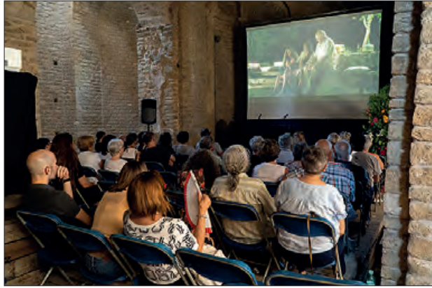
Projecció d'una de les pel·lícules

El FICdÀ-Festival Internacional de Cinema d'Àger ha posat fi a la seva primera edició. El festival, que s'ha celebrat del 13 al 16 de juliol a la majestuosa Col·legiata de Sant Pere d'Àger, ha estat tot un èxit. L'aforament s'ha completat, pràcticament, en la totalitat de les sessions de curtmetratges i llargmetratges, a les gales d'inici i de cloenda i la participació a les activitats paral·leles. En total un miler de persones ha passat per Àger aquests dies.