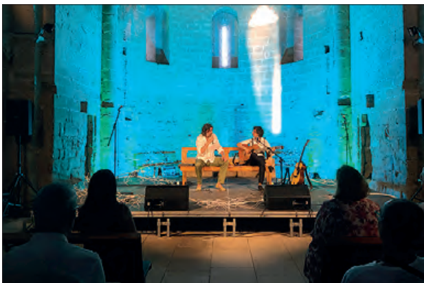
Imatge del tercer concert

La dotzena edició del cicle del Juliol de Música i Poesia clourà el pròxim diumenge, 23 de juliol, amb la proposta Música i paraules de Balaguer, amb la música dels germans Pla i la poesia de Josep Vallver-