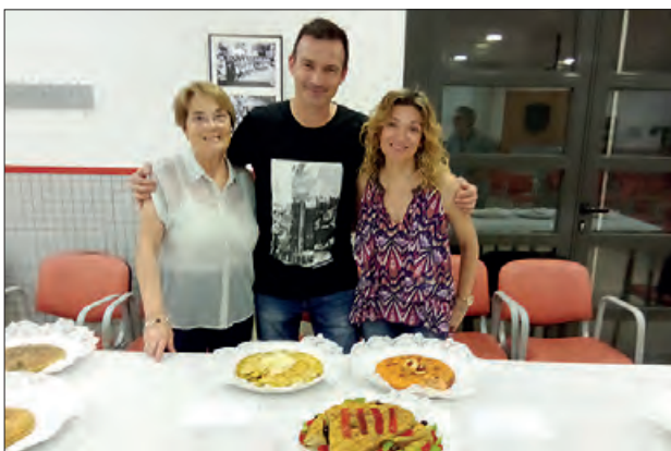
Jurat del concurs

El passat 8 de juliol, l’Associació Germanor de Camarasa, va organitzar un Sopar popular i el Primer Concurs de Truites.