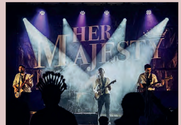
El Grup de versions Her Majesty

Diumenge 30, a partir de les 11 j taller de titelles i a les 12 h cercavila amb els gegants de la Ràpita. A les 13.30 h vermut popular. Per la tarda hi haurà animació infantil amb Lo Biel Pallaso a parit de les 18 h. El final de festa serà a partir de les 20 h amb sopar popular (reserva prèvia) i amenitzat pel quartet Banda Sonora.