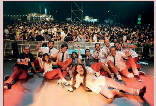
7dRock dissabte nit

Per la tarda es farà un taller a les piscines pels més petits i un ball de tarda i nit amb servei d'entrepans a la mitja part amb la música del grup Jalaysa, per acabar amb els actes de la festa major.