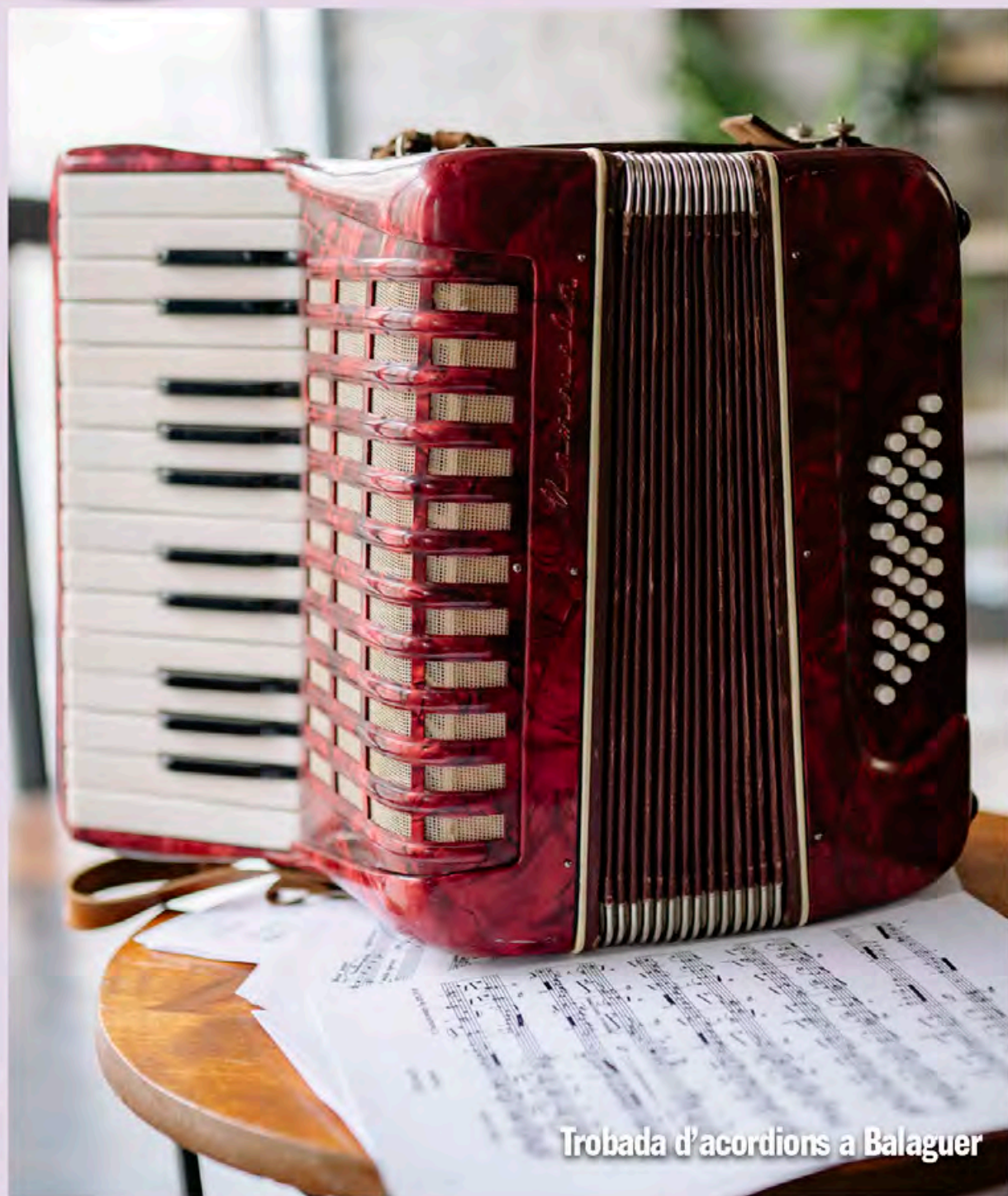
Trobada d'acordions a Balaguer

>> BALAGUER >> COMARCA >> CULTURA >> LECTURA >> ESPORTS >> OCI >> SERVEIS