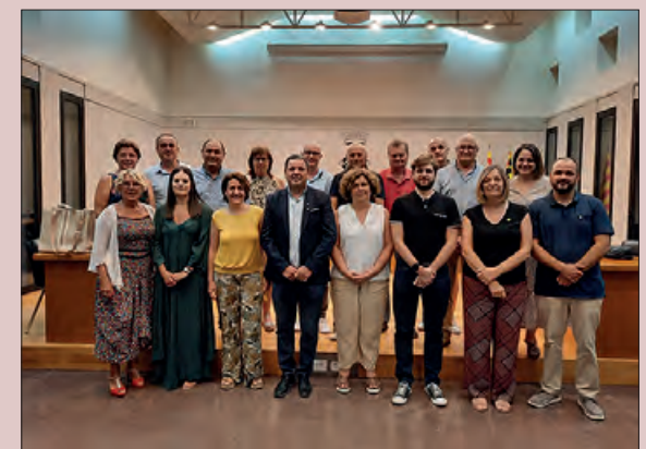
Els 19 membres del ple del Consell Comarcal

El proper dia 21 de juliol, es farà una sessió del Ple, anomenada del cartipàs, en què s’aprovarà la nova composició dels òrgans col·legiats i els òrgans unipersonals del Consell Comarcal, les àrees de treball i els consellers i les conselleres responsables de cadascuna d’elles.