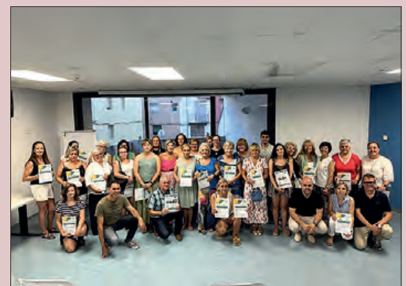
Entrega de premis

En el cas de Balaguer es fa una visita guiada pels principals atractius de la ciutat, es visita el Centre d'Interpretació de l'Or del Segre i, entre altres, es fa entrega d'un lot de productes de proximitat. A Balaguer la visita dels guanyadors es farà el proper 23 de setembre.