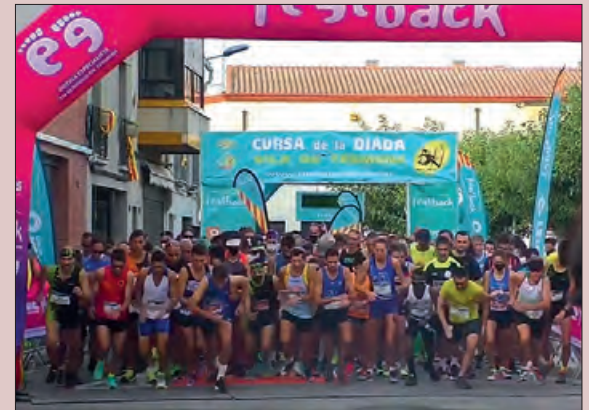
Cursa de l'any passat

La Cursa està organitzada per l'associació Acudit (Amics de la Cursa de la Diada de Tèrmens) amb la col·laboració de l'Ajuntament de Tèrmens.