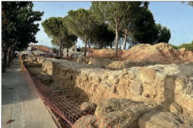
Explicacions de les troballes

L'excavació es va iniciar gràcies a una subvenció del Departament de Cultura de la Generalitat, qui mostrarà un gran interès pel projecte un cop conegudes les darreres dades, i ha aportat 40.000 € més per a la restauració de la muralla.