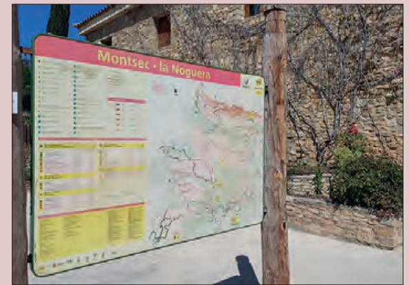
Una de les noves senyalitzacions

L'objectiu és oferir tant a turistes com a la gent del territori un producte turístic sostenible, responsable i de qualitat.