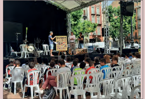
Imatge de l’any passat

La vuitena edició de l’Encontats, el Mercat del Conte i el Llibre Il·lustrat de Balaguer se celebrarà enguany del 20 al 24 de setembre.