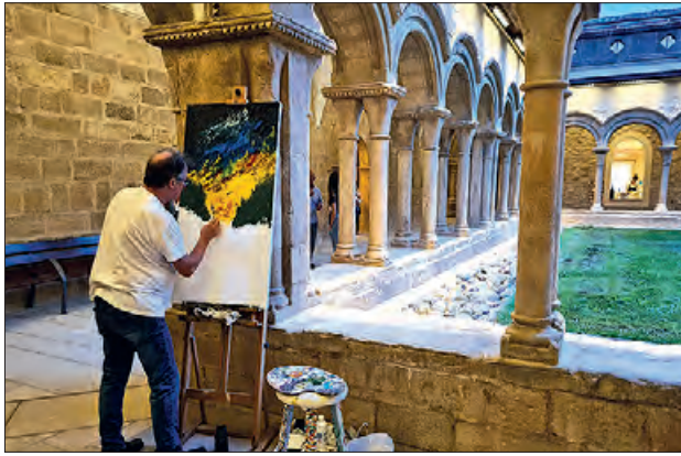
Un moment de la jornada

Més de 400 persones van assistir el passat dis- sabte 26 d'agost al vespre, al Monestir de les Avella- nes on es va celebrar la 1a Nit de l'Art. Un esdeveni- ment de nova creació que reunia més de 20 artistes