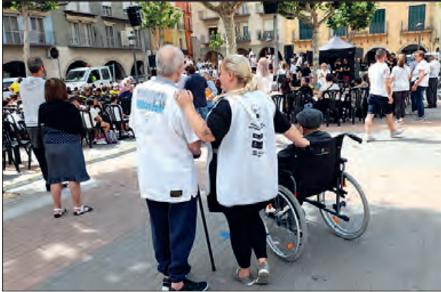
Servei d’acompanyament a la gent gran

Enguany, el Programa ‘De La Mà’ ha estat possible gràcies al Projecte Treball als Barris 2022 i el Programa de Treball i Formació 2022, finançats pel Servei d’Ocupació de Catalunya, la Generalitat de Catalunya i el Ministeri de Treball i d’Economia Social - SEPE. Gràcies a aquestes subvencions, l’equip ‘De La Mà’ s’ha configurat amb la contractació de vuit persones, de les quals sis són acompanyants, i dues fan la tasca de coordinació i vetllen per la planificació