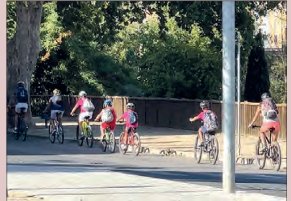
Participants al Tecnica Adventur

El 31 d'agost van finalitzar les estades esportives infantils promogudes des de l'Àrea d'Esports de la Paeria.