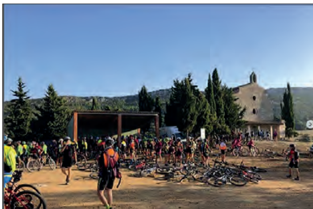
Avituallament a Cérvoles en una edició anterior

La Paeria de Balaguer presenta la marxa ciclista no competitiva 3Ermites que se celebrarà el proper 22 d’octubre, amb recorregut per les tres emblemàtiques ermites de la comarca com són Cérvoles, Montalegre i Sant Jordi. Ha estat l’àrea d’esports de la Paeria, ha estat l’encarregada de recuperar la marxa de BTT “ermitanyos”, organitzada antigament per el Club Ciclista Radical Esports, amb els