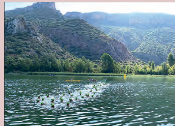
Un moment d'una edició passada

A diferència de les edicions anteriors, les primeres travessies a disputar-se seran la Panthathó de 7.000 metres i la de 3.200, que es disputaran alhora. Seguidament es farà la de 300 metres per als més petits i finalment la mitjana de 1.100 metres. Una aposta perquè hi pugui haver més gent. A mitjans de juliol es van obrir les inscripcions, al següent enllaç: https://forms.gle/2z9SWAuB8f-7bi2cC6