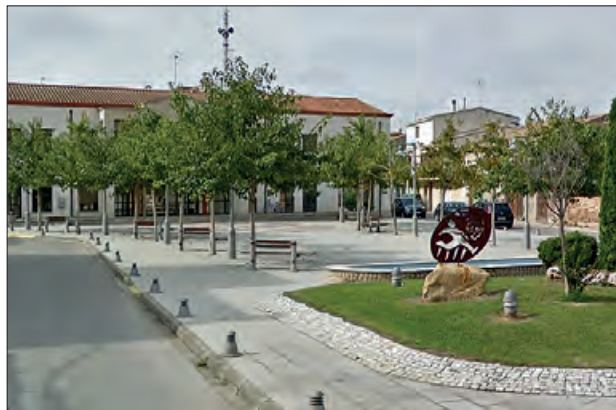
Vila de Tèrmens

El diumenge 10 de setembre dins dels actes de la festa major, al Centre Cultural Sant Joan se celebrarà una matinal familiar adreçada i dedicada a l'Àlbum Il·lustrat Vila de Tèrmens i a la literatura infantil i juvenil, amb un taller d'il·lustració. Lali Miró, guanyadora de l'any passat farà la presentació del seu treball. Aquest acte servirà també per donar el tret de sortida a la nova convocatòria.