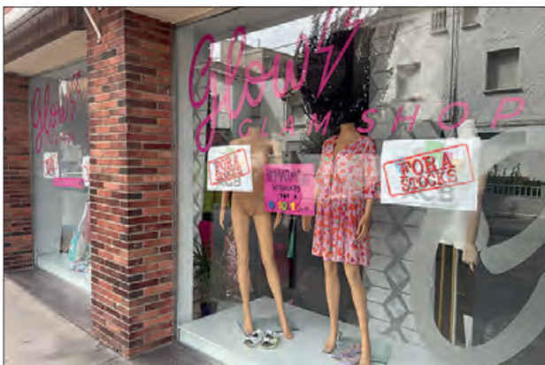
Campanya Fora Stocks

L'Associació de Comerciants ACB va posar en marxa els passats dies 30 i 31 d'agost i 1 i 2 de se-