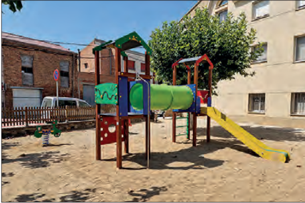
Millores al parc infantil de jocs

Tèrmens ha renovat parcialment el parc infantil de jocs de la vila degut al deteriorament que presentaven alguns dels seus aparells de joc, tot i que l'estiu passat ja es va fer una gran millora. Així, s'han instal·lat dues noves torres amb tobogan, dos models de molles diferents amb formes infantils i un balanci de 2 places. La intervenció ha tingut un cost de 5.399 €.