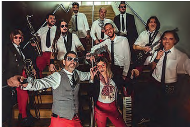
7D-Rock dissabte a la nit

Els següents dies es farà la 1a Fase del Campionat de Butifarra i la seva final, així com la 4a trobada de Col·leccionistes i Fira d'Artesans i una obra de teatre.