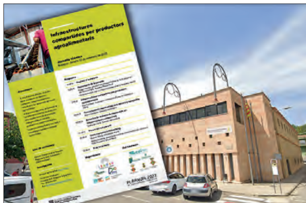
Cartell de la jornada al Consell Comarcal

El proper 12 de setembre, el Consorci GAL Noguera Segrià Nord organitza a la seu del Consell Comarcal la jornada tècnica "Infraestructures compartides per productors agroalimentaris, adreçada a productors agroalimentaris i a tothom que hi tingui interès. També s'hi farà una dinàmica de detecció de les necessitats en infraestructures compartides, i la clourà una visita i un networking al Molí d'Oli de Castelló.