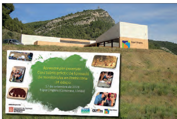
Espai orígens i castell del curs

L'Associació Recerca i Difusió del Patrimoni Històric (ARDPH) organitza, conjuntament amb el Centre d'Estudis del Patrimoni Arqueològic de la Universitat Autònoma de Barcelona (CEPARq-UAB), la 3a edició del curs Aprendre per ensenyar , de formació de monitors/es en Prehistòria, el dia 17 de setembre al Centre Espai Orígens de Camarasa. El curs és gratuït, amb inscripció prèvia i s'ofereix formar part d'una borsa de monitors/es.