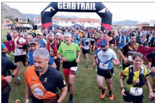
Un moment de l'any passat

El dissabte 7 d'octubre torna la cursa de muntanya Gerbtrail, prova puntuable per a la Lliga de la Noguera, que comptarà amb dos recorreguts per triar: un d'uns 24km i més de 1.100 metres de desnivell positiu, i un altre més encarat a caminadores i caminadors, d'uns 10km i 450 de desnivell.