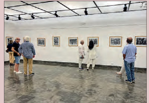
Un moment de la inauguració

Des del dia 2 i fins al 24 de setembre es pot veure a la sala l'Estudi 76 de la casa de la Paeria de Balaguer la mostra fotogràfica Black Àfrica. Tribus d'Etiòpia, de Pep Astudillo.