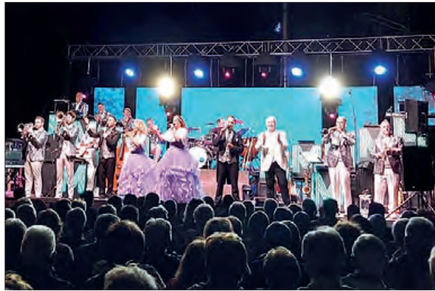
Orquestra Maravella diumenge tarda

Dissabte durant tot el dia es podrà gaudir d'una jornada de inflables terrestres i aquàtics, futbolí humà, circuit de patinets elèctrics i mini cotxes... en horari de matí i tarda. També el AE Tèrmens jugarà el seu primer partit de lliga contra l'Alcarràs. Per la nit, un sopar popular amb con-