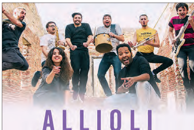
El grup Alliolí per la nit jove de dissabte

El dissabte es farà el concurs infantil de pintura ràpida així com el torneig local de partides ràpides d'escacs al allar de jubilats. La Biblioteca serà la seu d'un tast de vins de Ponent i maridatge de productes de proximitat. Per la tarda, alguns carrers de