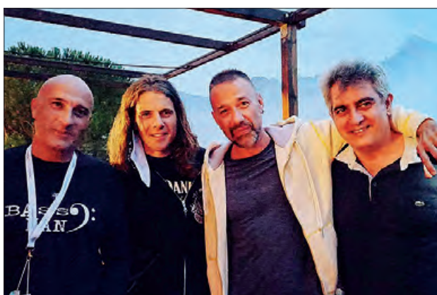
Malparits Tribut a Sopa de Cabra

Diumenge una missa solemne i cucanyes per a petits i grans i també concurs de bitlles. Per la tarda Joan Pera representarà l'obra de teatre "Capri" (cal treure les entrades). Un espectacle pirotècnic serà l'acte de cloenda pel fi de festa de la festa major de Sant Miquel de la Sentiu.