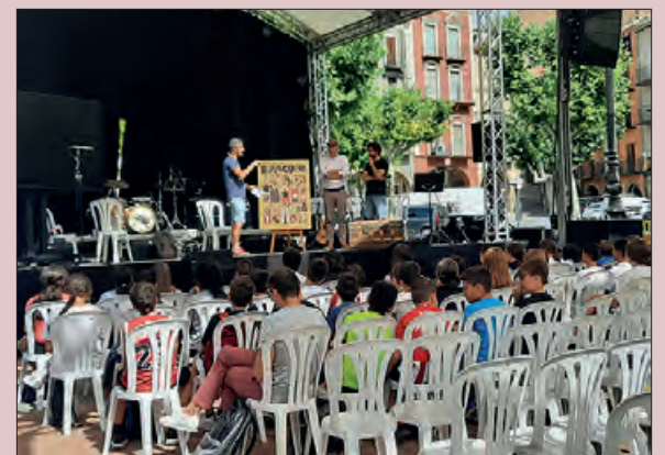
Imatge de l'any passat

L'endemà, diumenge dia 24, tindrà lloc la gran festa familiar al voltant del món dels contes, amb una la presència de parades d'editorials, llibreries especialitzades en la publicació de literatura infantil, il·lustradors i artesans diferents espectacles.