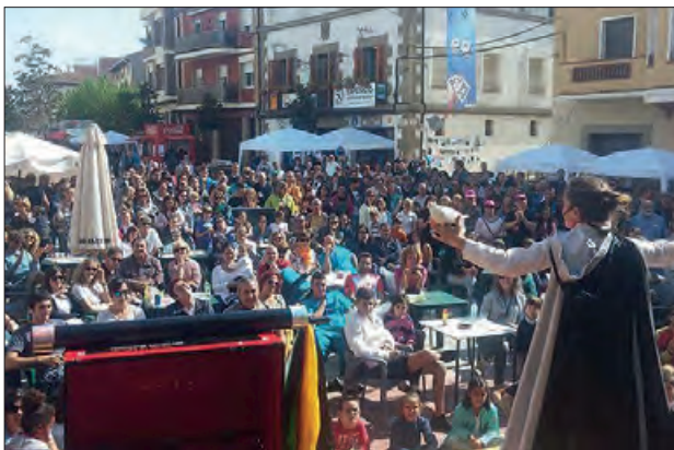
Un moment de l'any passat