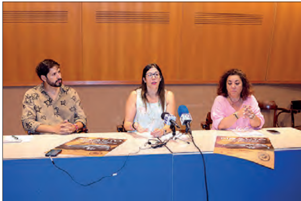
Presentació de Firauto

El certamen és pioner a les terres de Lleida i hi participaran 18 expositors que presentaran els seus vehicles, tots ells supervisats i revisats, amb un gran ventall d'opcions, des de les més econòmiques, que es podran trobar al Mercat de la Ganga, amb vehicles