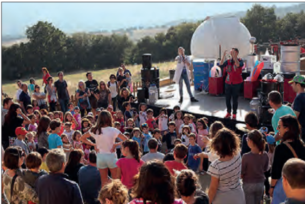
Un moment de l'edició anterior

La novena edició del Festival d'Astronomia del Montsec, un esdeveniment que es durà a terme de l'11 al 15 d'octubre i que commemorarà el centenari del naixement de Joan Oró, el gran impulsor