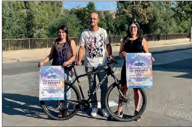
Presentació de la prova 3Ermites

L'Àrea d'Esports de la Paeria de Balaguer ha organitzat el monogràfic de BTT 3Ermites, amb un recorregut que circularà per les principals ermites de la comarca, com són la de Cérvoles, situada al terme municipal d'Ós de Balaguer; l'ermita de la Mare de Déu de Montalegre, a Vilanova de la Sal i que pertany al terme de les Avellanès i Santa Linya; i l'ermita de Sant Jordi, del terme municipal de Camarasa. Les 3Ermites parteix de l'Ermitanyos, una prova de BTT que tenia una gran èxit i que no va poder arri-