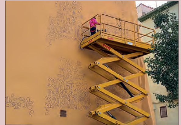
El mural mentre s'estava fent