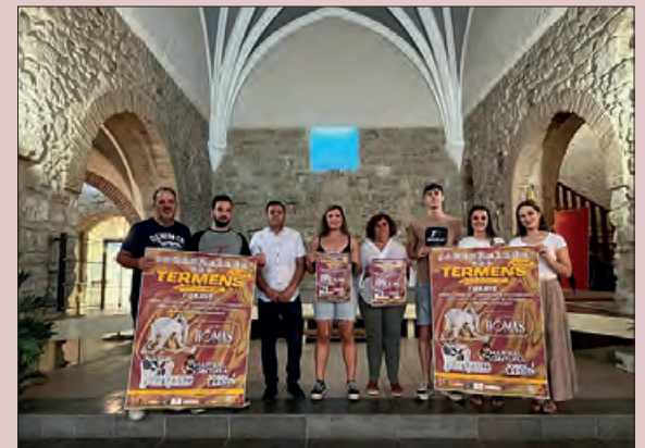
Presentació de la Comarkalada a Tèrmens

El programa d'actes preveu a part de la Fira, un vermut popular, espectacles de carrer, una gimcana jove, concursos, entre d'altres.