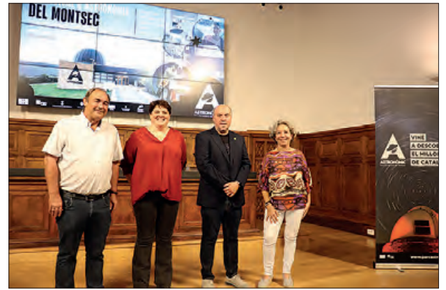
Presentació del Festival

Com a novetat, una de les activitats es farà a la Col·legiata serà el concert de cloenda, el diumenge 15 a les 19.00 hores, en què l'Orquestra Simfònica Julià Carbonell de les Terres de Lleida, dirigida per Alfons Reverté, oferirà