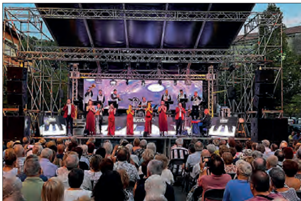
Orquestra Venus dissabte

Actualment combina els seus estudis de Traducció i Interpretació amb el desenvolupament de la que serà la seva segona novel·la, sota el nom de #proyectoFlores.