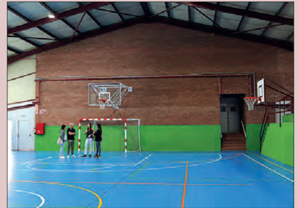
Pista esportiva de l'Escola Pia

Entre les millores que s'han dut a terme hi ha la substitució de l'encallament de la pista per tecnologia LED, la renovació del paviment i el repintat de les línies de les quatre disciplines esportives que s'hi practicaràn. Igualment, també s'han protegit les bigues laterals com a mesura de prevenció.