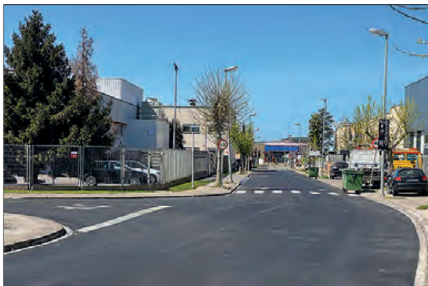
Polígon de Balaguer

La Paeria de Balaguer ha iniciat les gestions per poder crear una Àrea de Promoció Econòmica Urbana (APEU) al polígon industrial Campllong, amb la intenció d'impulsar l'associacionisme entre les em-