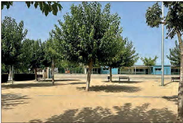
Zona on s'ubicarà el parc infantil

Després de mantenir una reunió amb l'equip directiu del centre i representants de l'AFA, i d'acord amb els seus suggeriments,