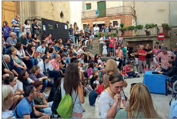
Actuació de la passada edició

Divendres amb la sessió de màgia solidària adreçada a persones amb discapacitat, que s'organitza conjuntament amb la federació ALLEM i a la qual assistiran unes 180 persones i monitors d'una desena de