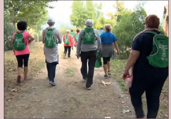
Marxa de l'any passat

El proper 8 d'octubre, la Junta Local de Balaguer convida a caminar un any més, per la IV edició de Balaguer en Marxa Contra el Càncer.