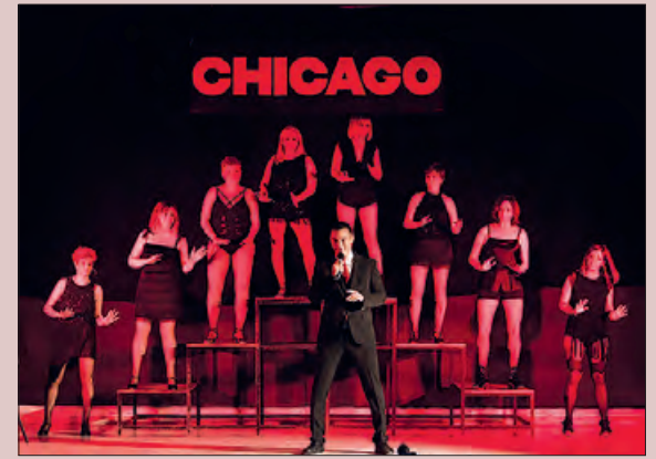
"Chicago" el proper 1 d'octubre

El proper diumenge 1 d'octubre a les 18 h s'estrenarà l'obra musical "Chicago" interpretat per tretze actors i actrius de l'Associació Entr'Acte de Balaguer.