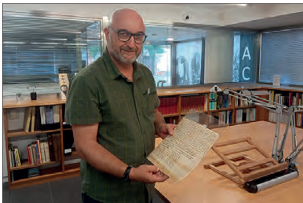
Donació del pergami

L'Arxiu Comarcal de la Noguera ha rebut un pergami sobre la venda de molins de Balaguer de l'any 1211.