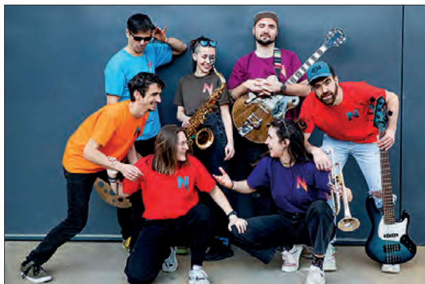
Grup de versions Mitjanit

Abans però, al mati, es farà una missa en honor al patró acompanyada de la Coral Vallfogonina. Al mati també es farà la inauguració de l'exposició "Memòries de Vallfogona" dedicat als casaments. Per la tarda els més petits podran gaudir de l'espectacle