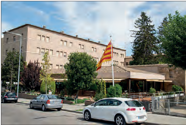
Residència Sant Domènec

Finalment, per a tots els assistents s'oferirà un aperitiu a la plaça de Sant Domènec, amenitzat del grup Ksonronda. A més, els residents gaudiran d'un dinar especial de celebració amb un pastís d'aniversari.