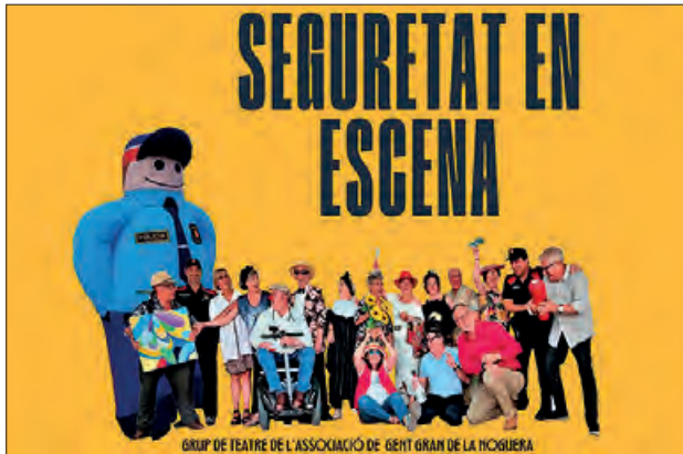
Cartell de l'obra "Seguretat en escena"

El proper divendres 29 de setembre, el teatre municipal de Balaguer acollirà a les 18 h de la tarda, l'obra "Seguretat en escena", una obra organitzada per la Paeria de Balaguer amb la col·laboració dels Mossos d'Esquadra de La Noguera i de l'Associació de Gent Gran de Balaguer.