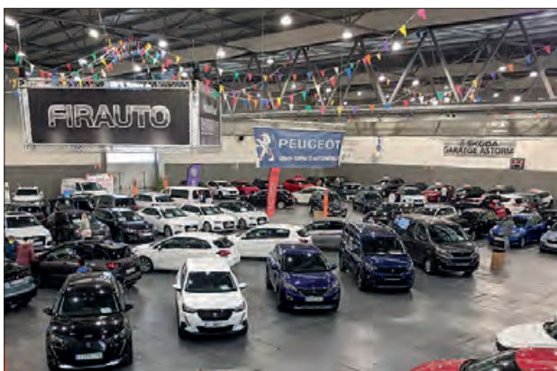
Una edició anterior