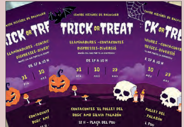
Un moment del concert

Ja fa uns anys que l'Associació de Comerciants del Centre Històric prepara diferents activitats per a que els més menuts, puguin gaudir de la Castanyada, amb actes divertits.