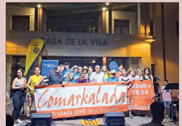
Comarkalada a Tèrmens