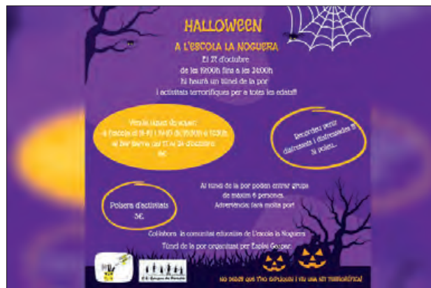
Cartell de la festa de Halloween

Des de les 19 h fins a les 12h de la matinada, es faran activitats terrorífiques, comprant una pulsera per 3 euros, es podrà participar a les diferents activitats organitzades. L'activitat estrella és un túnel de la por, organitzat per l'Espai Gaspar de Portolà,