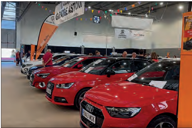
Un moment de la fira

Firauto va tancar les portes de la seva 31a edició, amb un total de 18 expositors, que presentaven uns 200 vehicles, tots ells