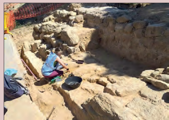
Imatge de la troballa d'aquest estiu

Al llarg de tots aquests anys les Jornades Europees de Patrimoni han permès conèixer la riquesa i la diversitat del patrimoni cultural, gràcies a la col·laboració de centenars de municipis, museus, monuments, associacions i entitats culturals d'arreu del territori, que any rere any han aprofitat el seu patrimoni cultural a la ciutadania.