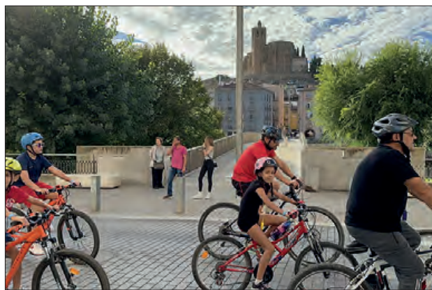
Festa de la bicicleta d'una edició anterior

S'han plantejat dos rutes, una primera ruta per a tots els públics pels vials més amples de la ciutat i una segona per a nens i ne-