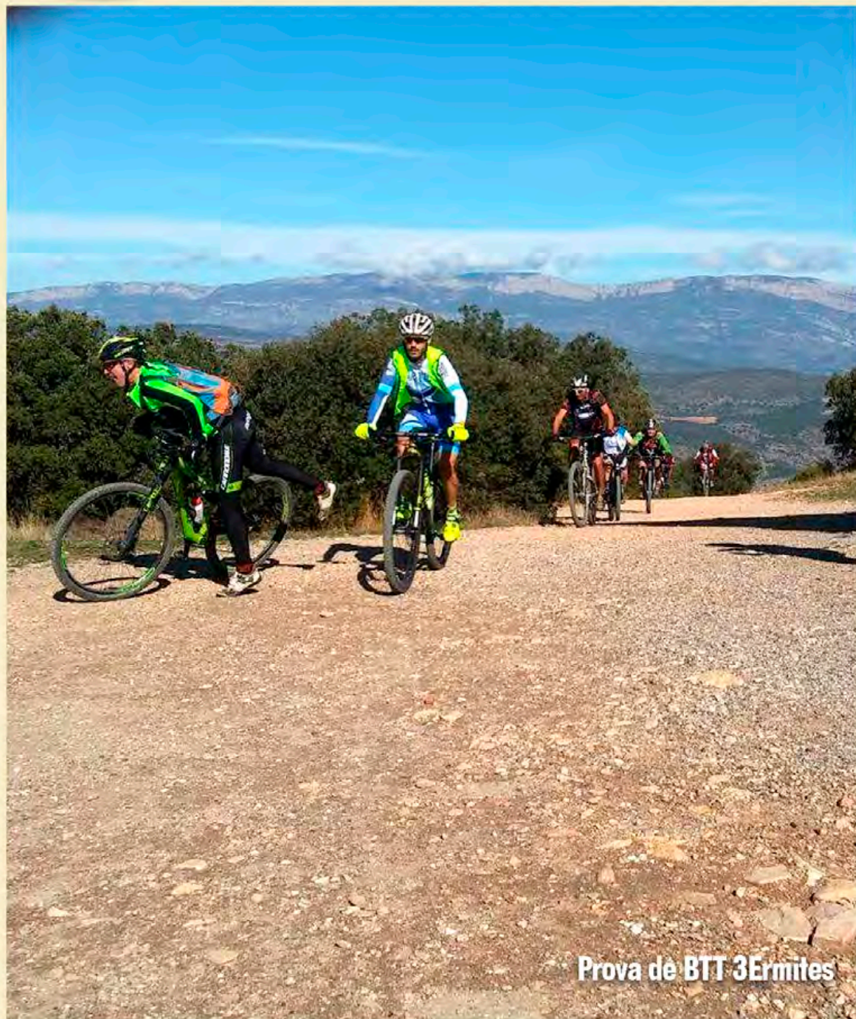
Prova de BTT 3Ermites