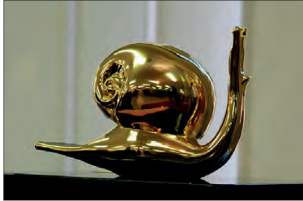
El Cargol d'Or

Robert Martínez és actualment el seleccionador de la Selecció de futbol de Portugal