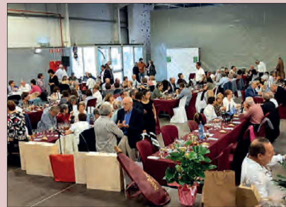
Un moment del dinar

L'Associació Contra el Càncer és l'entitat de referència en la lluita contra el càncer des de fa 68 anys. Dedicar els seus esforços a mostrar la realitat del càncer a Espanya. En 2022, l'Associació Contra el Càncer a Lleida ha atès a 1.383 persones entre pacients i familiars; té més de 103 delegacions i juntes locals i compta amb més de 800 voluntaris i 5.200 socis. A part ofereix diferents serveis tant a pacients com també als familiars.