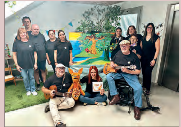
Participants en el conta-contes

Des del Servei de Rehabilitació Comunitària de Balaguer s'ha organitzat una activitat de conta-contes, per tal de sensibilitzar l'alumnat dels centres educatius de la ciutat sobre qüestions relatives a la salut mental, per infants de 5 a 9 anys. Pel conte s'han realitzat un mural, una cançó i titelles per fer-ho més agradable de cara als infants que ho treballaran previamente a classe i així fer l'activitat més interactiva.