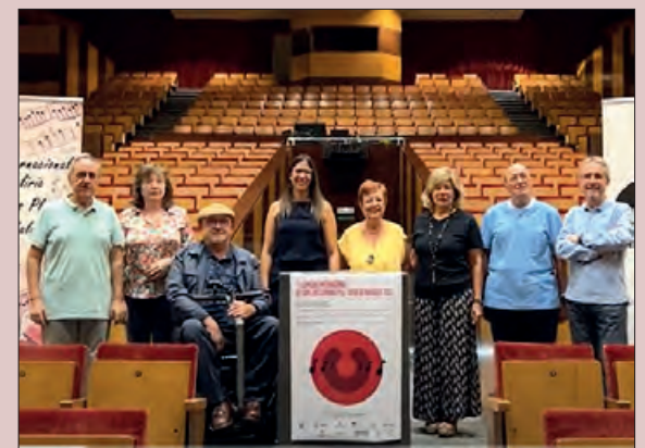
Presentació del concurs