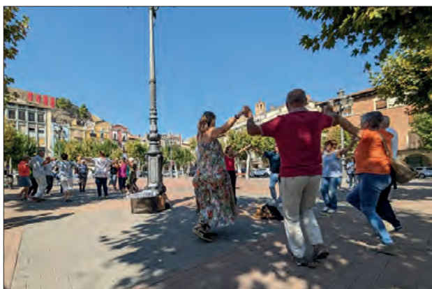
Un moment de la jornada

Balaguer va celebrar el passat diumenge 8 d'octubre la festivitat de la Mare de Déu del Miracle amb la cobla Reus Jove, en un ver-