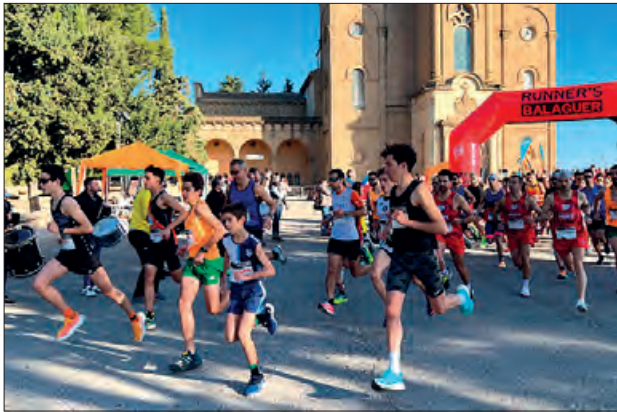
Cursa del Sant Crist 2022

El Runner's Balaguer, club organitzador de la Cursa del Sant Crist, ja té les inscripcions obertes des de finals de setembre. Enguany la cita esportiva de la festa major, serà el 12 de novembre, se celebrarà la 42a edició, amb un nou recorregut completament pla i amb sortida i arribada al Molí de l'Esquerrà.