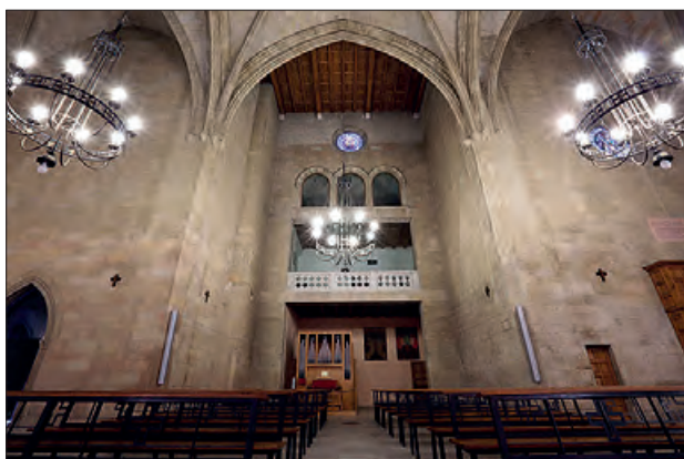
Orgue del Monestir de les Avellanes

El passat diumenge 8 d'octubre, el Monestir de les Avellanes va acollir el 9è concert d'Orgue de tubs del monestir dins del 25è Festival d'Orgues de Ponent i del Pirineu. El del Monestir de les Avellanes