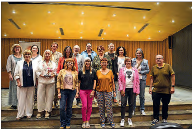
Un moment de l'acte

Aquest dissabte dia 14 de la sala d'actes de la Paeria de Balaguer va acollir la Trobada dels clubs de lectura de les biblioteques adherides a l'Any Vallverdú a les biblioteques de Lleida, i del club de lectura virtual Josep Vallverdú: un segle de compromís i acció.