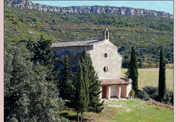
Cérvoles una de les ermites de la prova

Aquest diumenge 22 d'octubre, se celebrarà la primera edició de la '3ermite', el monogràfic BTT de la Noguera, una cursa de caire no competitiu, organitzada per la Paeria d'Esports de Balaguer.