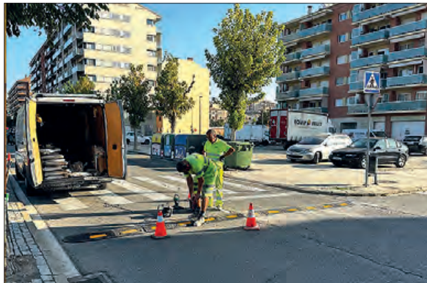
Instal·lació de ressalts

Els carrers en els quals s'instal·laran aquestes bandes rugoses són carrer Tàrrrega, carrer del Pont, passeig de l'Estació, avinguda Països Catalans, carrer Girona, carretera de Castelló, carrer Molí del Comte, carrer Marta Mata a la zona de l'escola Montroig, i a la zona propera al