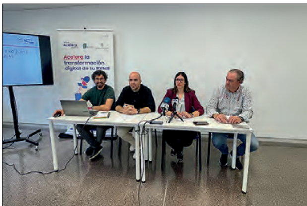
Un moment de la presentació

La Paeria de Balaguer i la Diputació de Lleida presenten l'Oficina 'Accelera Pime' Rural, que està situada al CEI Balaguer i dona servei a tota la comarca. Serveix per donar suport i assessorament a pimes i autònoms, especialment de zones rurals, els quals hi trobaran serveis d'ajuda i suport en els processos de transformació digital empresarial, amb l'objectiu de modernitzar els negocis.