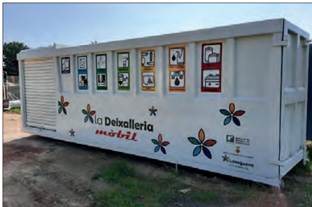
Contenedor de deixalleria mòbil

Aquest 2024 el Consell Comarcal de la Noguera tornarà a prestar el Servei de Deixalleria Mòbil als diferents municipis de la comarca que ho sol·licitin.