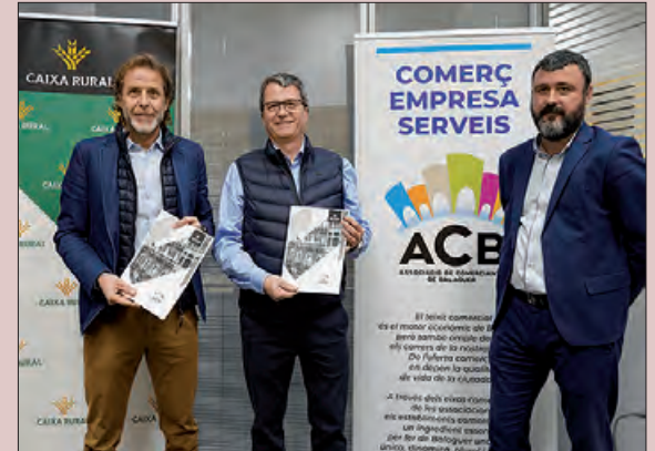
Signatura de l'acord

Caixa Rural i l'Associació de Comerciants de Balaguer (ACB) van signar un acord de col·laboració amb l'objectiu de donar suport i impulsar al teixit comercial de Balaguer.