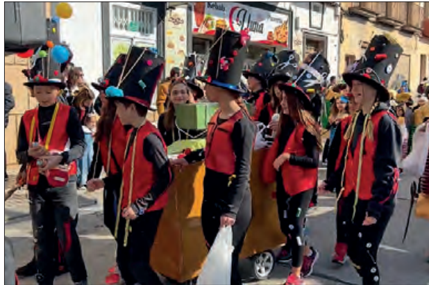
Rua infantil diumenge matí

Després, a partir de les sis de la tarda i fins les nou del vespre, se celebrarà un ball de disfresses jove al pavelló del Molí de l'Esquerrà. En aquest actuaran els dj's Edgar Manchado i Hector Ortega de Flash FM, i comptarà amb concursos, animació, premis