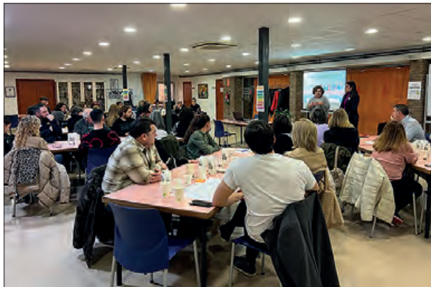
Un moment de la jornada

Es va treballar en una dinàmica participativa sobre les necessitats del Centre Històric i propostes d'acció, millores i sinergies.