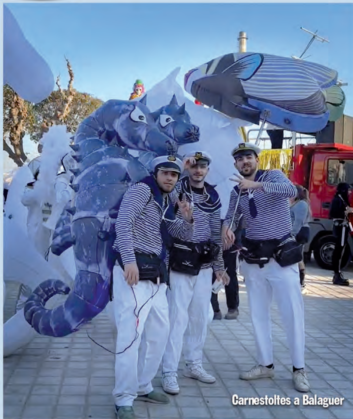
Garnestoltes a Balaguer