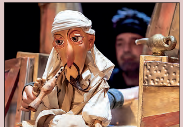
L'últim espectacle al Teatre "La llàntia meravellosa"

La darrera de les propostes serà 'La llàntia meravellosa' de Festuc Teatre es podrà veure el diumenge dia 3 de març a les 12 h al Teatre municipal. En aquest espectacle, el geni de la llàntia meravellosa és capaç de concedir riquesa, bellesa, poder o fama, però es troba algú que no anhela cap d'aquestes coses. A través dels diferents personatges, descobrirem la importància de l'acceptació i l'amor.