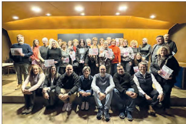
Entrega dels vals

El sorteig es va fer el divendres dia 12 i aquest passat 19 de gener es va fer entrega als guanyadors dels vals