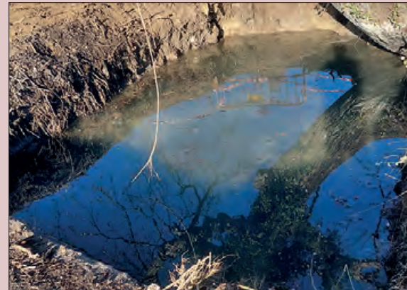
Zona de la bassa que s'ha trobat a Àger