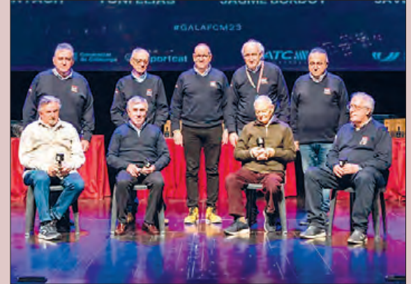
Un moment de l'acte

El Teatre municipal de Balaguer va acollir el passat dissabte 20 de gener la gala de lliurament de premis dels Campionats de Catalunya de Motociclisme, acte organitzat per la Federació Catalana de Motociclisme.