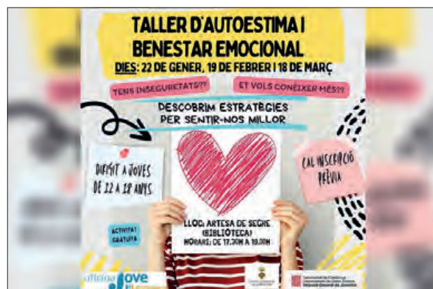
Cartell de l'activitat

El taller treballarà la idea que tenim de nosaltres mateixos/es i com aquesta idea està relacionada amb l'autoestima. S'hi abor-