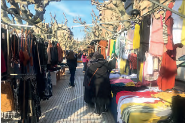
Mercat de les rebaixes d'hivern

Una part del Passeig de l'Estació, més concretament, des de la Plaça de la Sardana, fins a l'estàtua de