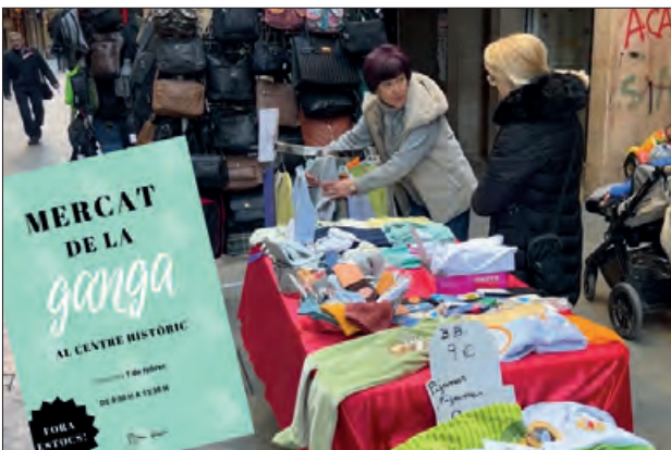
Mercat de la Ganga al Centre Històric

El proper dimecres 7 de febrer, els comerciants del Centre Històric, organitzen el Mercat de la Ganga, oferint grans descomptes, per poder acabar l'estoc en productes d'hivern i donar pas als productes nous i de nova temporada.