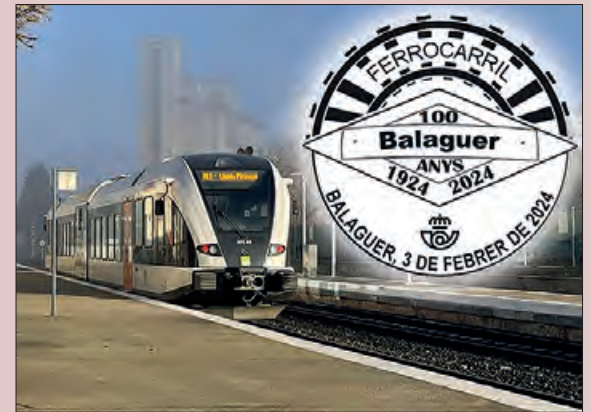
Mata-segells dels 100 anys de tren a Balaguer

El proper 3 de febrer al vestíbul de l'Estació de trens de Balaguer, es podrà veure aquest mata-segells commemoratiu de 10 a 13 hores. A partir de llavors ja es podrà comprar des de l'Oficina de Correus.