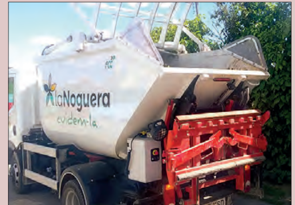
Camió de recollida de fracció verda

S'hi han adherit Albesa, Algerri i Castelló, i són en total 18 els municipis que gaudeixen del servei. Per mantenir l'eficiència del servei, s'han distribuït els pobles en dos rutes de recollida, una en dimecres i l'altra en divendres.