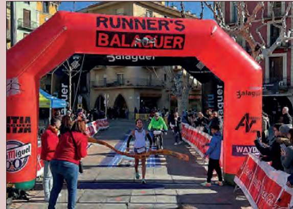
Imatge de l'any passat

El proper 18 de febrer es celebrarà a Balaguer la Mitja Marató Ciutat de Balaguer.