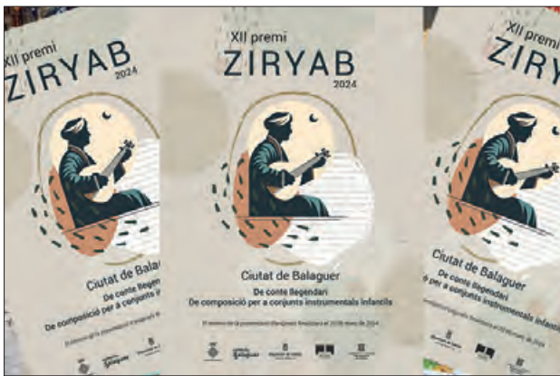
Cartell dels Premis Ziryab d'enguany

El veredictes es donarà a conèixer durant els actes de la Nit de la Cultura, el dissabte dia 20 d'abril. Pel que fa als premis, l'obra guanyadora rebrà 600€ i un accèssit de 200€; i la composició instrumental 1.000€ i un accèssit de 200€.