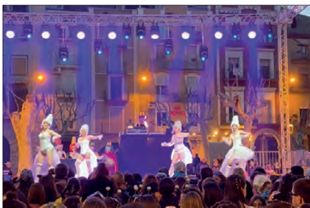
Concurs de disfresses a la Plaça l'any passat