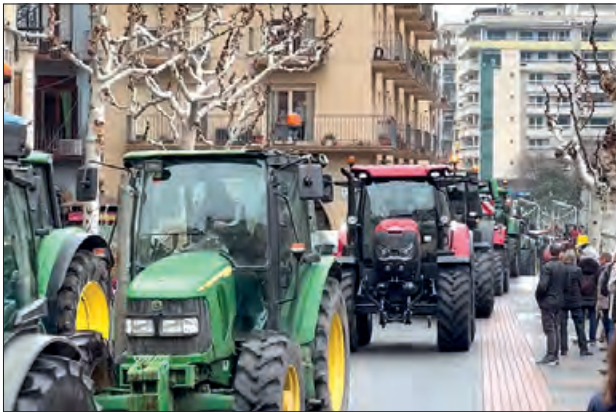
Tres tombs 2024

El passat dimecres 17 de gener es van celebrar a Balaguer els tradicionals Tres Tombs de Sant Antoni Abat. Els actes comencen amb el repic de campanes a les set del matí, i tot seguit la cerimònia de benedicció dels panets de Sant Antoni a l'església de Sant Josep. A les 11 h es va fer una missa solemne amb l'as-