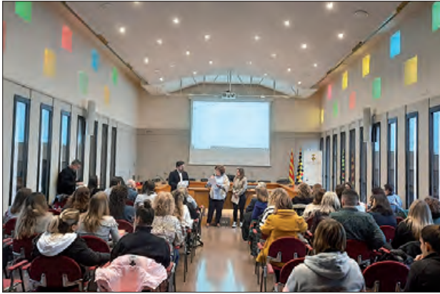
Presentació al Consell Comarcal de la Noguera

El passat 26 de gener, va tenir lloc al Consell Comarcal de la Noguera la jornada tècnica sobre "Atenció Integrada Social i Sanitària. Bones pràctiques a la Noguera".