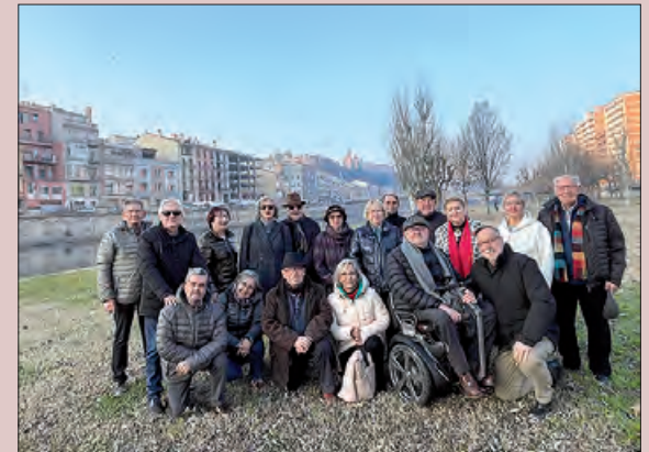
Integrants de la nova associació