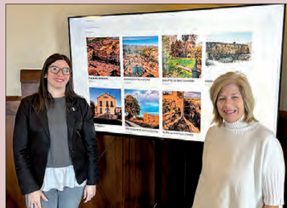
Presentació dels espais escollits de Balaguer

Les tasques que du a terme la CFC són donar assistència als productors interessats en rodar a Catalunya; facilitar informació a les productores sobre com rodar en qualsevol punt de la geografia catalana; mitjançar entre les produccions i els diferents ens de gestió i titulars d'espais supramunicipals; ajudar els productors internacionals en la cerca de coproductors locals; donar suport en la gestió i centralització del coneixement sobre l'activitat cinematogràfica; informar sobre les possibilitats de finançament i beneficis fiscals; construir i coordinar una xarxa territorial de film offices a Catalunya; assessorar els municipis en la tramitació i gestió de permisos i tiques, entre moltes altres.