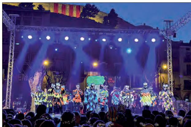
Concurs de disfresses dissabte a la tarda