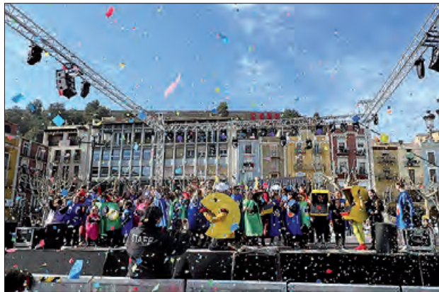
Participants de la rua infantil diumenge matí

Després, a partir de les sis de la tarda i fins les nou del vespre, se celebrarà un ball de disfresses jove al pavelló del Molí de l'Esquerrà. En aquest actuaran els dj's Edgar Manchado i Hector Ortega de Flash FM, i comptarà amb concursos, animació, premis i moltes sorpreses més. L'entrada serà gratuïta. Aquesta activitat substitueix la rua jove i pretén