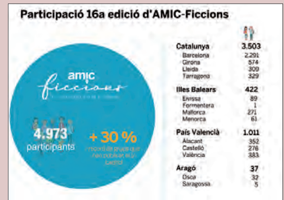
Gràfic de participació

El concurs literari "AMIC-Ficcions, l'aventura de crear històries" ha tancat les seves dades de participació de la 16a edició amb un total de 4.973 alumnes registrats provinents de 309 centres educatius de Catalunya, Illes Balears, País Valencià i Aragó.