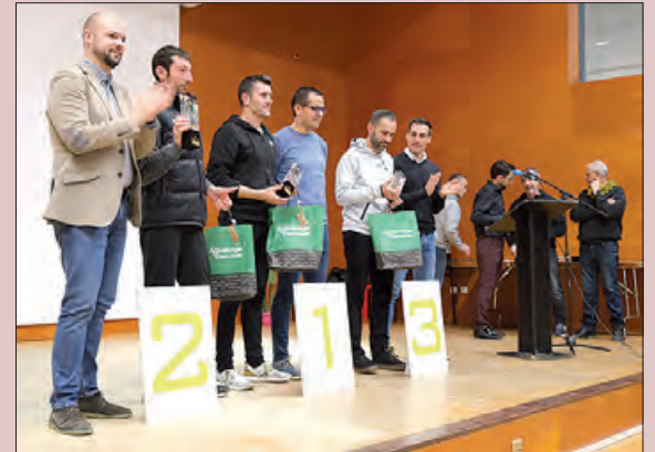
Premiats en la categoria absoluta masculina

El passat divendres 26 de gener es va celebrar al centre Cívic de Balàfia la gala anual de les Mitges de Ponent en la que es van guardonar els guanyadors de les diferents categories de les Mitges Maratons de Ponent de l'any 2023.