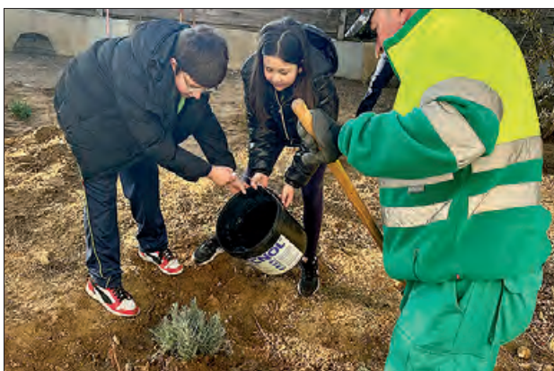
Plantada d'arbres al carrer Franqueses

Des de principis de febrer, l'alumnat de 4rt curs d'Educació Primària dels centres educatius de la ciutat, han participat de la campanya 'Reforestem els espais naturals de Balaguer', al carrer de les Franqueses.