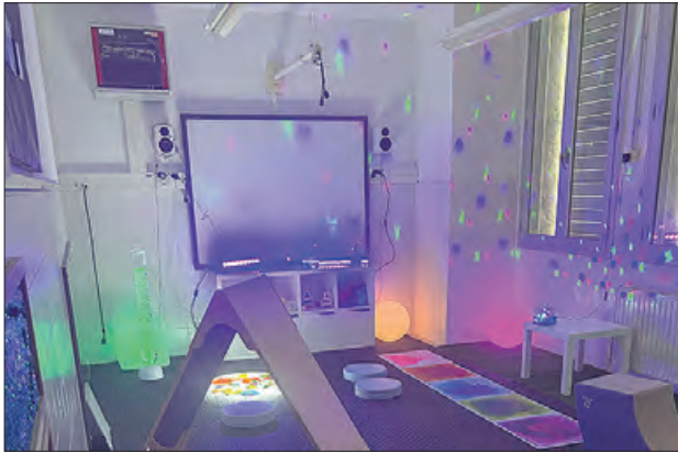
Aula Snoezelen de l'Escola Àngel Guimerà

El passat 31 de gener, l'escola Àngel Guimerà de Balaguer va inaugurar un nou espai educatiu al centre, l'aula Snoezelen.