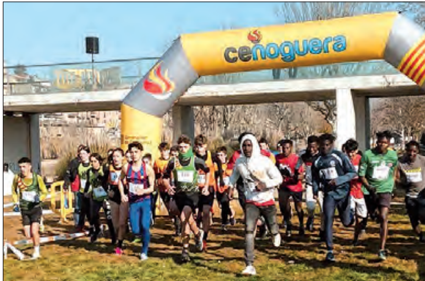
Imatge del Cros de l'any passat

El Consell Esportiu de la Noguera, amb la col·laboració de la Paeria de Balaguer i del Club Atlètic Maratonians del Segre, organitzen el IX Cros de Balaguer, prova de la fase Intercomarcal de cros dels JEEC i del Circuit Escolar de Cros Esportius de les terres de Lleida, el qual tindrà lloc el 25 de febrer, al marge esquerra del riu Segre. Els participants van des dels nascuts al 2021 fins a veterans.