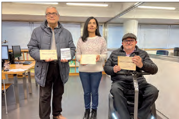
Un moment del lliurament

tres manifestacions culturals; promoure la creació artística i la seva exhibició, tant d'espectacles propis com d'altres autors; oferir formació artística no reglada als associats; i establir sinèrgies entre el sector públic i privat per poder col·laborar-hi.