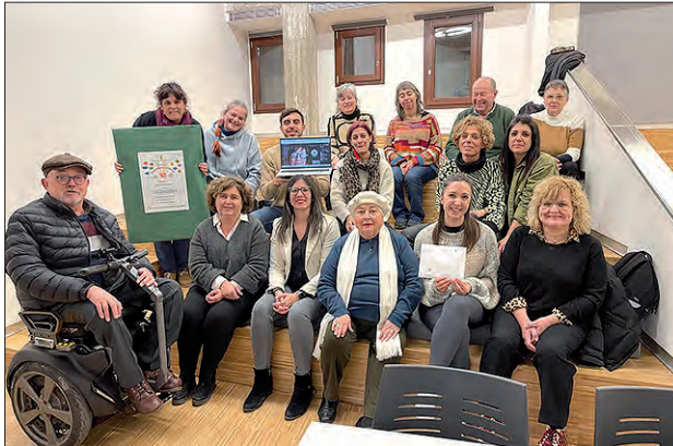
Lliurament de premis

El passat 5 de febrer va tenir lloc el lliurament del premi del Concurs de Suggeriments Solidaris 2023 organitzat per la Taula d'Entitats de Balaguer. Aquesta edició el projecte guanyador va ser "TEA Accessible" de l'Associació l'Estel de Balaguer. En el decurs del proper Dinar Comunitari s'explicarà tot el projecte i es votarà el projecte guanyador del Concurs de Suggeriments Solidaris 2024.