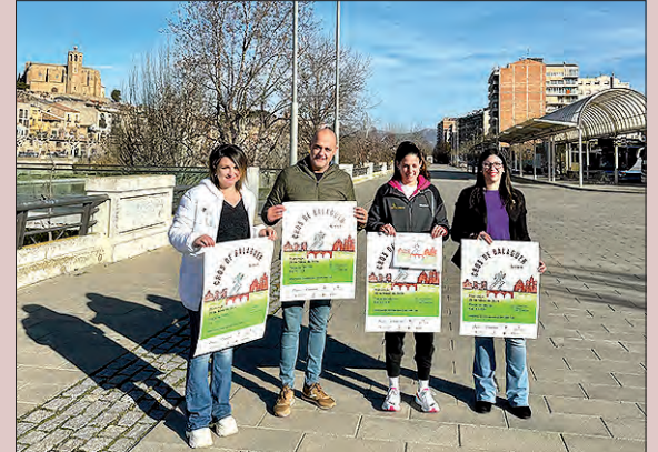
Premiats en la categoria absoluta masculina

El proper dissabte dia 25 de febrer la ciutat de Balaguer acollirà una nova edició del Cros Intercomarcal, organitzat pel Consell Esportiu de la Noguera i amb la col·laboració de la Paeria, el Consell Comarcal i el Club Atlètic Maratonians del Segre.