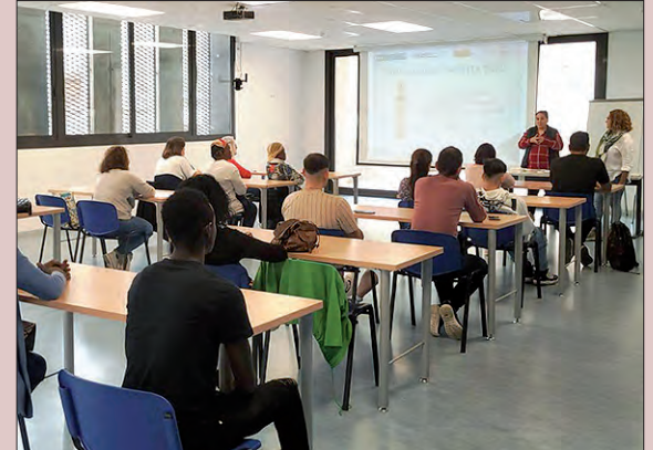
Programa d'orientació laboral

La Paeria de Balaguer ha iniciat la segona edició del Programa SOC-Orienta, subvencionat pel Servei Públic d'Ocupació de Catalunya i pel Servicio Público de Empleo Estatal del Ministerio de Empleo y Seguridad Social.