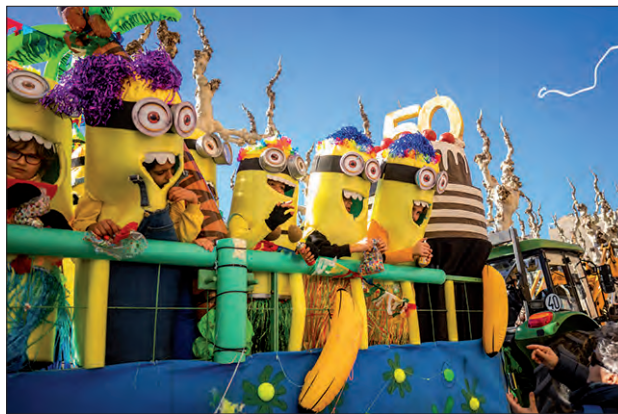
Rua infantil del diumenge al matí

La festa va continuar a la tarda amb un ball de disfresses jove al pavelló del Molí de l'Esquerrà, que era la principal novetat, substitutiu de la rua del dissabte a la tarda. A la nit, al mateix pavelló, va tenir lloc el Concert de Nit amb els grups de versions locals Ella i Jet Lag i les sessions dels