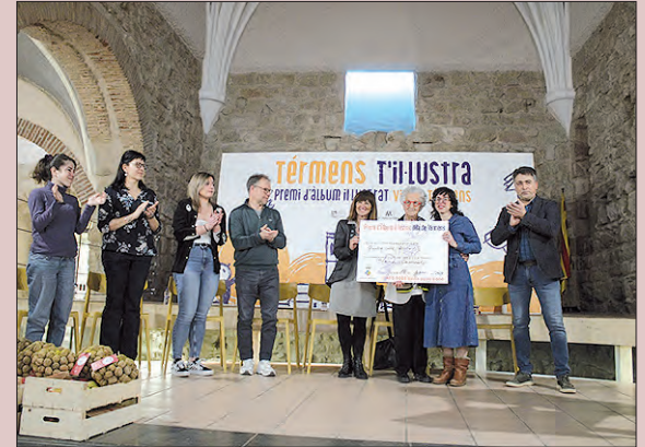
Premi Àlbum Il·lustrat Vila de Térmens

El passat diumenge 18 de febrer, al Centre Cultural Sant Joan de Térmens, es va fer l'acte d'entrega del 5è Premi d'Àlbum Il·lustrat Vila de Térmens.