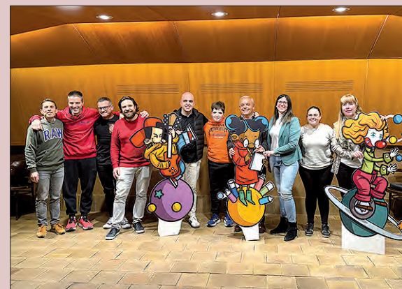
Presentació de la Fira dels Somnis 2024

Cal destacar la implicació del món associatiu, empresarial i comercial que ompliran la Barana de la Generositat amb a prop d'un centenar de pancartes i la venda de samarretes per recaptar diners per una causa tan important.