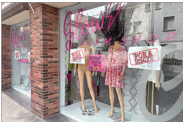
Campanya Fora Estocs de l'estiu

L'Associació de Comerciants ACB posa en marxa els propers dies 29 de febrer, 1 i 2 de març, la campanya "Fora Stocks", on més de vint establiments associats posaran unes parades davant dels seus comerços amb els productes de final de temporada a preus d'escàndol per poder treure les peces de la temporada.