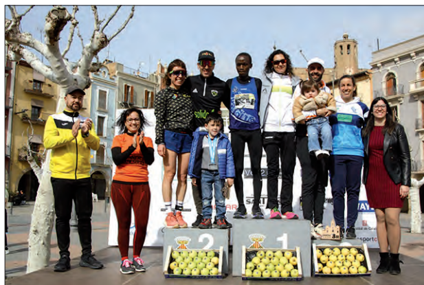
Podi de la Aldahra Mitja Marató de Balaguer

En els 10 kilòmetres, el podi masculí va ser Reyes