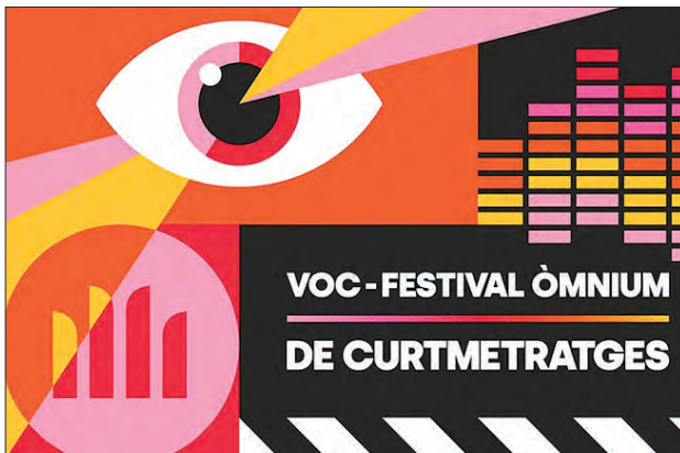
Imatge del Festival

A Balaguer es fan dues sessions. Aquest dimarts se n'ha fet la primera i n'hi haurà una segona el proper dimarts dia 27 de febrer. Per assistir a aquestes sessions, tot i que l'entrada és gratuïta, cal inscriure's a la pàgina web d'Òmnium, dins de l'apartat de projectes.