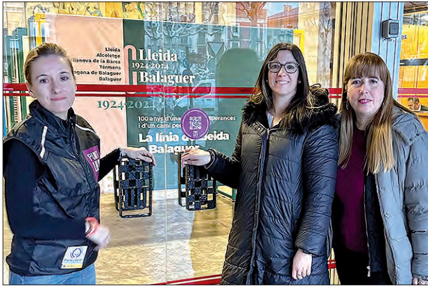
Enganxina del codi QR a la Paeria

Des de principis de febrer, els equipaments municipals de Balaguer compten amb un codi QR, el qual dona accés a la 'Guia de recursos de prevenció, atenció i reparació de les violències masclistes a la ciutat de Balaguer'. L'objectiu és facilitar l'accés a qualsevol persona que necessiti informació entorn als recursos disponibles vinculats a la prevenció, l'atenció i la reparació de les violències