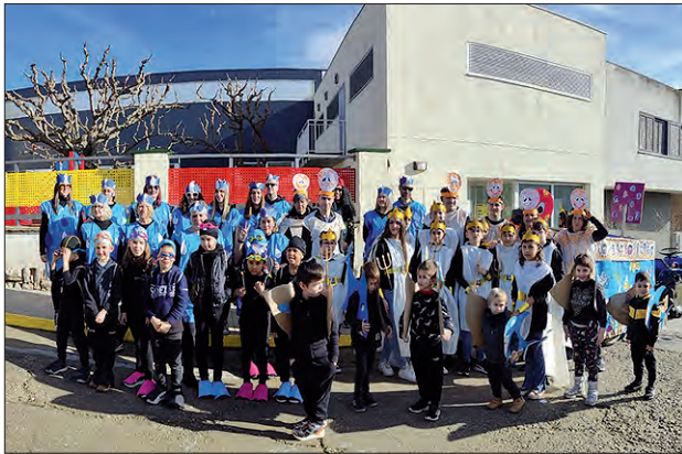
Participants a la rua de Carnestoltes

La Ràpita va celebrar el seu carnestoltes, el passat divendres 9 de febrer, amb una rua que estava organitzada per l'escola juntament