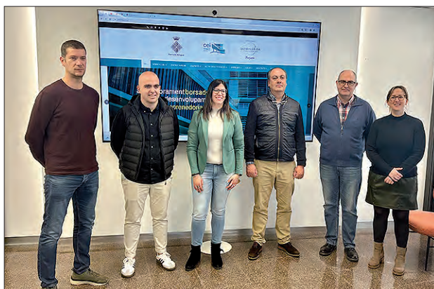
Presentació de la nova web del CEI

El Centre d'Empreses i Innovació de Balaguer ha renovat la seva pàgina web, amb un disseny i imatge actualitzada, amb més usabilitat, i per tant molt més intuïtiva i de fàcil accés.