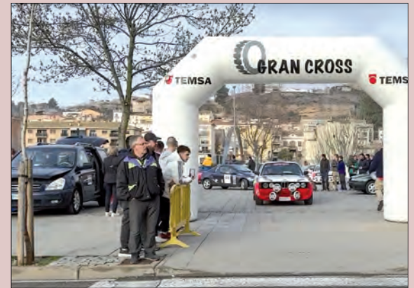
Sortida dels cotxes

Durant la dècada dels anys 80 i 90, Balaguer acollia una prova de ral·lis de terra d'àmbit nacional.