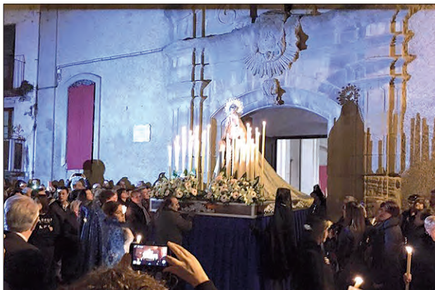
Processó de Setmana Santa a Balaguer

El proper dissabte 24 de febrer a les 19h tindrà lloc a l'església de Sant Josep de Balaguer el pregó de Setmana Santa 2024. Enguany