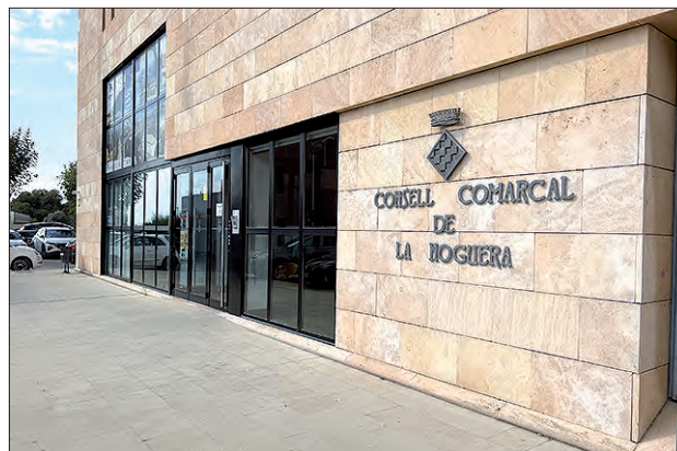
Consell Comarcal de la Noguera

Aquesta transformació representa un avenç significatiu en la modernització i l'eficiència dels serveis informàtics municipals. La migració al núvol trasllada les dades, les aplicacions i altres actius digitals dels ajuntaments cap als centres de dades gestionats pel proveïdor del núvol,