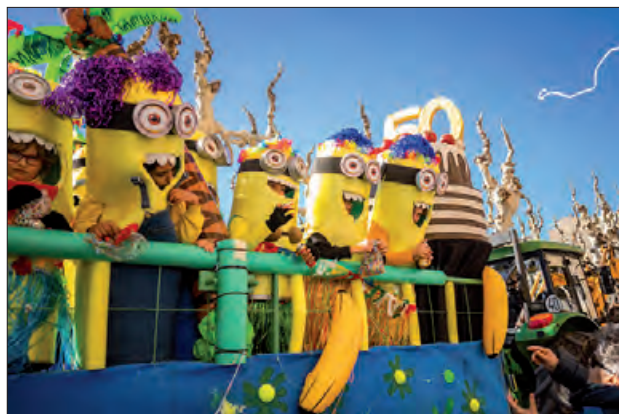
Carnestoltes de l'any passat