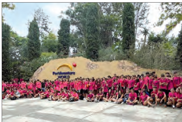
JoVa activitat d'estiu pels joves de la comarca

Un gran treball anual dedicat als joves que abasta un gran públic que utilitza el ventall de possibilitats ofertes.