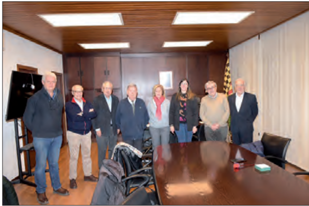
Presentació de la nova Junta

En el 2026 es farà la celebració dels 40 anys de l'agermanament entre Catalunya i Califòrnia, i per aquest motiu, els membres l'Associació Amics de Gaspar de Portolà, ja estan preparant diferents activitats per fer una celebració solemne.