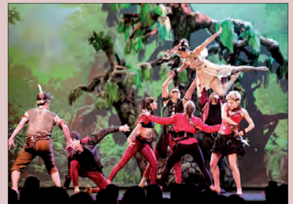
L'ombra de Peter Pan al Teatre Municipal

La informació de les obres i la compra d'entrades i abonaments es pot fer a l'Oficina de Turisme o a través de la pàgina www.entradesteatre.balaguer.cat