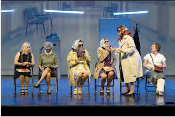
Una escena de l'obra

El proper diumenge 16 de febrer, el grup de teatre Entr'acte representarà l'obra "9 a 5", a partir de les 18 h al Teatre Municipal, en benefici de Mans Unides. Les entrades a 12 euros, es poden comprar