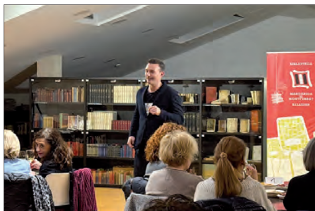
Una de les sessions anteriors

Enguany s'ha pensat en programar també una activitat infantil el proper dijous 27 de febrer, amb una Hora del Conte