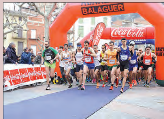
Una edició anterior

Enguany, l'àrea d'Esports de la Paeria ha posat en marxa el repte "Entrena't per la Mitja Marató Ciutat de Balaguer", una iniciativa destinada a promoure l'activitat física i els hàbits de vida saludables mitjançant una dinàmica gamificada. El repte es desenvolupa del 10 de febrer al 9 de març i té com a objectiu que els participants completin un mínim de 50 km corrent o caminant durant aquest període. Entre totes les persones que aconseguixin assolir l'objectiu, se sortejaran vals bescanviables per material esportiu en establiments comercials de la ciutat.