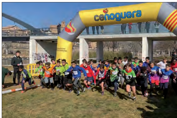
Cros de l'any passat

Oberta a tots els escolars des de les llars d'in-