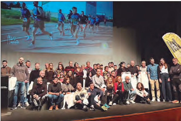
Participants a la Gala de les Mitges de Ponent

El passat divendres 31 de gener es va celebrar al Teatre l'Amistat de Mollerussa la 10a edició de la Gala de les Mitges de Ponent. Aquesta gala premia als atletes amb més punts de les 4 mitges maratons de Ponent; Tàrraga, Balaguer, Mollerussa i Lleida.