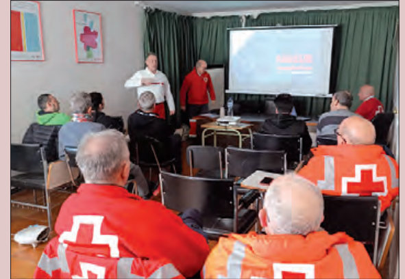
Un moment de la formació teòrica

Balaguer va acollir el passat dissabte 7 de febrer, una formació específica en emergències davant les inundacions, organitzada per Creu Roja, i que forma part del Pla Específic de Capacitacions. Aquesta anava adreçada al voluntariat de Creu Roja, el qual forma part dels Equips de Resposta Bàsica en Emergències.