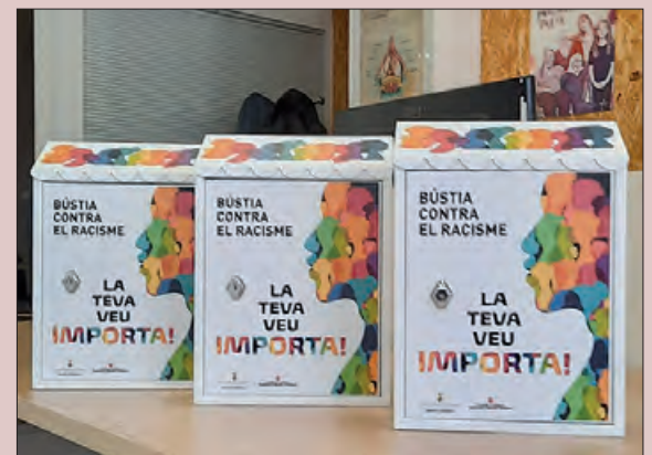
Imatge de les bústies

Aquest departament del Consell, dona suport als ajuntaments en l'impuls de polítiques en aquest àmbit amb l'objectiu d'afavorir la convivència i la diversitat, i promoure la integració i cohesió social a la Noguera.