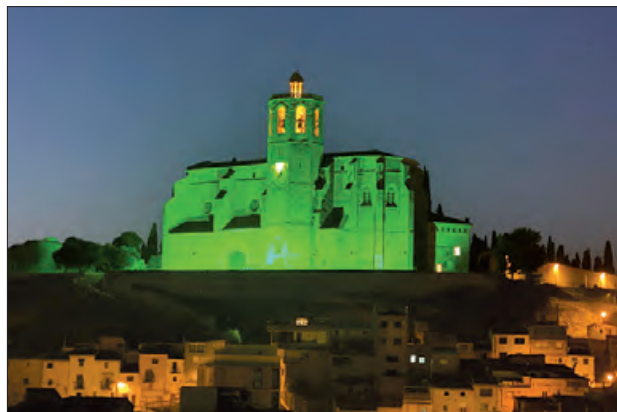
Santa Maria il·luminada de verd

El passat 4 de febrer, amb motiu del Dia Mundial Contra el Càncer, Balaguer, va il·luminar de verd, color de l'esperança, l'església de Santa Maria per donar visibilitat a aquesta malaltia i sensibilitzar a la població. A part, durant el cap de setmana previ el Club Futbol Balaguer i el Club Bàsquet Balaguer van lluir braçalets o tires verdes durant les seves competicions esportives.