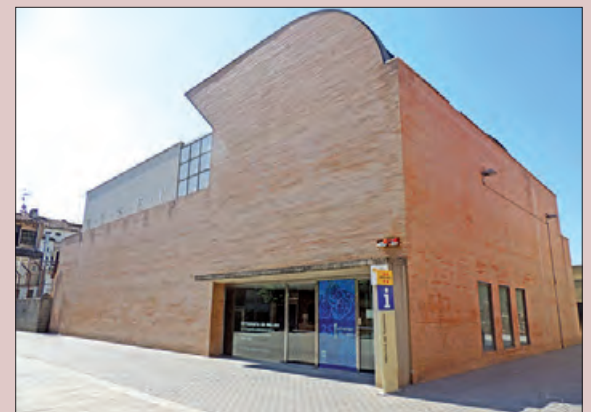
El proper espectacle es farà al Museu de la Noguera

La venda d'entrades es farà als mateixos equipsaments on es duguin a terme les propostes.