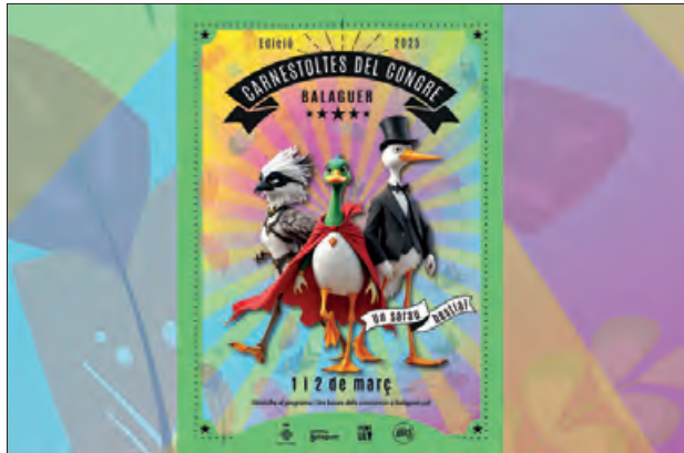
Cartell del Carnestoltes 2025