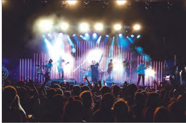
Comarkalada 2024 a Cubells

A la mateixa Oficina Jove també s'han programat cursos de monitor i premo-