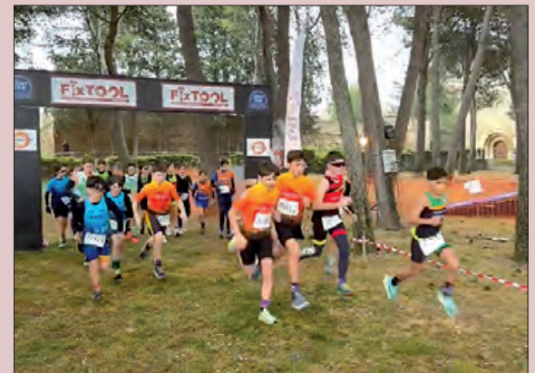
Un moment de la cursa

Els primers a competir van ser els atletes federats, en les categories infantil, cadet i juvenil. Un cop es va acabar l'entrega de premis es va continuar amb les proves per a prebenjamins, benjamins i alevins.