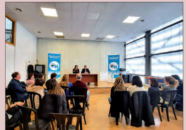
Presentació de la 2a Jornada d'Ocupació de la Noguera

Les persones i empreses interessades a inscriure's a la Jornada d'Ocupació ho poden fer a través dels enllaços o codi QR que apareixen a les xarxes socials i als cartells publicitaris de la jornada. La inscripció és gratuïta. Trobareu més informació al compte d'Instagram de la Mesa d'Ocupació: @ocupacionoguera.