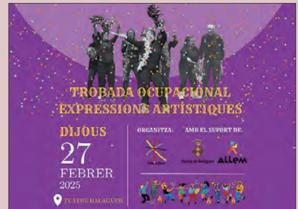
Cartell de la Trobada

El Taller L'Estel seran els encarregats d'organitzar aquesta jornada amb actuacions musicals i petites representacions teatrals, amb la participació de 306 persones de 18 centres de les terres de Lleida.