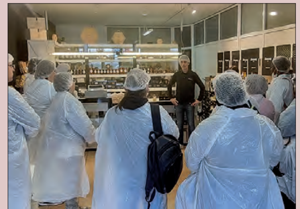
Una de les visites a empreses del territori

En la darrera edició del programa, que va finalitzar al desembre del 2024, de les 92 persones ateses el 64,4% van trobar feina durant la seva participació i 26 han realitzat accions formatives per millorar la seva ocupabilitat. També es van realitzar 18 visites a empreses de la zona, per tal de promoure el coneixement del teixit empresarial del territori.