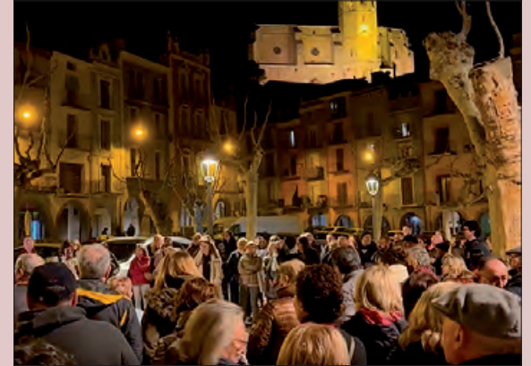
Un moment de la concentració

Més de 200 veïns i veïnes de Balaguer, en especial del centre històric, es van manifestar el passat dilluns 17 de febrer a la Plaça Mercadal, amb l'objectiu d'exigir un canvi immediat en la situació d'inseguretat, degradació i manca de qualitat de vida que afecta el barri.