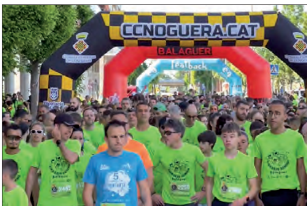
Cursa i caminada de la Fira dels Somnis