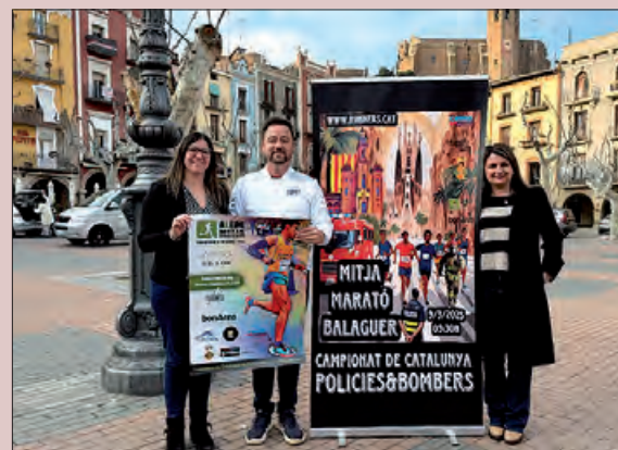
Presentació de la cursa

El recorregut està homologat per la Federació Catalana d'Atletisme, a més de comptar per al Circuit de Mitges de Ponent.