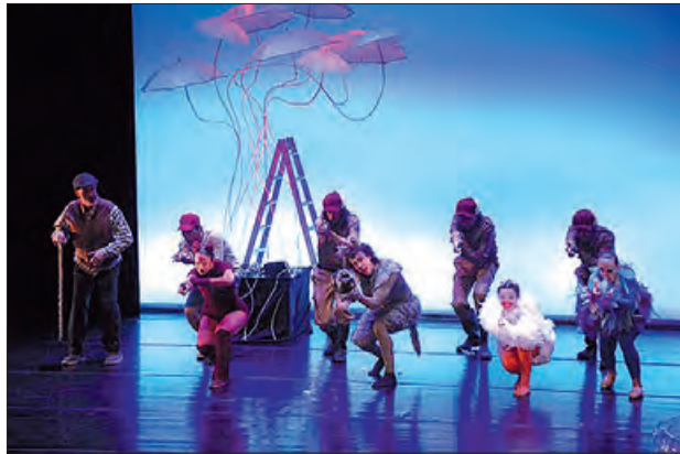
Espectacle de cloenda Pere i el llop

Aquest és un espectacle de dansa i música en viu dirigit al públic familiar. En Pere és un jove entremaliat que viu en una cabana del bosc amb el seu avi. Des de sempre ha conviscut amb els animals que hi habiten convertint-se en el seu millor amic i defensor. En aquesta obra musical de Serguei Prokófiev, tots els animals del bosc conviuen i es defensen els uns els altres del seu pitjor enemic: l'home. Tanmateix, en Pere és un humà diferent, amic