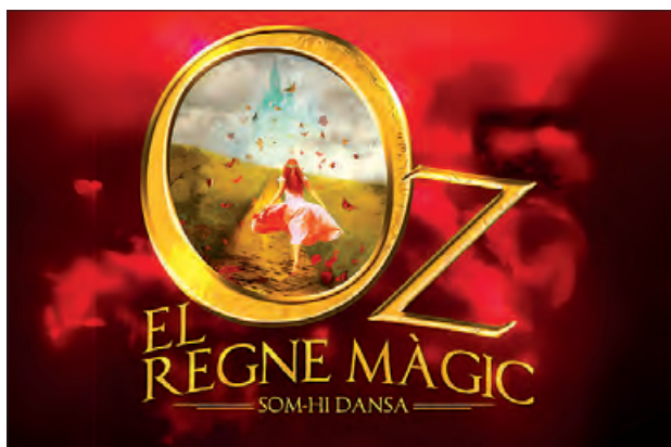
Oz, el regne màgic el 22 de març al Teatre Municipal