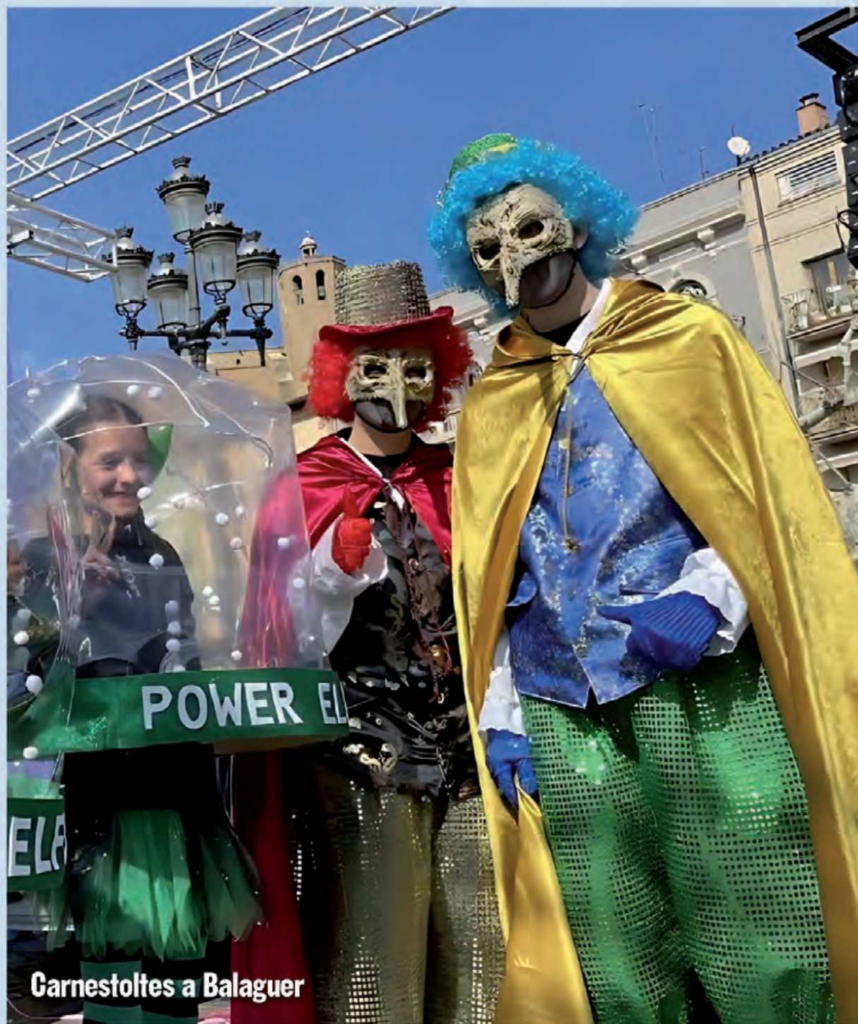
Carnestoltes a Balaguer

Els propers dies 1 i 2 de març Balaguer celebrarà el Carnestoltes del Congre