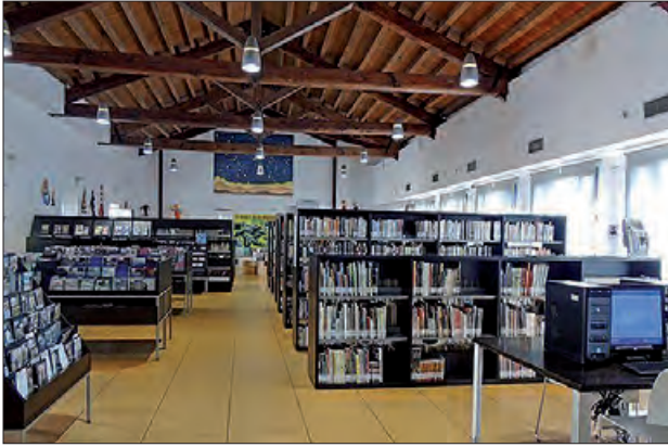
Biblioteca Margarida de Montserrat

Aquesta mes de febrer s'han reprès les trobades dels diferents clubs de lectura d'adults després d'una breu aturada.