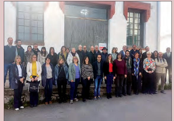
Imatge de la trobada

El pressupost és de 151.460,50 euros, cobert parcialment per una subvenció del SOC dins del seu programa "Innovadors i Experimentals 2024", valorada en 113.595,37 d'euros.