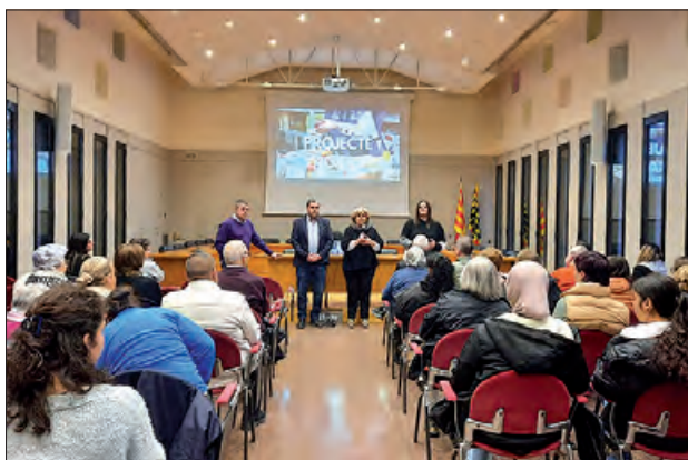
Un moment de la trobada

El 24 de febrer el Consell Comarcal de la Noguera va organitzar una trobada amb totes les persones i entitats que de manera voluntària han participat durant l'any 2024 activament en el projecte Àgape,