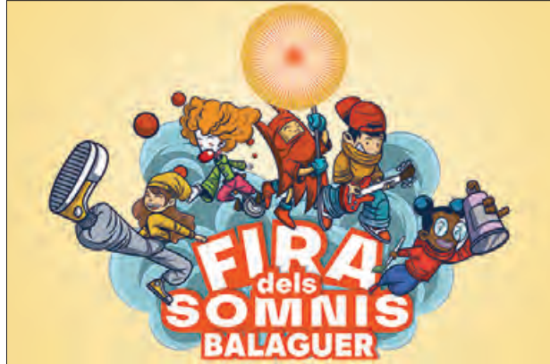
Imatge de la Fira dels Somnis

Entre les activitats que ja es porten a terme cal destacar les accions pedagògiques que fan 26 centres educatius i 11 residències geriàtriques de la Noguera, Urgell, Pla d'Urgell i el Segrià, interactuant conjuntament en una experiència que s'anomena Somiem junts petits i grans, que a través d'hores de contacte entre infants i