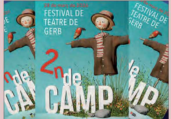
El cartell del Festival

Gerb celebra la segona edició del Festival de Camp el proper 28 de març.