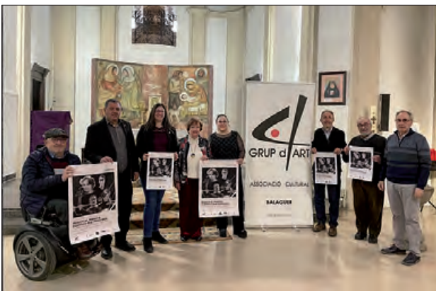
Moment de la presentació

L'església del Miracle de Balaguer acollirà el diumenge 12 d'abril la tercera audició del cicle de Concerts al Miracle, organitzat per l'Associació Cultural Grup d'Art'4.