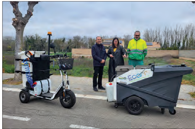
Un moment de les proves