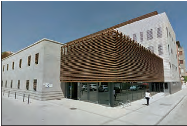
CAP II de Balaguer

El sindicat CSIF ha alertat de problemes d'aparcament i accessibilitat a l'entorn del Centre d'Atenció Primària de Balaguer, una situació que, segons denuncien, està afectant tant els usuaris com els professionals sanitaris i repercuteix directament en la qualitat assistencial.