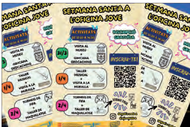
Cartell de les activitats

L'Oficina Jove del Consell Comarcal encara les properes festes escolars de Setmana Santa amb dife-