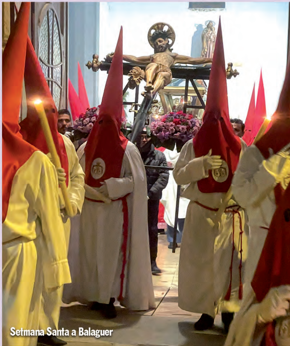
Setmana Santa a Balaguer