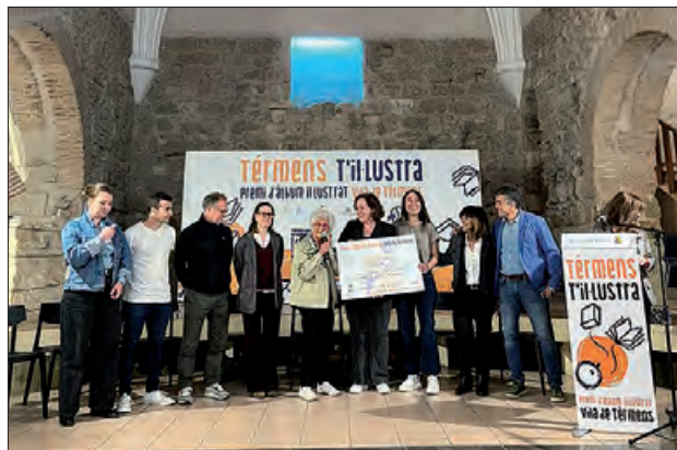
Entrega del Premi