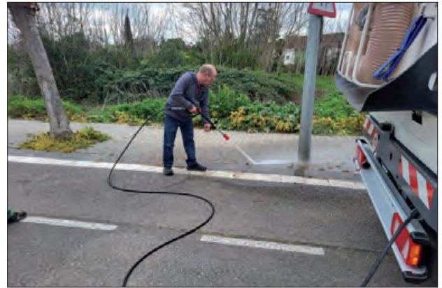
Un moment de les proves

En aquest sentit, també la Paeria de Balaguer ha