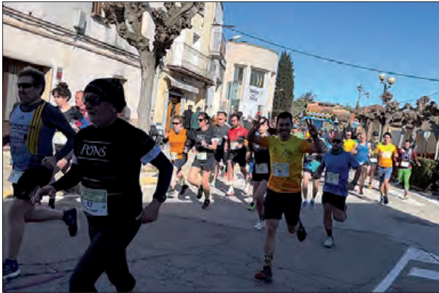
Un moment de la prova

Menàrguens ha acollit aquest el passat diumenge la 12a edició de la Cursa del Sucre. La prova, que és puntuable per la Lliga Ponent 2026, ha reunit a unes 350 persones entre les curses de 10 i 5 kilòmetres, una caminada i curses infantils.