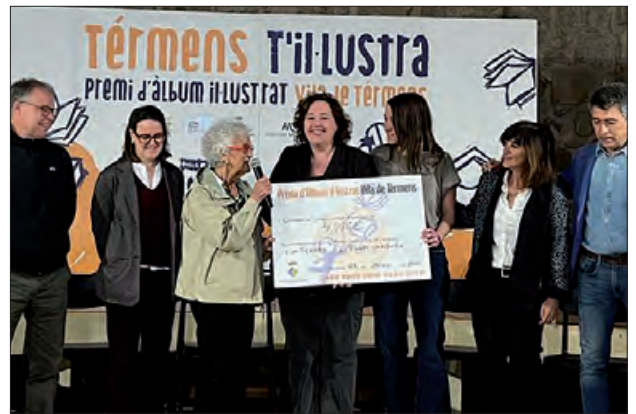
Entrega del Premi

El jurat del premi ha estat presidit per l'escriptor, editor i mestre, Ramon Besora i format també per l'impulsor de