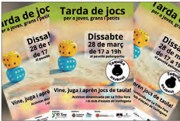
Cartell de l'Activitat

El pròxim dissabte 28 de març a les 5 de la tarda celebrarem la segona edició de jocs de taula. Després de l'èxit de la primera tarda de jocs, l'As-