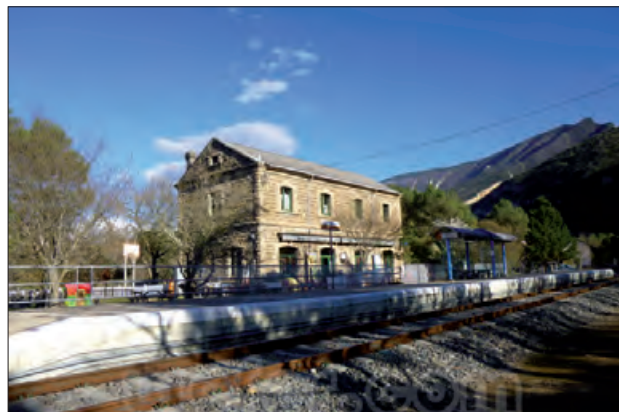
Baixador de Cellers-Llimiana

La nova passarel·la permetrà millorar notablement la seguretat ferroviària i viària i el confort de les persones que accedeixin al baixador així com la