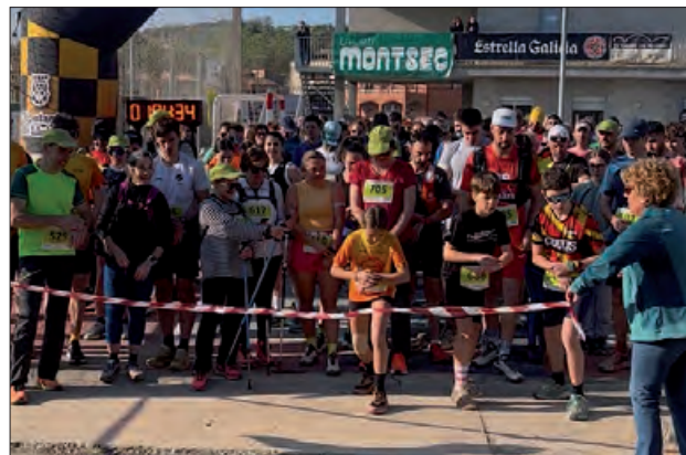
Un moment de la sortida

La caminada era un circuit circular entre els pobles de les Avellanes i Tartareu, que compta com un dels punts atractius el seu pas pel convent de les Avellanes. Així, la cursa ha transcorregut pels quatre pobles que formen part del municipi de les Avellanes i Santa Linya (Tartareu, les Avellanes, Santa Linya i Vilanova de la Sal).