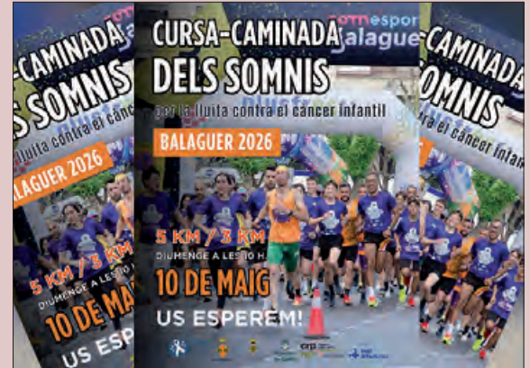
Cartell de la cursa-caminada

A més de la cursa de 5 i 3 km, hi haurà una fira amb activitats, tallers i exhibicions