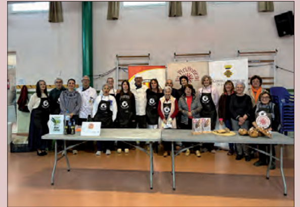
Foto de grup

La Sentiu de Sió va acollir el passat 21 de març un nou taller “Del Blat a la Taula”, organitzat pel Consell Comarcal de la Noguera amb la col·laboració del Gremi de Forners de Lleida.