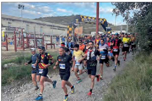
Un moment de la prova