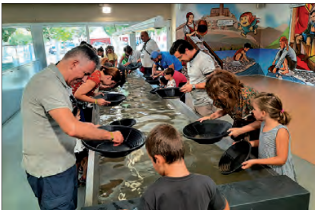
Espai expositiu del Centre d'Or

El Centre d'Interpretació de l'Or del Segre amplia el seu horari de visites durant la Setmana Santa i proposa una nova activitat «Recerca d'or en família», una experiència única, emocionant i molt divertida que convida