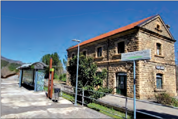
Baixador de Cellers-Llimiana

Ferrocarrils de la Generalitat de Catalunya (FGC) ha licitat avui les obres per a la construcció d'una passarel·la per a vianants al baixador de Cellers-Llimiana (Castell de Mur), a la línia Lleida-La Pobla de Segur.