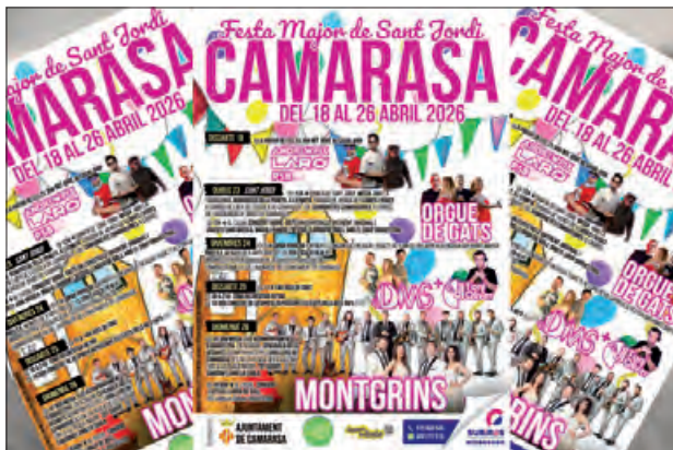
Cartell de la Festa MAJOR

Setmana de Festa Major de Sant Jordi a Camarasa, des del 18 al 26 d'abril