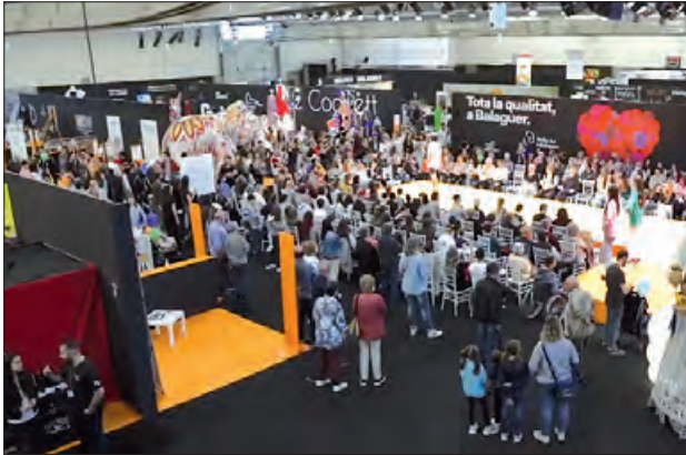
Un moment de l'any passat

La jornada de dissabte arrencarà a les 10.00 hores amb una xerrada sobre streaming i televisió global a càrrec de Balaguer TV, que donarà pas a la passarel·la canina Del refugi a casa, organitzada per l'Associació d'Animals Aglà, on desfilaran gossos adoptats per visibilitzar la segona oportunitat.