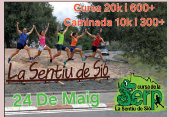
Cartell de l'activitat

El dia 24 de maig La Sentiu de Sió celebrarà la vuitena edició de la Cursa de la Serp i ha obert el període d'inscripcions. La prova, organitzada per l'Associació Cultural i Esportiva Erpeton i l'Ajuntament de La Sentiu, forma part del calendari de la Lliga de la Noguera.