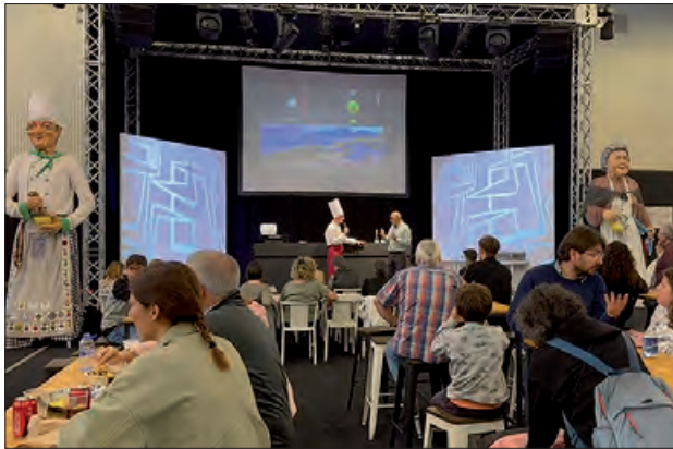
Un moment de l'any passat

Aquesta jornada és organitzada pel departament d'Agricultura, Ramaderia, Pesca i Alimentació de la Generalitat de Catalunya, pels Apicultors Lleidatans Associats i Escola Agrària de Vallfogona de Balaguer.