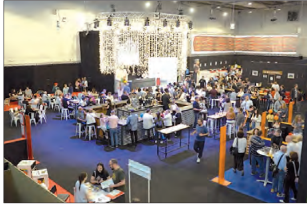
Un moment de l'any passat

A a tarda lo Sr. Postu dinamitzarà un taller infantil de coques de recapte i samfaina a càrrec del Gremi de forners de les Terres de Lleida, organitzat per la Societat Gastronòmica i Cultural del Com-