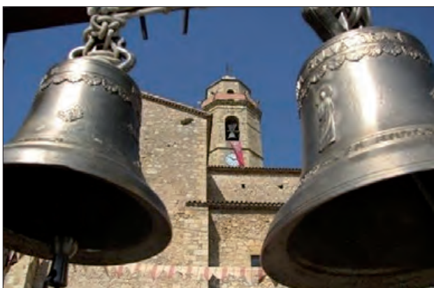
Imatge del Campanar d'O's

Cal destacar que, paral·lelament als actes centrals, durant tot el dia es podrà gaudir de demostracions de pintura en directe i diverses activitats infantils. En definitiva, aquesta trobada no és només una cita imprescindible per als amants de la cultura de les campanes, sinó també una oportunitat per descobrir la riquesa cultural, humana i gastronòmica d'aquesta zona.