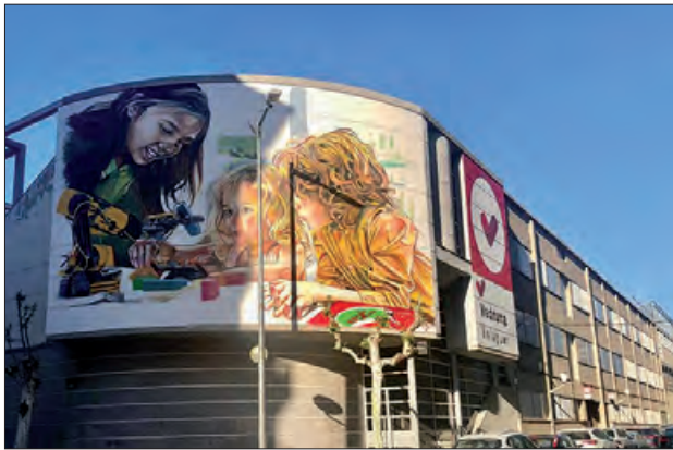
L'Escola Vedruna a Balaguer

L'escola Vedruna Balaguer commemora els 200 anys de la seva fundació, una trajectòria plena d'història, educació i comunitat. Els actes començaran amb