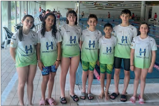
Els participants del CEN

El pas del Club Esportiu Natació Balaguer per la setena jornada de la Lliga Catalana, celebrada a les instal·lacions del CN Mollerussa, s'ha tancat amb un balanç excel·lent de cinc podis. La jornada va desta-