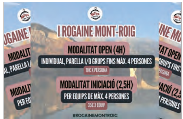
El cartell de la prova

Els participants podran triar entre dues modalitats de cursa. D'una banda, la modalitat Open, de quatre hores de durada, està pensada per a corredors amb experiència i inclou recorreguts exigents que travessen zones de gran desnivell. La inscripció té un cost de 18 € per persona, amb un lloguer de xip de 5