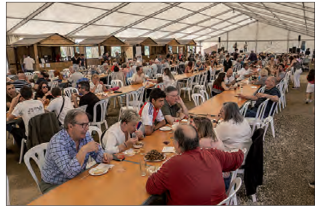
Imatge de la passada edició

D'altra banda, l'oferta es completarà amb