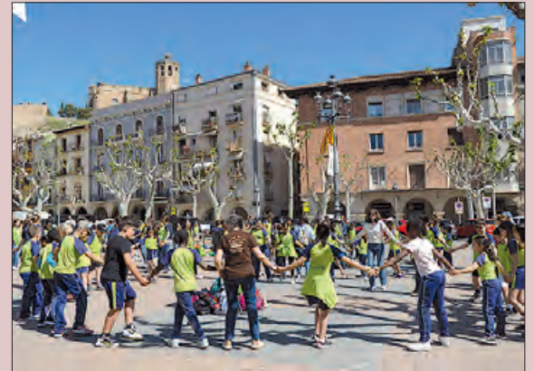
Imatge de la passada edició

El dia de la dansa acollirà per segon any consecutiu la trobada sardanista escolar del Pla Saltem i Ballem, amb dos-cents deu alumnes provinents de l'Escola Àngel Guimerà, l'Escola Gaspar de Portolà, l'Escola Pia, l'Escola la Noguera i l'Escola Mont-roig.