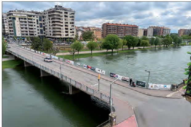
El pont de Balaguer amb les pancartes dels col·laboradors

i els clubs esportius de la comarca, que han realitzat comandes massives. Ara, la venda oberta al públic general i particulars, ha generat un ritme de compres que confirma l'alta implicació de la ciutadania, superant les 1.200 samarretes venudes.