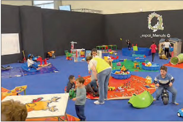
Un moment de l'any passat

L'Espai Infantil Menuts Q, és un espai ludoteca amb canguratge, adreçat a nens i nenes de 3 a 12 anys, amb diferents activi-