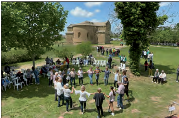
L'Aplec de l'any passat

Balaguer tancarà tot un any d'activitats commemoratives dels cinquanta anys de l'estrena de la sardana 'Balaguer ciutat comtal'