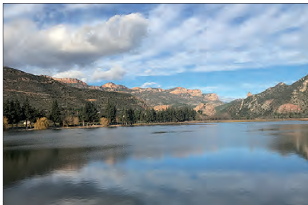
La zona del Montroig des del pantà de Sant Llorens

Les inscripcions ja estan obertes i es poden formalitzar a través de la pàgina web de Ponent Orientació.