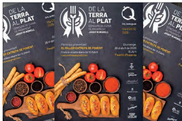
El cartell d'aquest any

El concurs pretén promoure els productes de la zona, i en especial donar a conèixer els plats que s'hi elaboren. Aquest any se celebra el 10è aniversari d'aquest concurs totalment consolidat i aquest 2026 se busca el millor entrepà de Ponent. Un format molt representatiu del nostre dia a dia i on tots els participants podran elaborar aquest