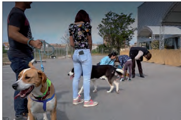
Un moment de l'any passat