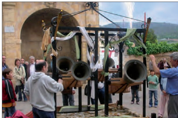
Imatge de passades edicions

El matí continuarà amb l'essència sonora de la festa: entre les 10 i les 12 hores, els assistents podran gaudir de la tradicional demostració de tocs des del campanar, executats amb mestria pels professionals i aficionats participants. Un dels moments més emotius es viurà