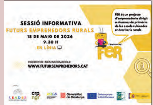
Cartell de la sessió

Les escoles ja poden inscriure's al projecte Futurs Emprenedors Rurals, una iniciativa que porta l'emprenedoria a l'aula de cicle superior de primària, connectant l'alumnat amb la realitat del món rural. La sessió informativa per al professorat es celebrarà en línia el 18 de maig a les 9.30h, i oferirà tots els detalls sobre els recursos disponibles i el funcionament del projecte.