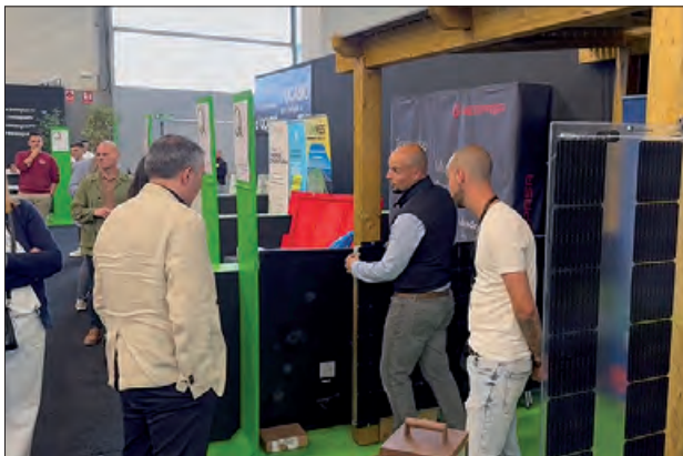
Imatge d'una edició anterior

18.00 h Xerrada d'aerotèrmia, a càrrec de Treginer Instal·lacions.